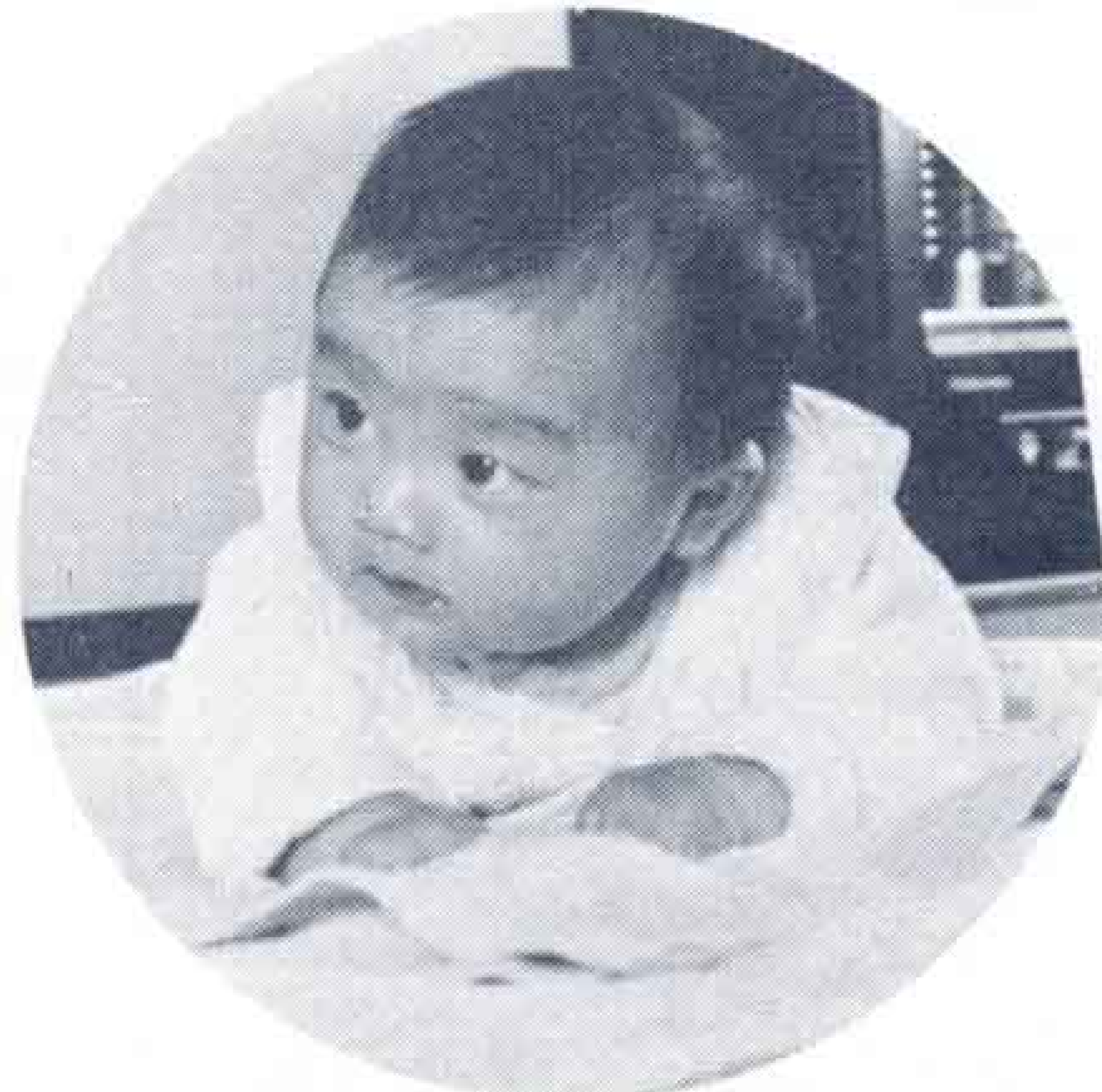
腹ばいにもなれるんだ…

お父さんとお母さんが話しかけてくると、ニッコリ笑ってあげるんだ。とっても喜ぶヨ。夜もグッスリ朝まで寝ちゃうの…。