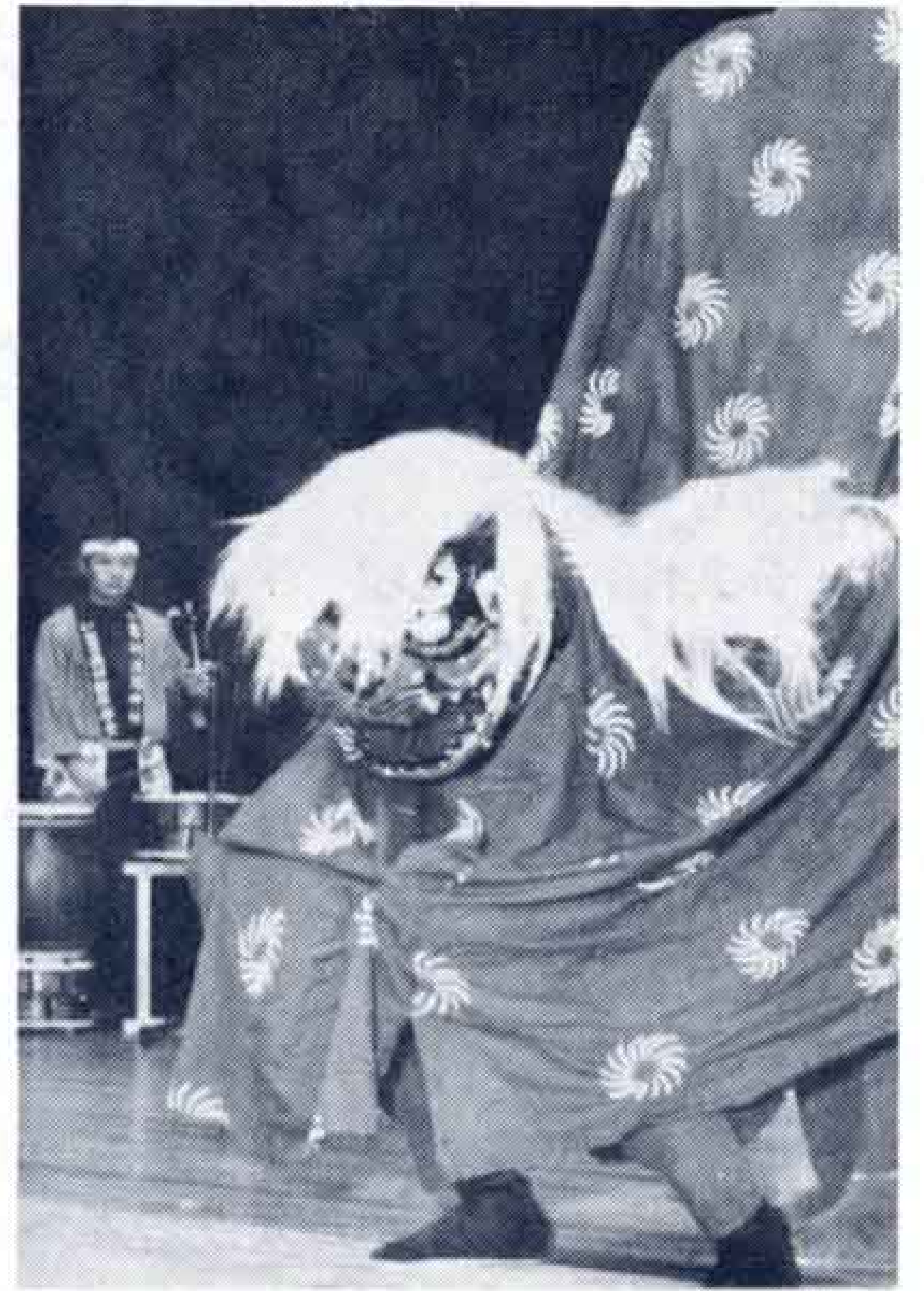
▲富士岡の神楽も祝福