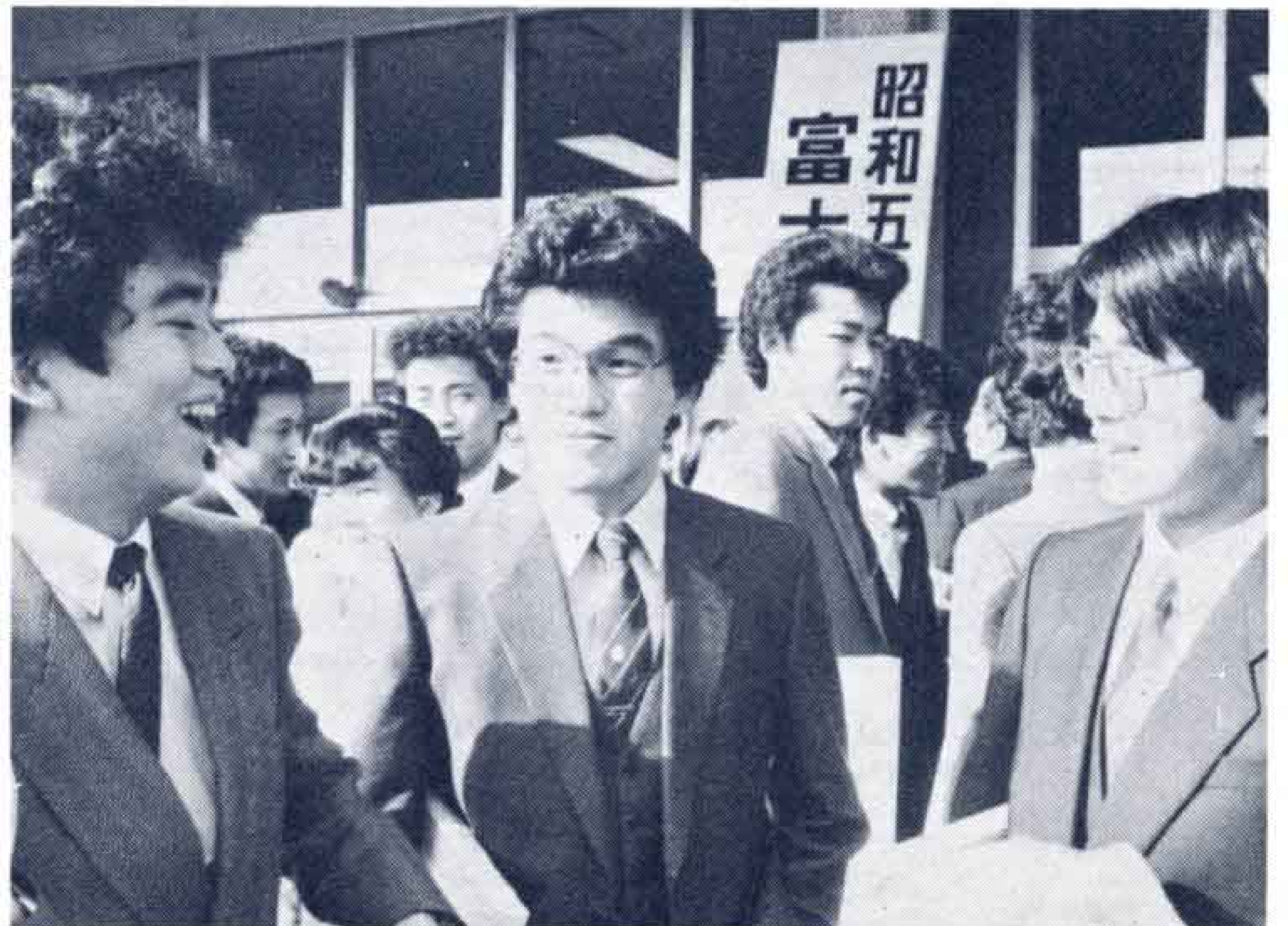
▲やあ！しばらくだなア