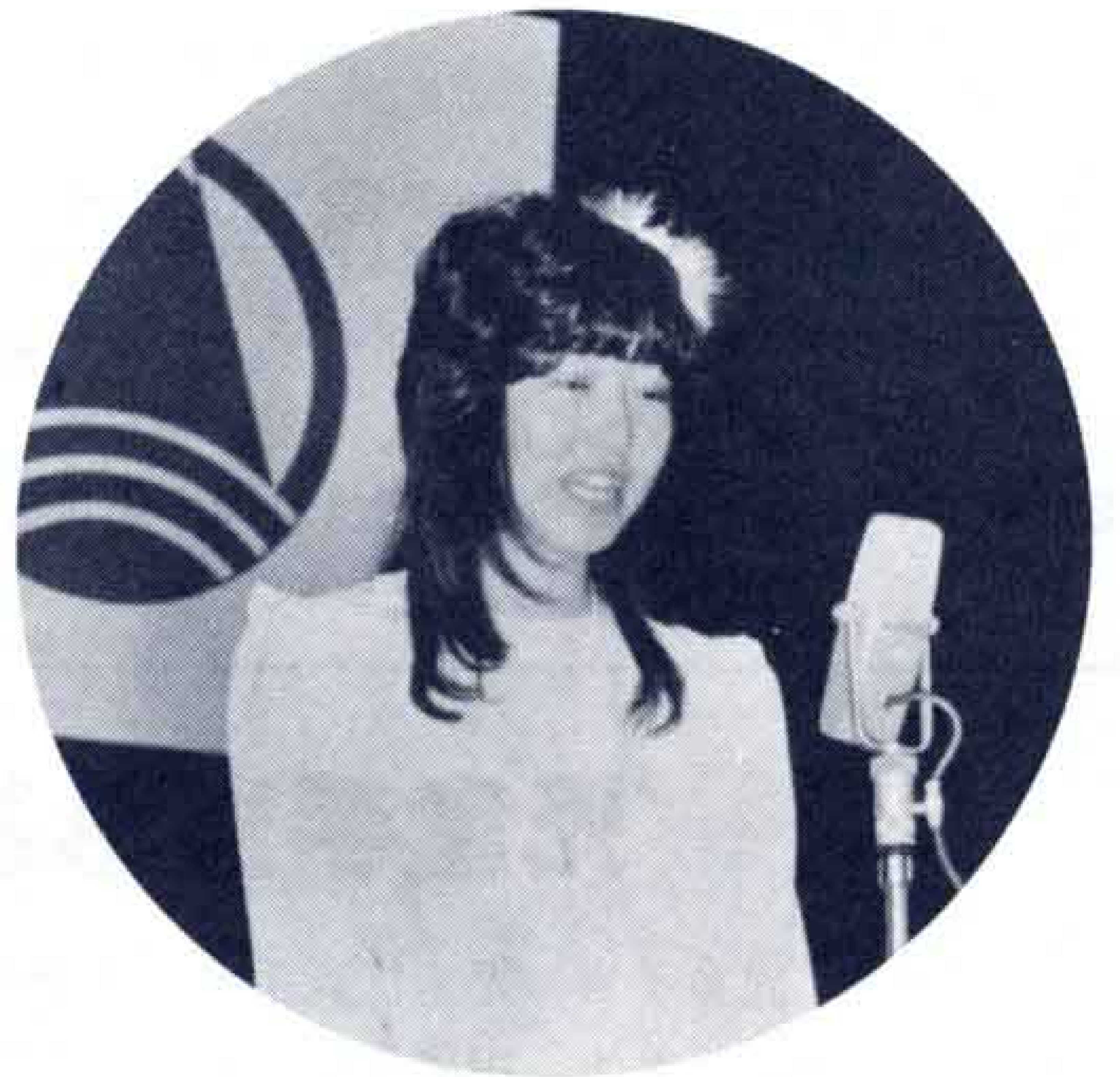
▲成人の主張を発表

会場は、振袖姿の女性ではなやいだ雰囲気につつまれ、久しぶりにあった友だちとなつかしそうで話す光景が、あちらこちらで見られました。