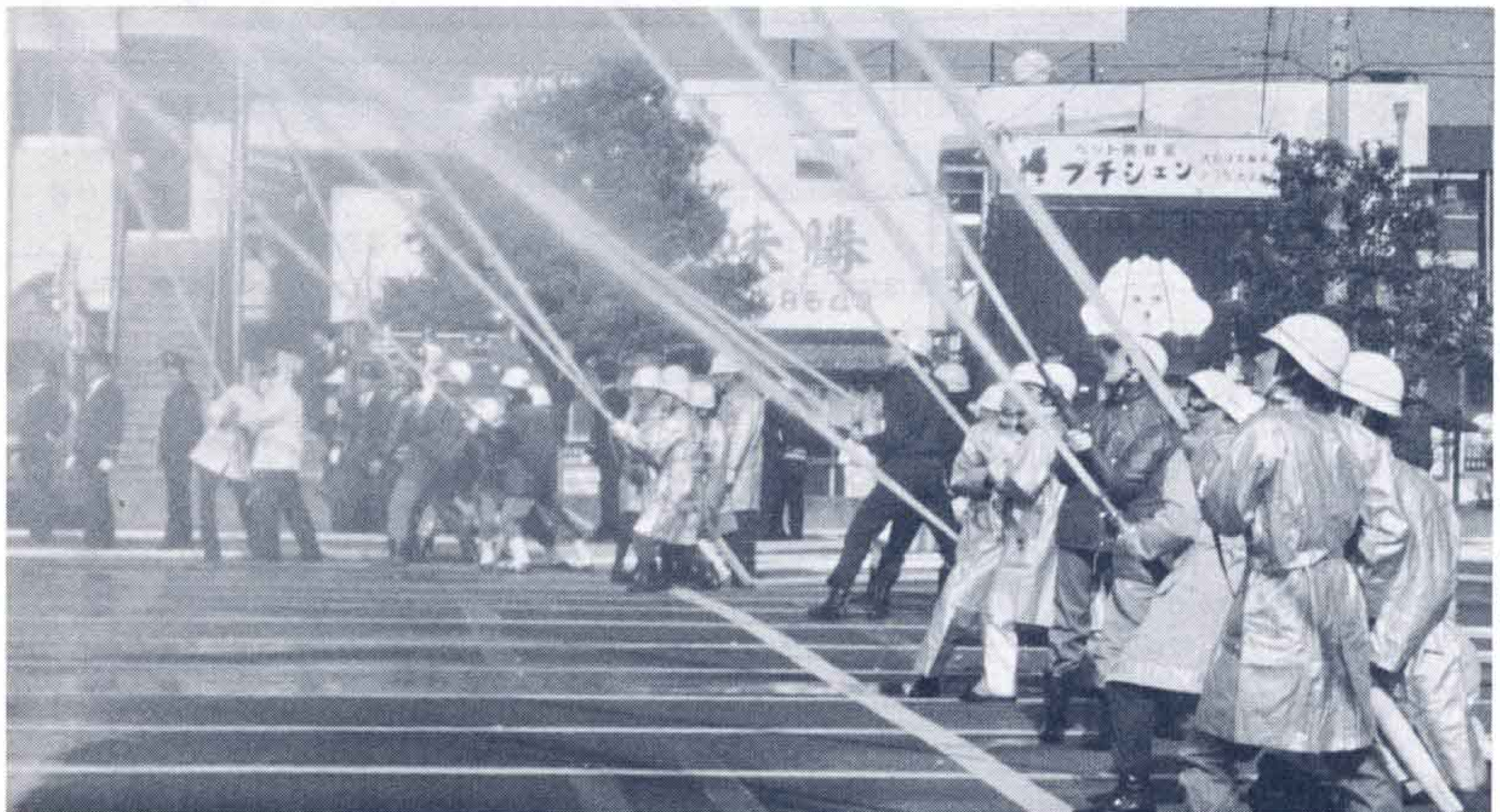
◀ナイヤガラの滝をおもわせる一斉放水