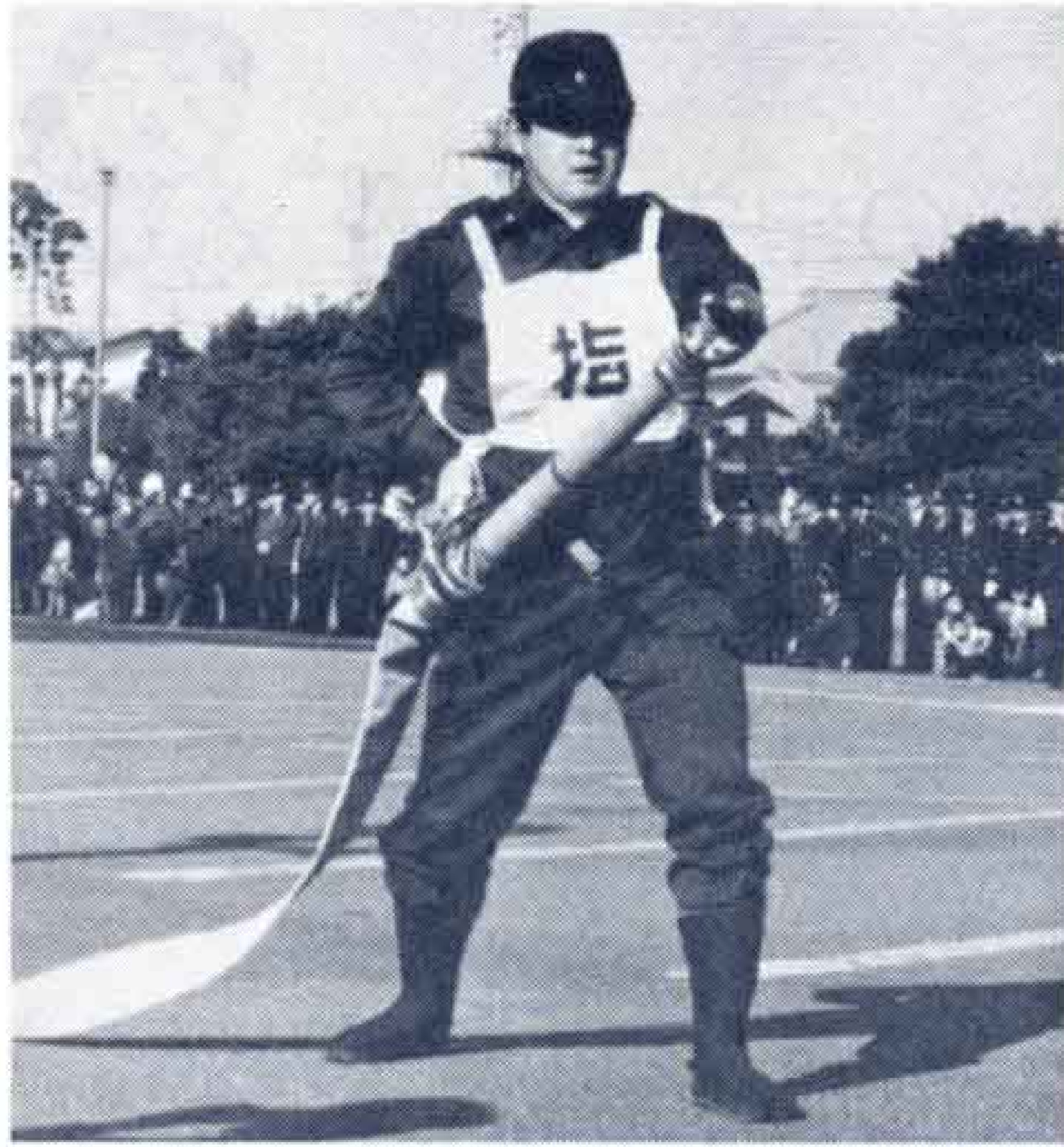
▲きりりとひきしめた顔の消防士