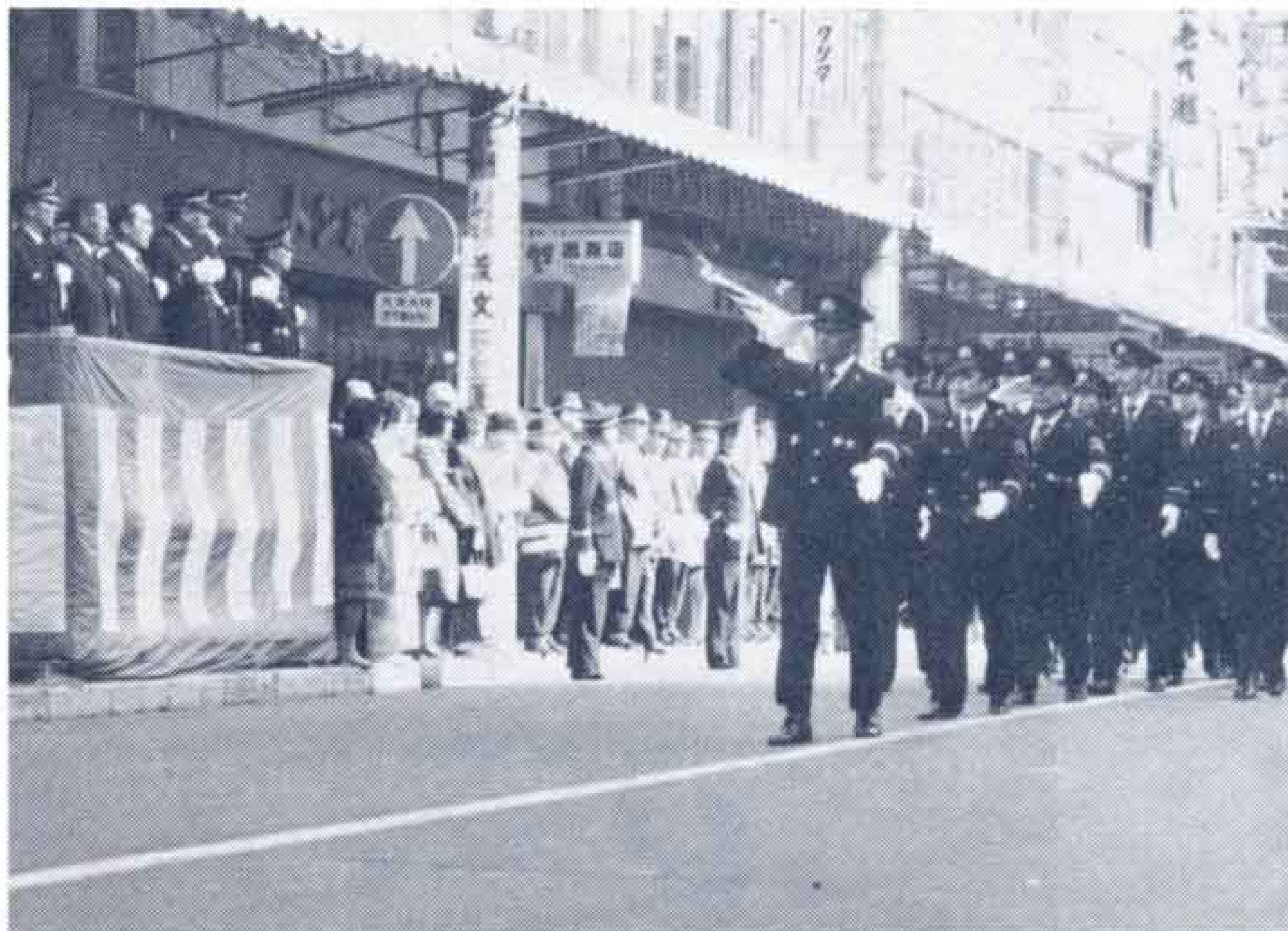
▲吉原本町をどうどの分列行進