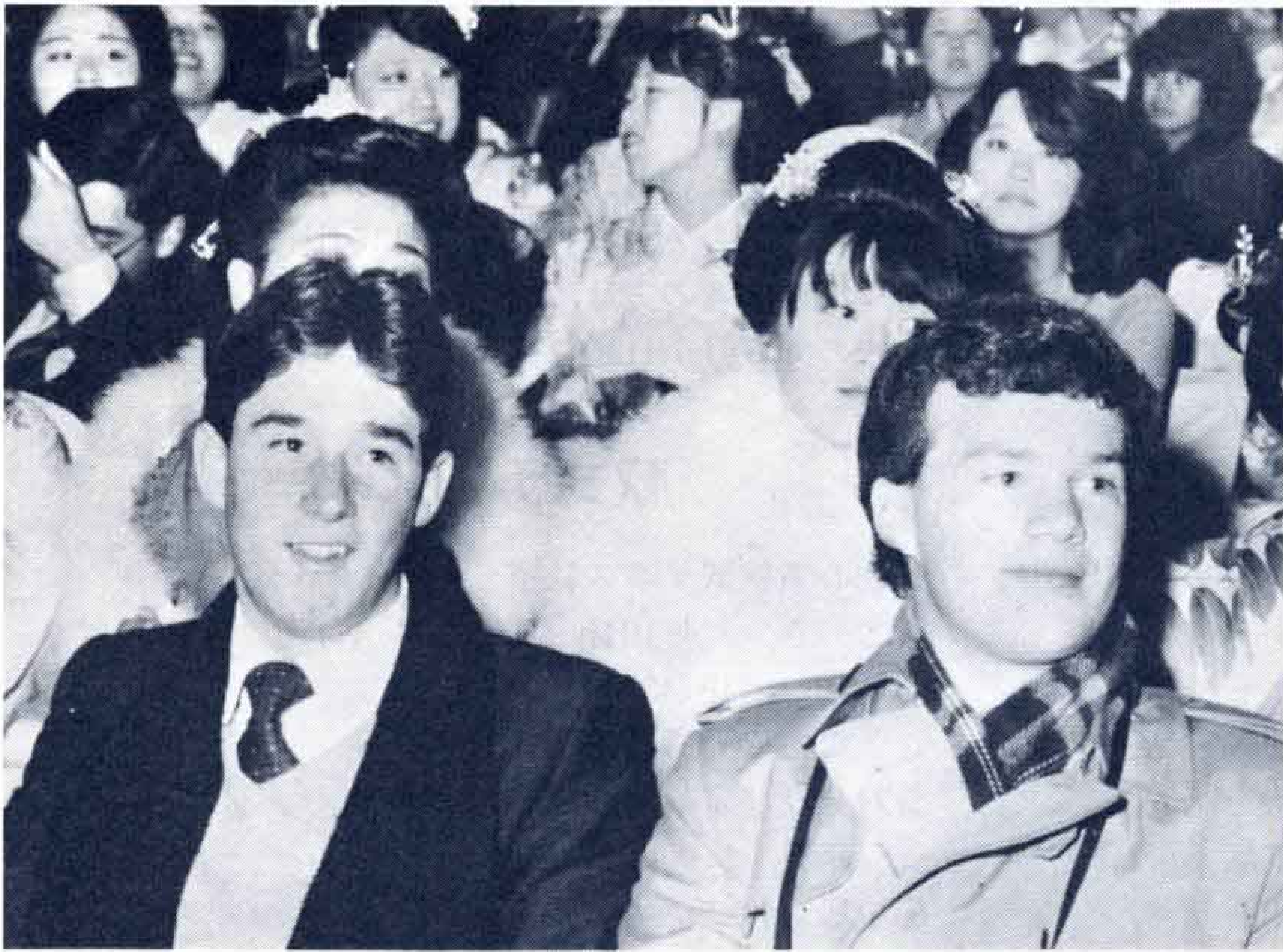
▲外国人の成人者も…