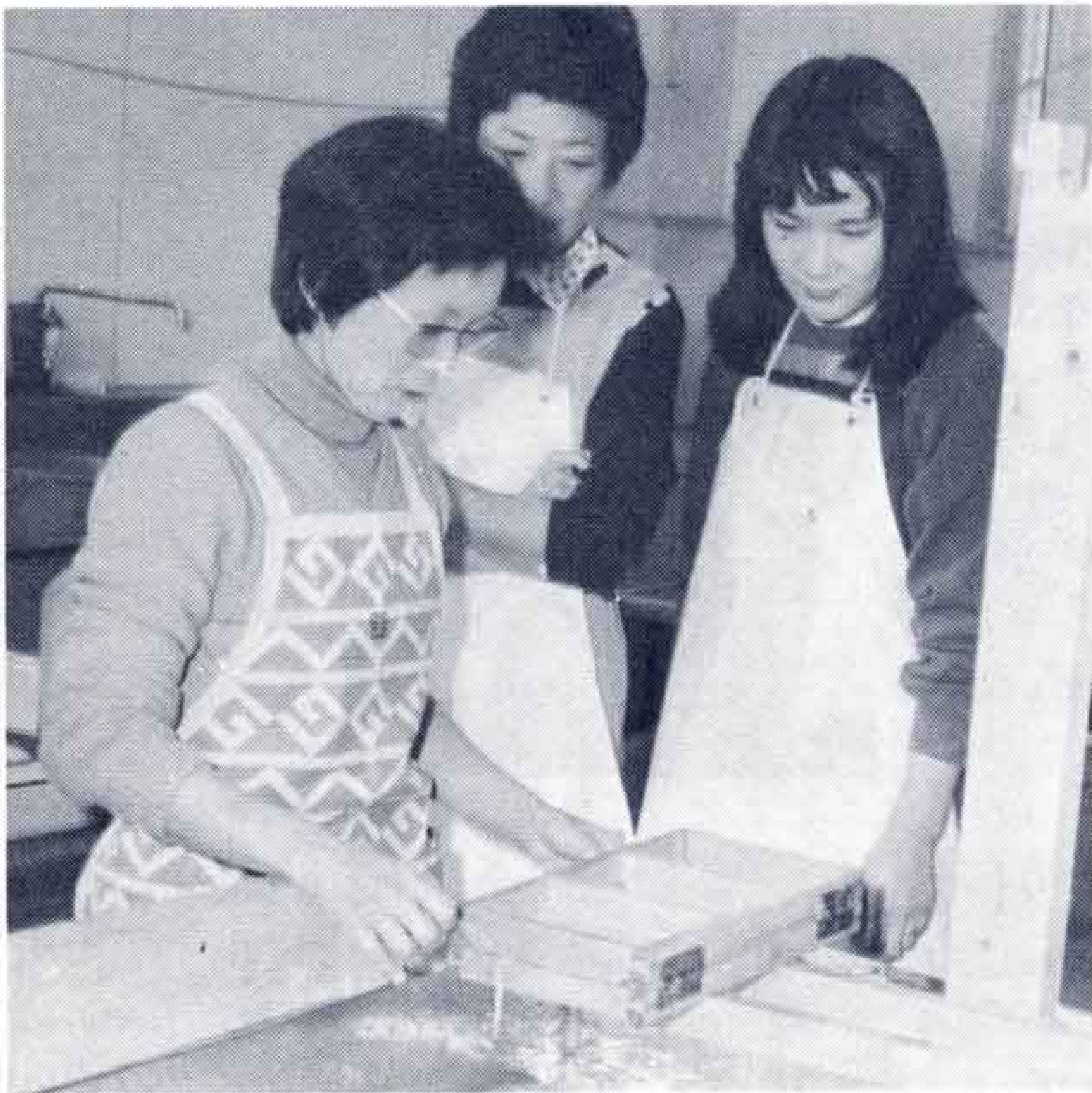
△なかなかむずかしいワ...