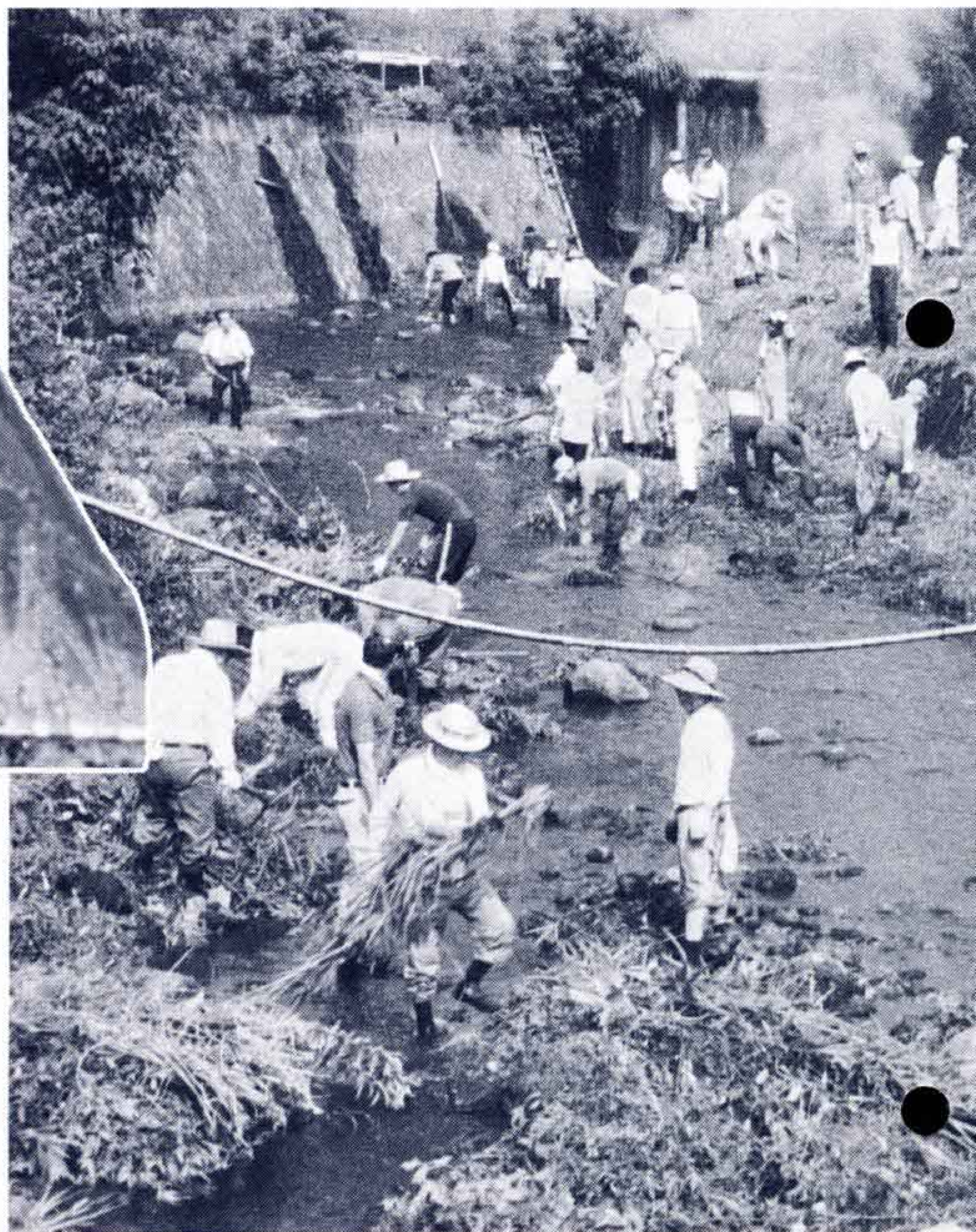
△永明寺横の自然公園予定地を清掃