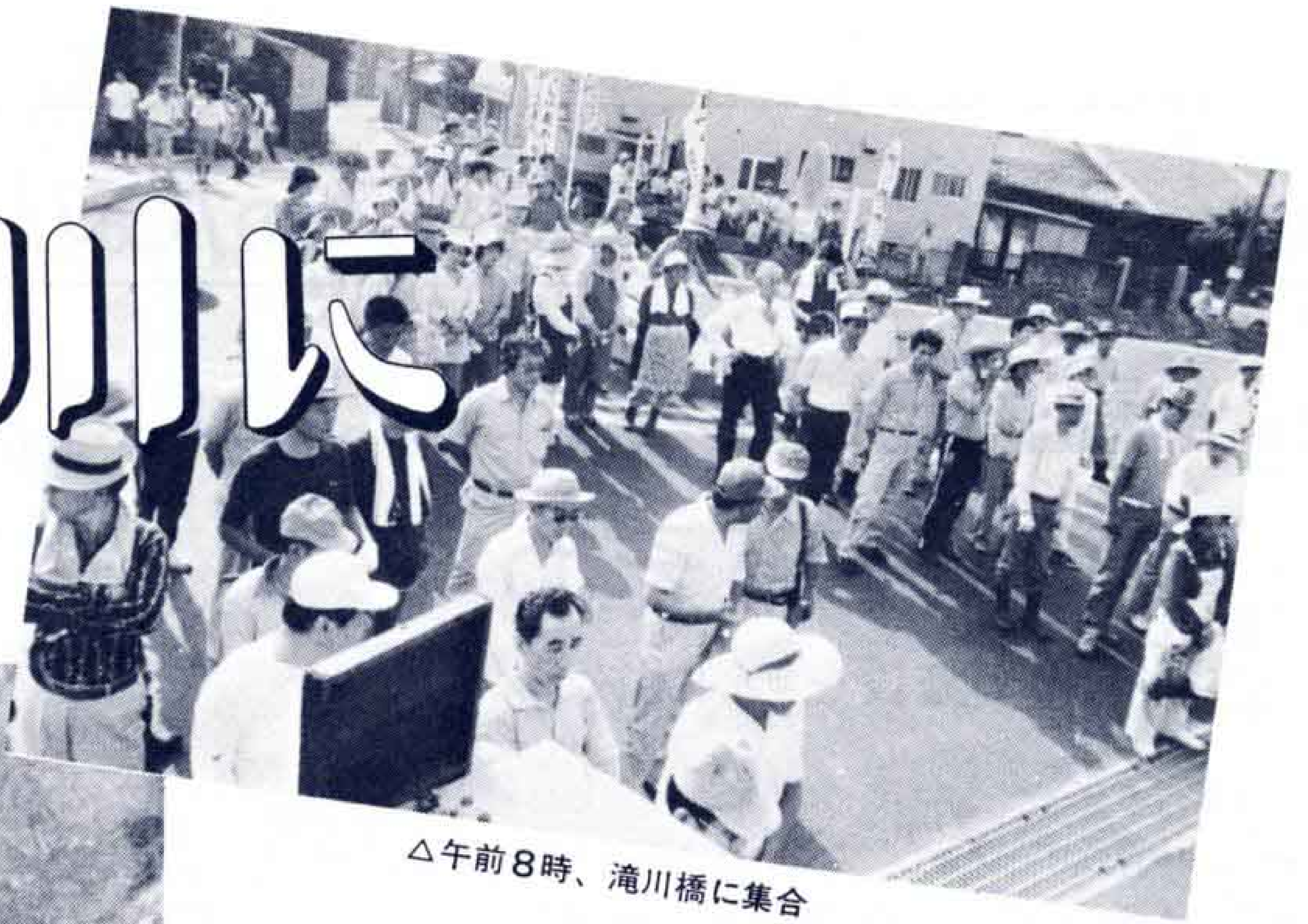
△午前8時、滝川橋に集合