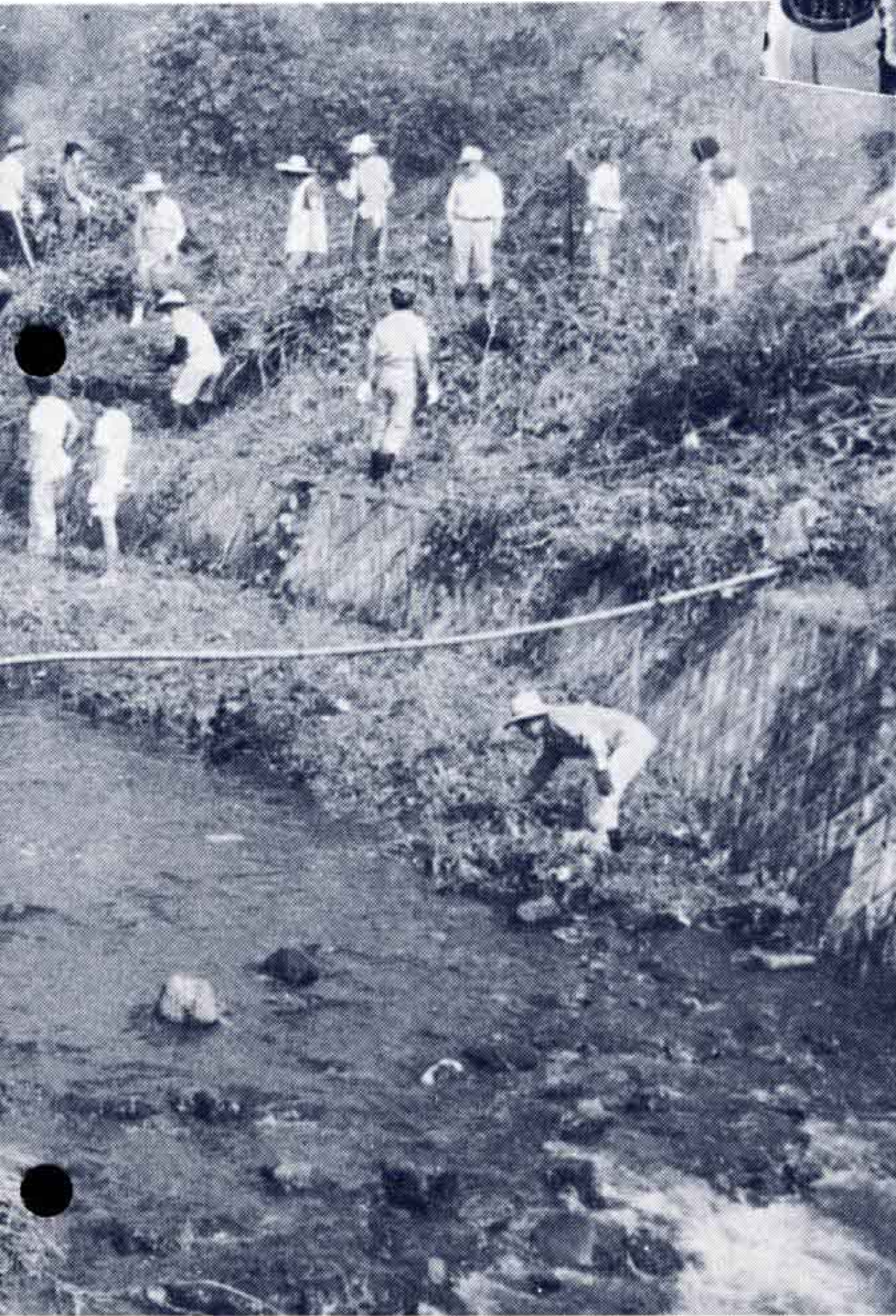
▷作業開始前のカマを持つ手にも力が