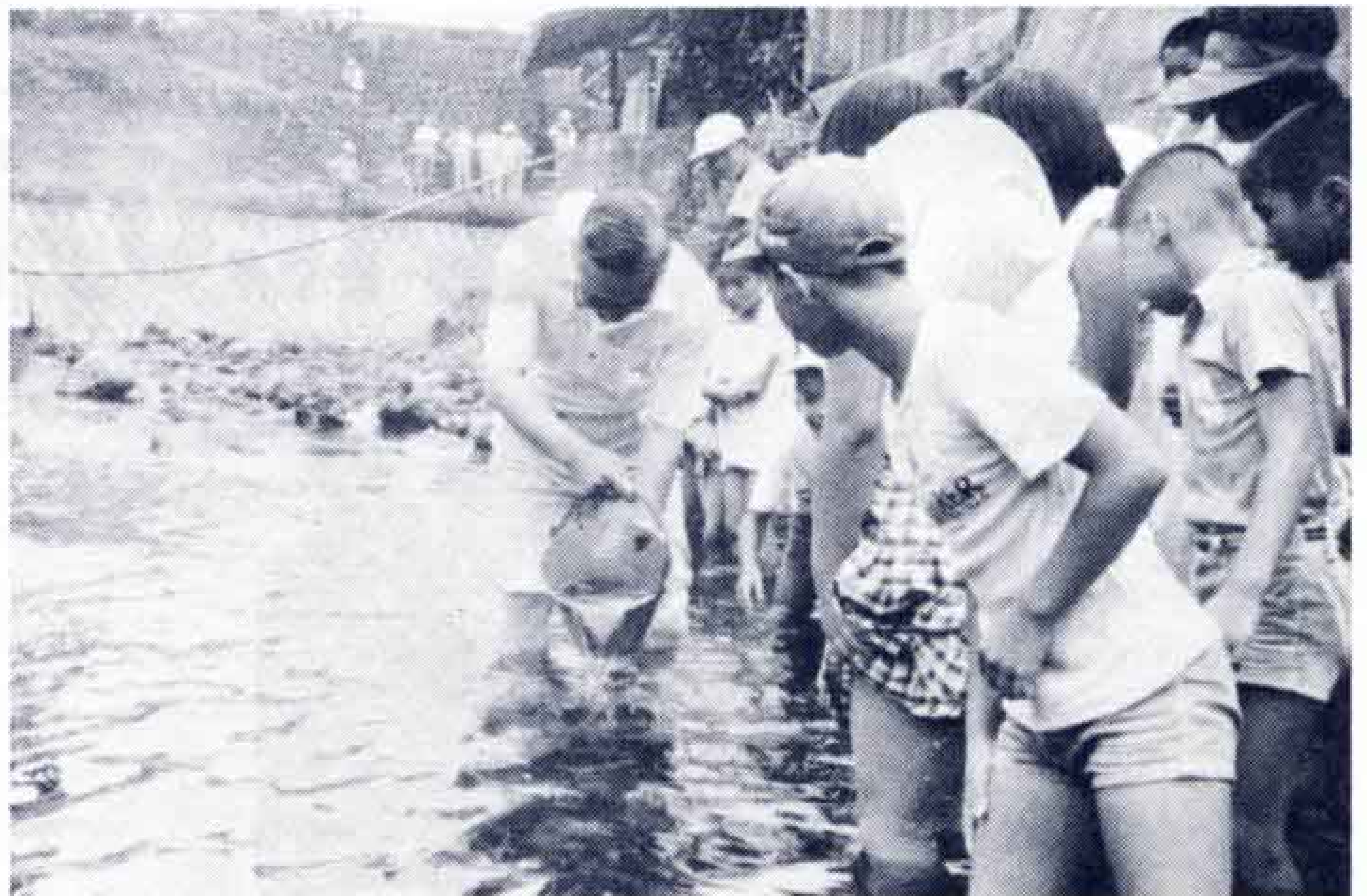
△清掃後はニジマスを放流