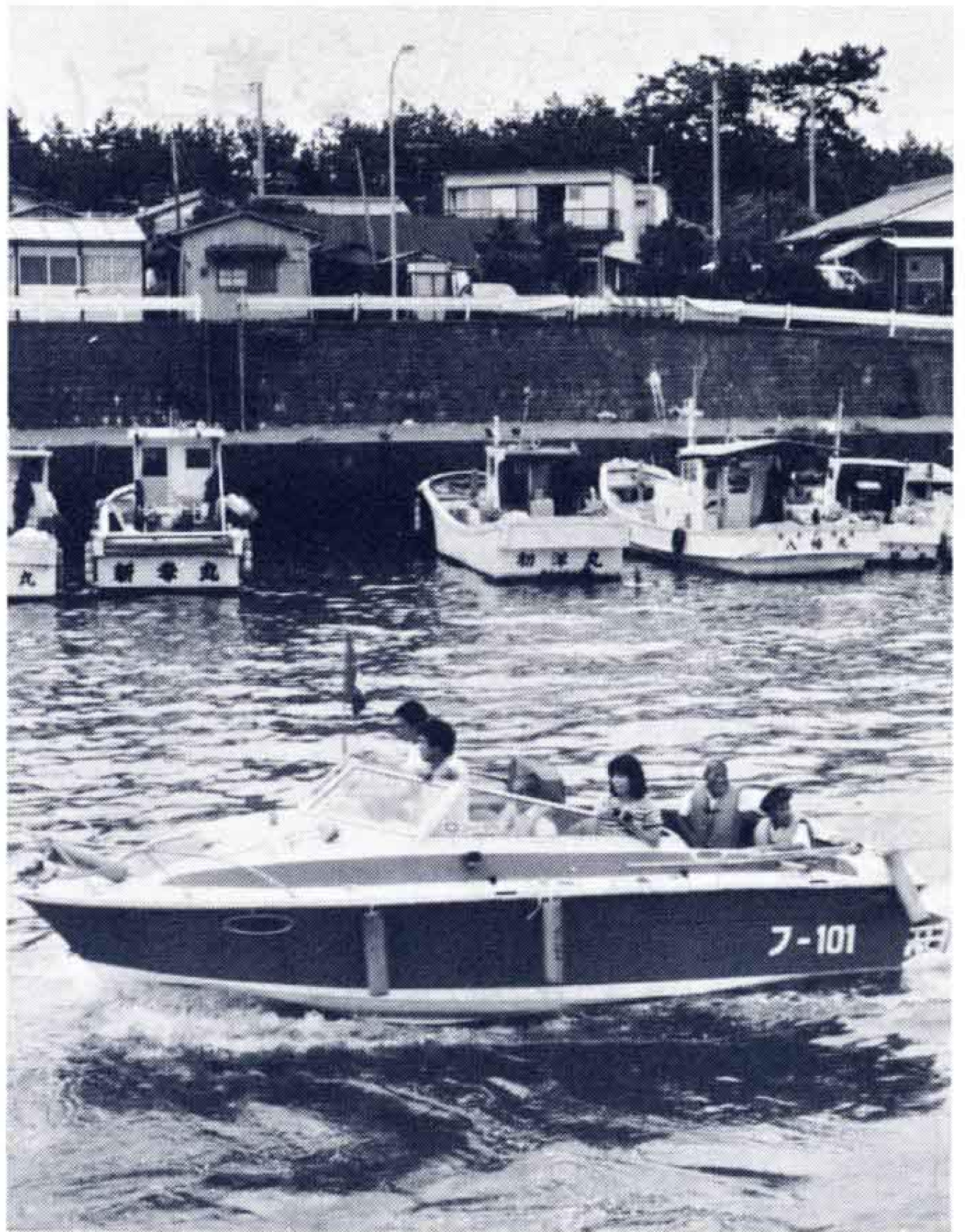
エンジン快調、サーー海原へ