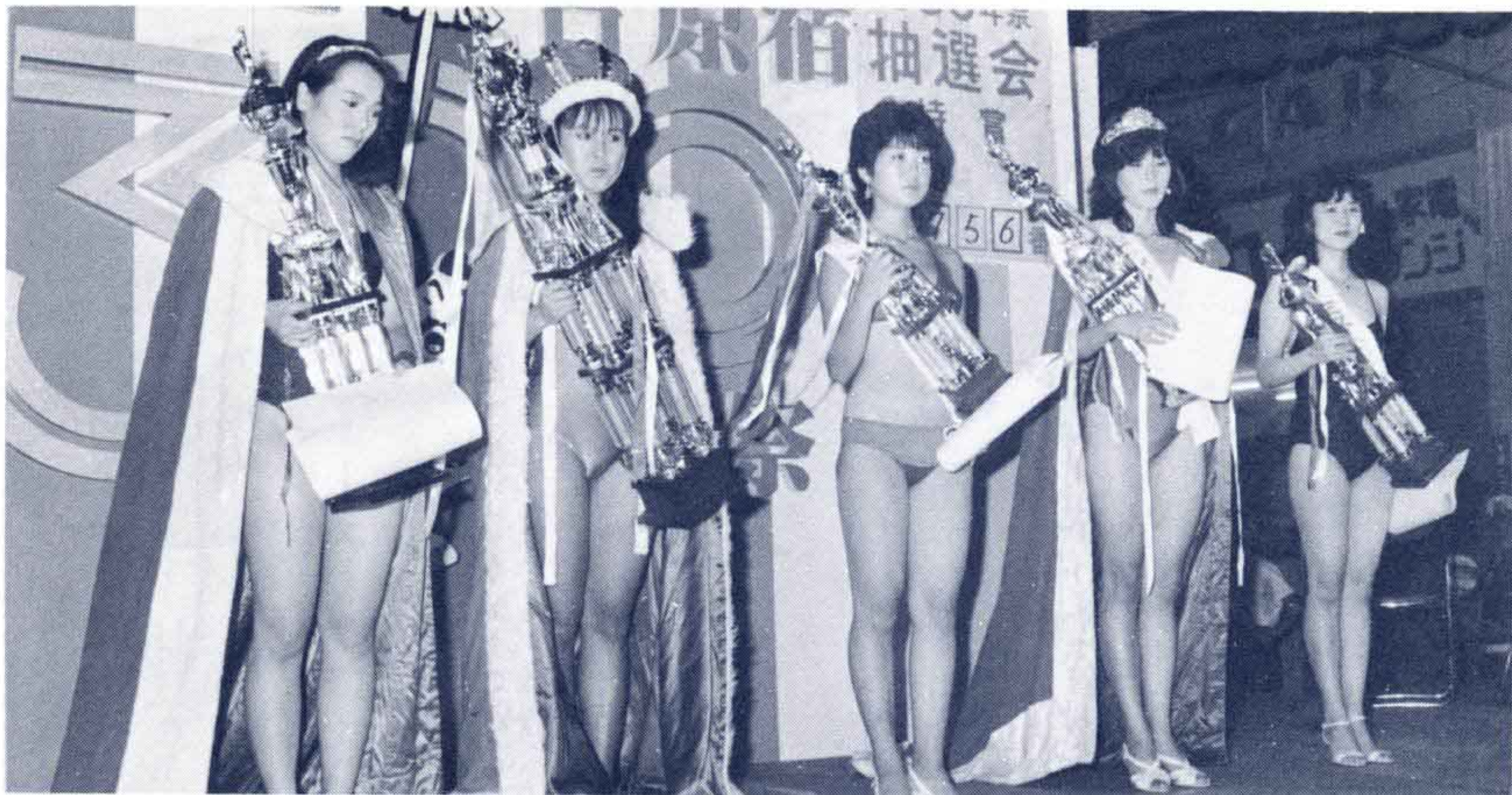
△吉原商店街振興組合主催のミス・ナイスギャルコンテスト