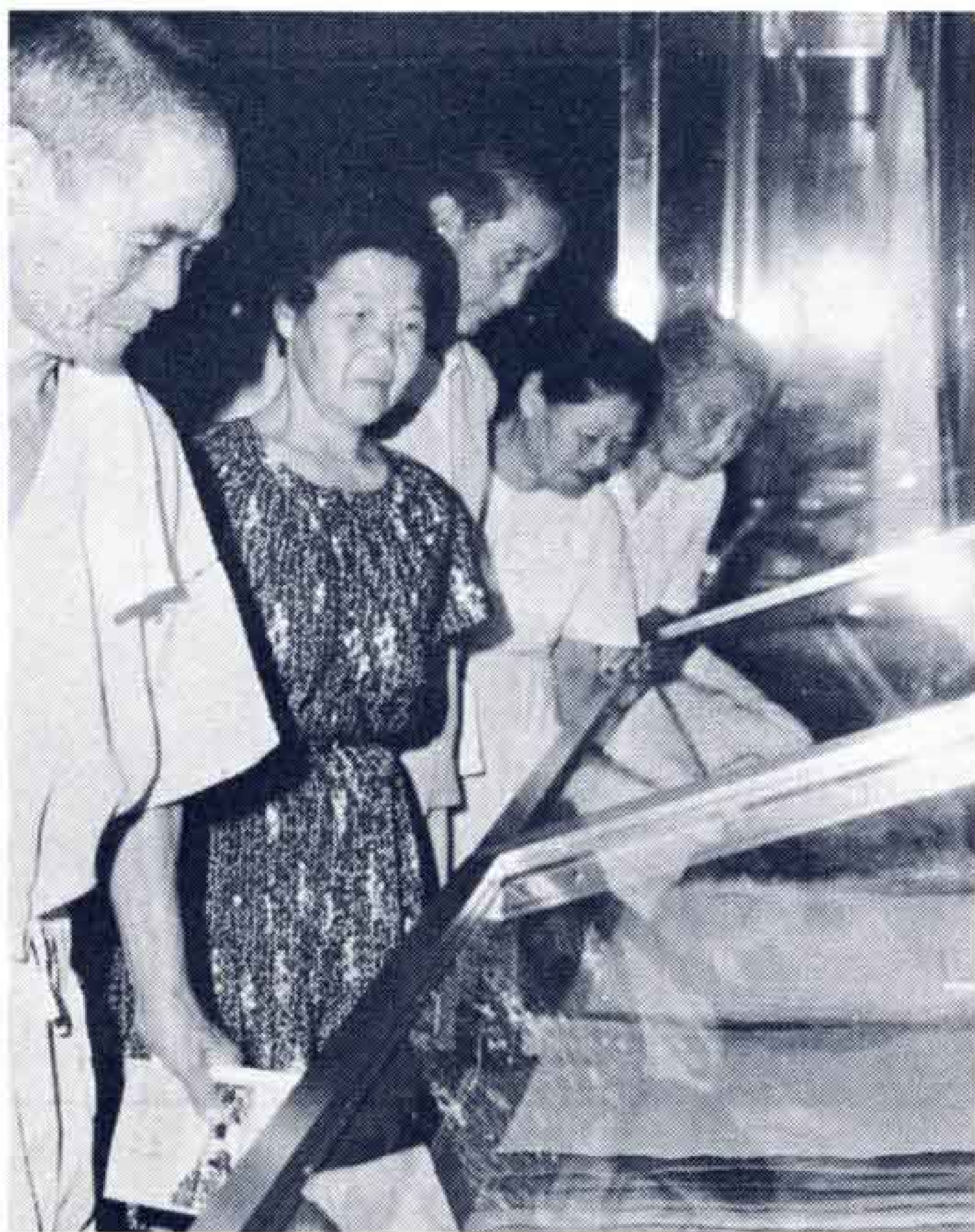
ウーン、これが紙か…

市立博物館は、紙の衣料をとおして先人の残した生活の知恵を振り返ってみようと茶羽織や紙子下着など60点余を展示。同企画展は8月31日まで開いています。