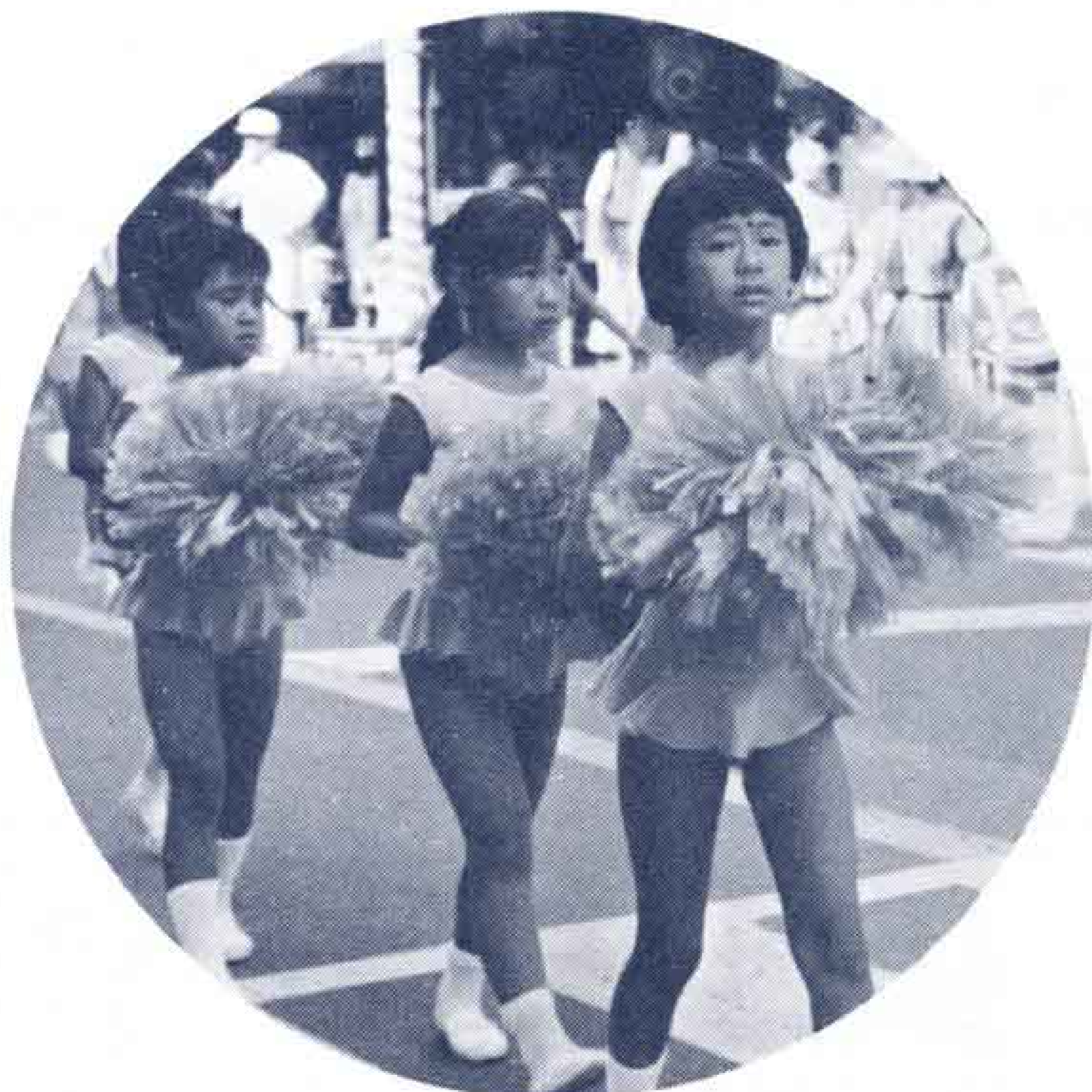
△私のスタイルどうかしら……

昨年は台風の影響で中止となった富士まつり。今年は好天に恵まれ、8月6日・7日の2日間各地区で子どもみこしやおどり大会、商店街協賛行事等が盛大に行われました。