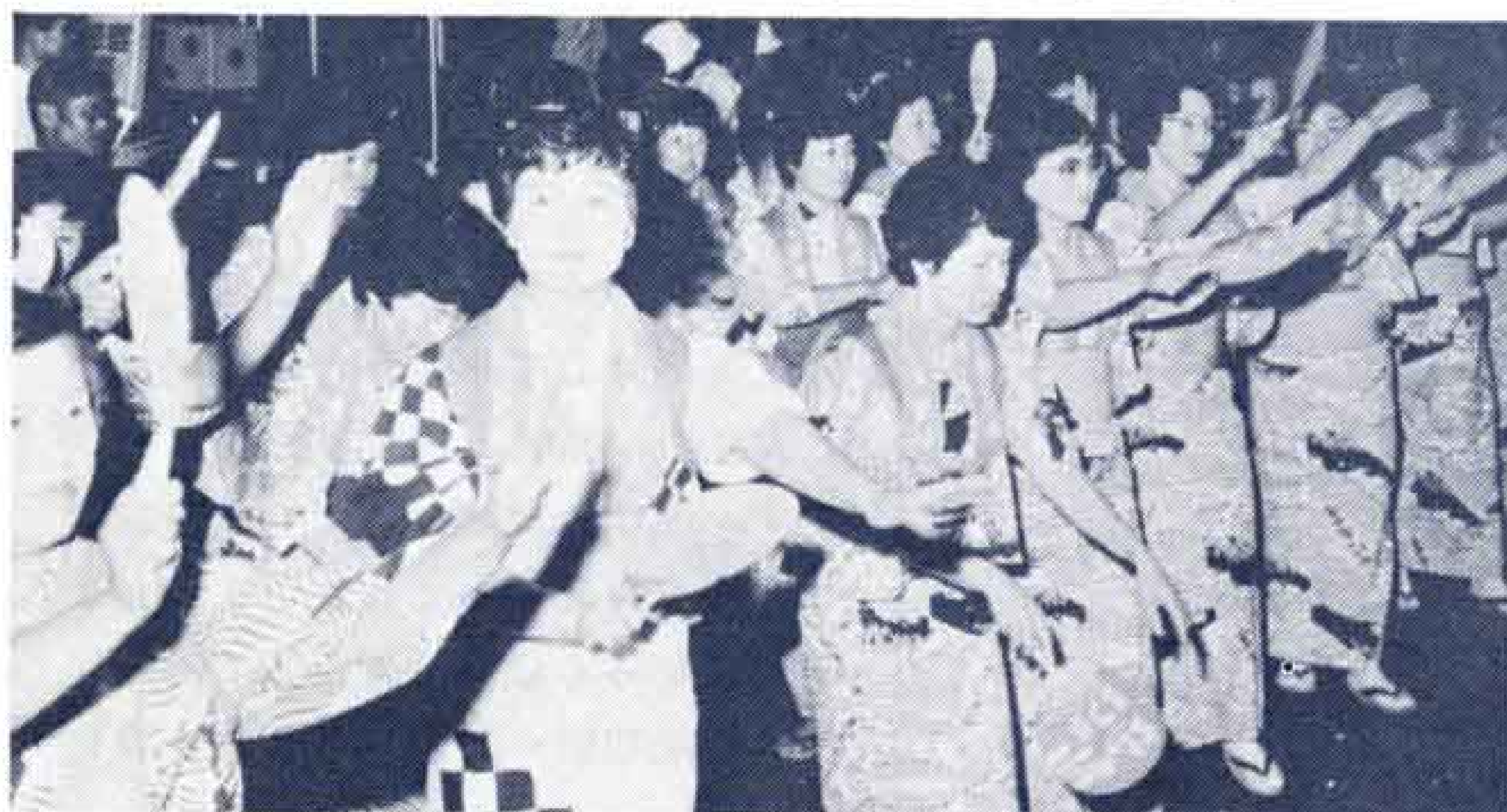
▽富士ばやしにあわせて、オチャチャのチャ