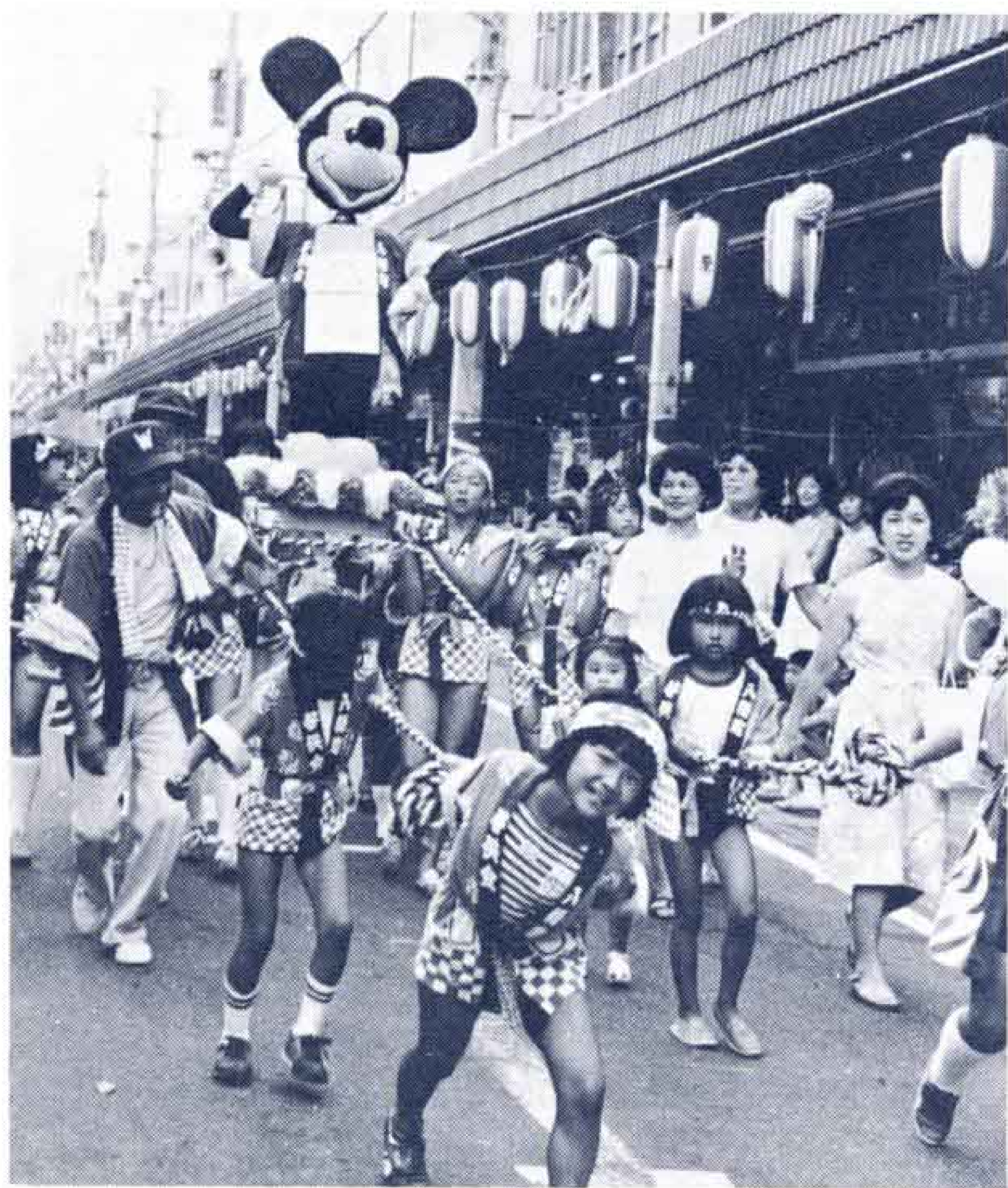
△ワッショイ、ワッショイおみこしワッショイ