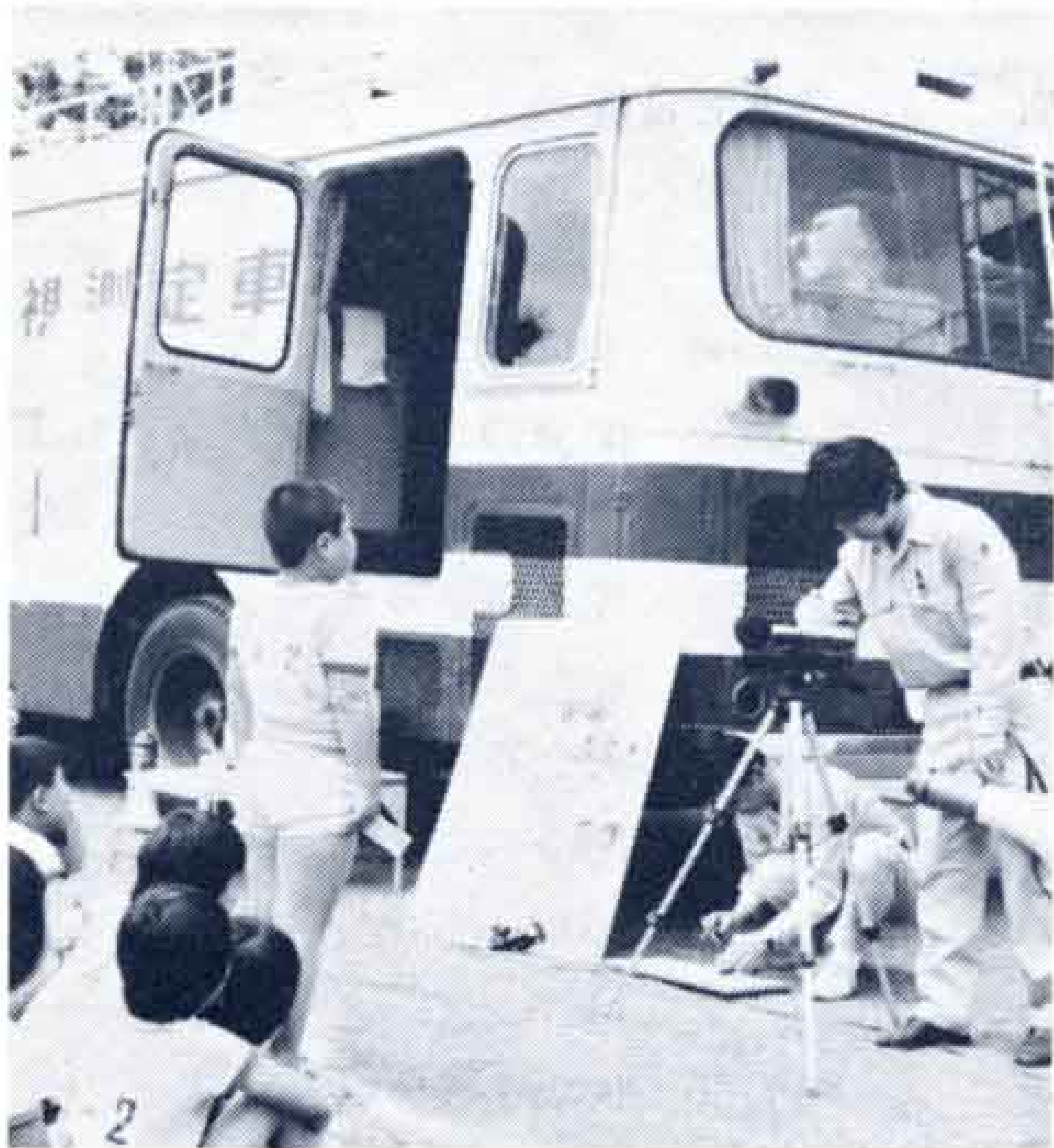
▲声の大きさをはかります