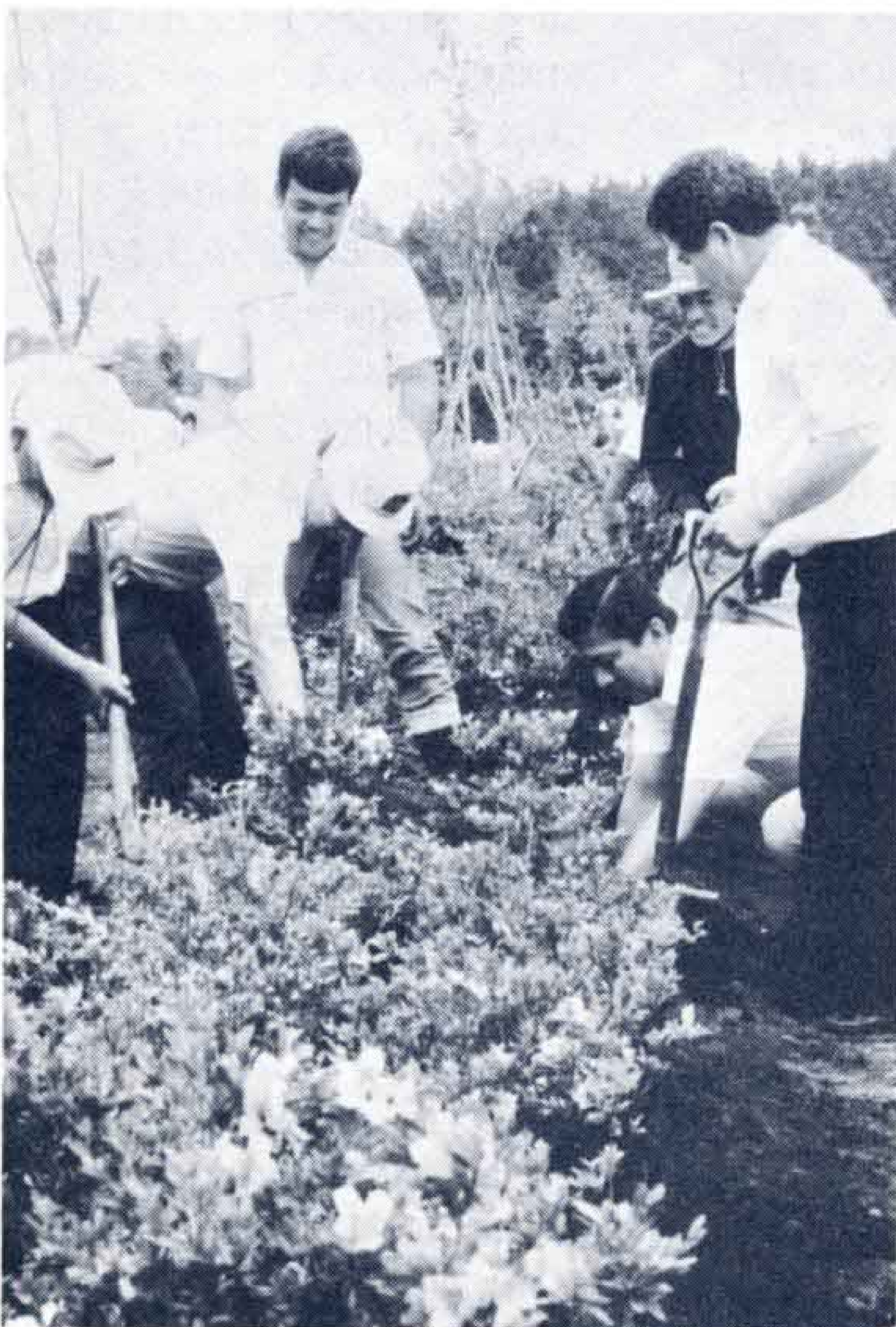
▲植樹する手にもつ力

期間中、市民植樹祭や清掃、自然保護パネル展など盛りだくさんの行事が行われ、なかでもオープニング行事となった風船あげでは、小学生の美しい環境づくりへの願いをのせた風船が空高く飛んでいきました。