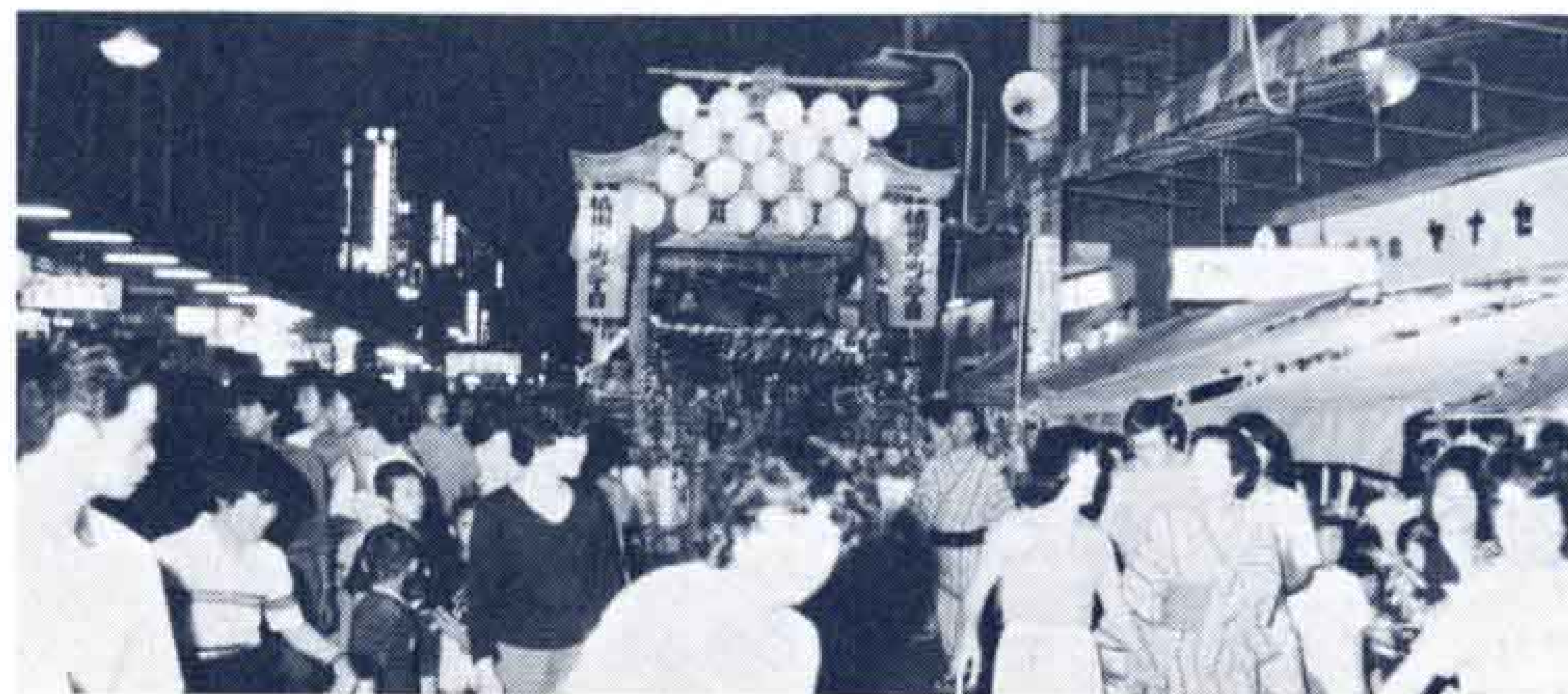
◀屋台様のお通りだよ