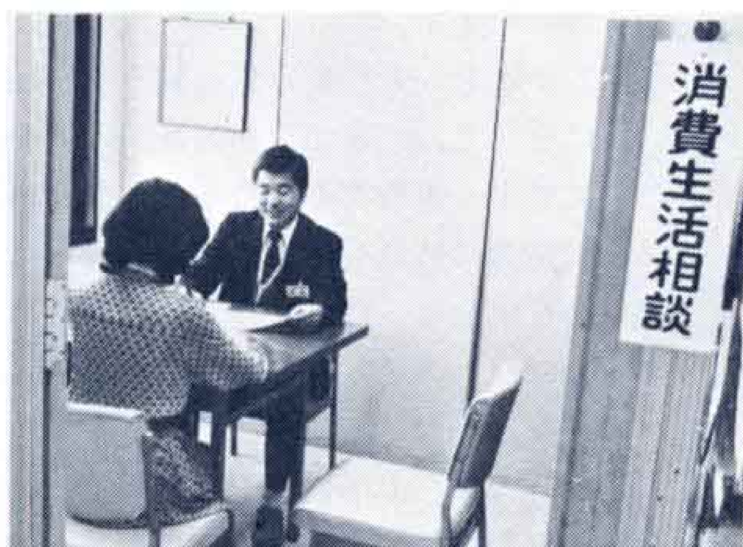
訪問販売による苦情が...