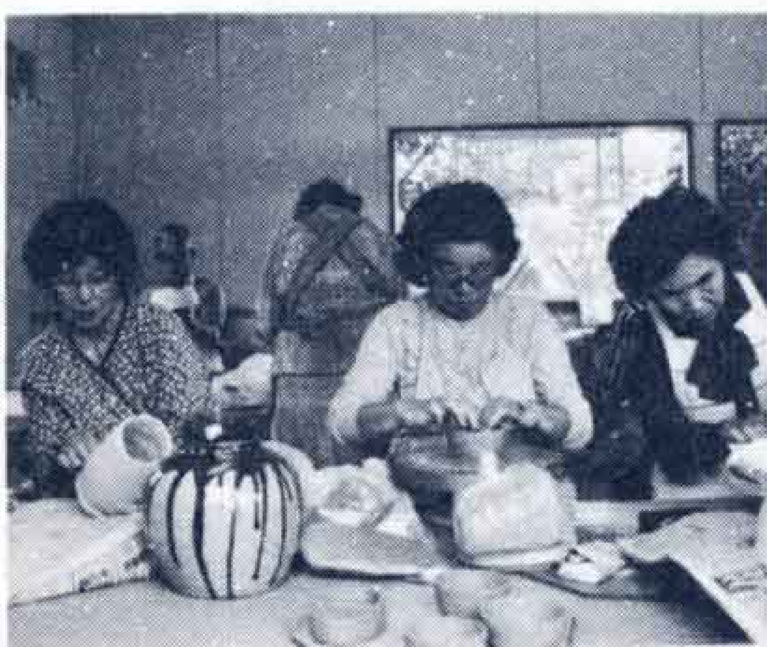
制作に熱中する会員

陶芸を通して教養を高めるとともに、 生きがいのある人生を送ろうと結成した のが発足の動機。会の名称もいつも若々 しく生きようではないかと「常盤」とし た。メンバーは、教員、会社員、商店経 営、主婦業など全て現役を引退したOB 男七人、女十九人の二十六人。 目標は、年に一度市役所二階の市民ギ ャラリーカバリーの催事場で作品展を開 くこと。それに市展にも出品したいね。 出来た作品は、孫や知人によつて喜ば れている。粘土をこねていると楽しいよ。