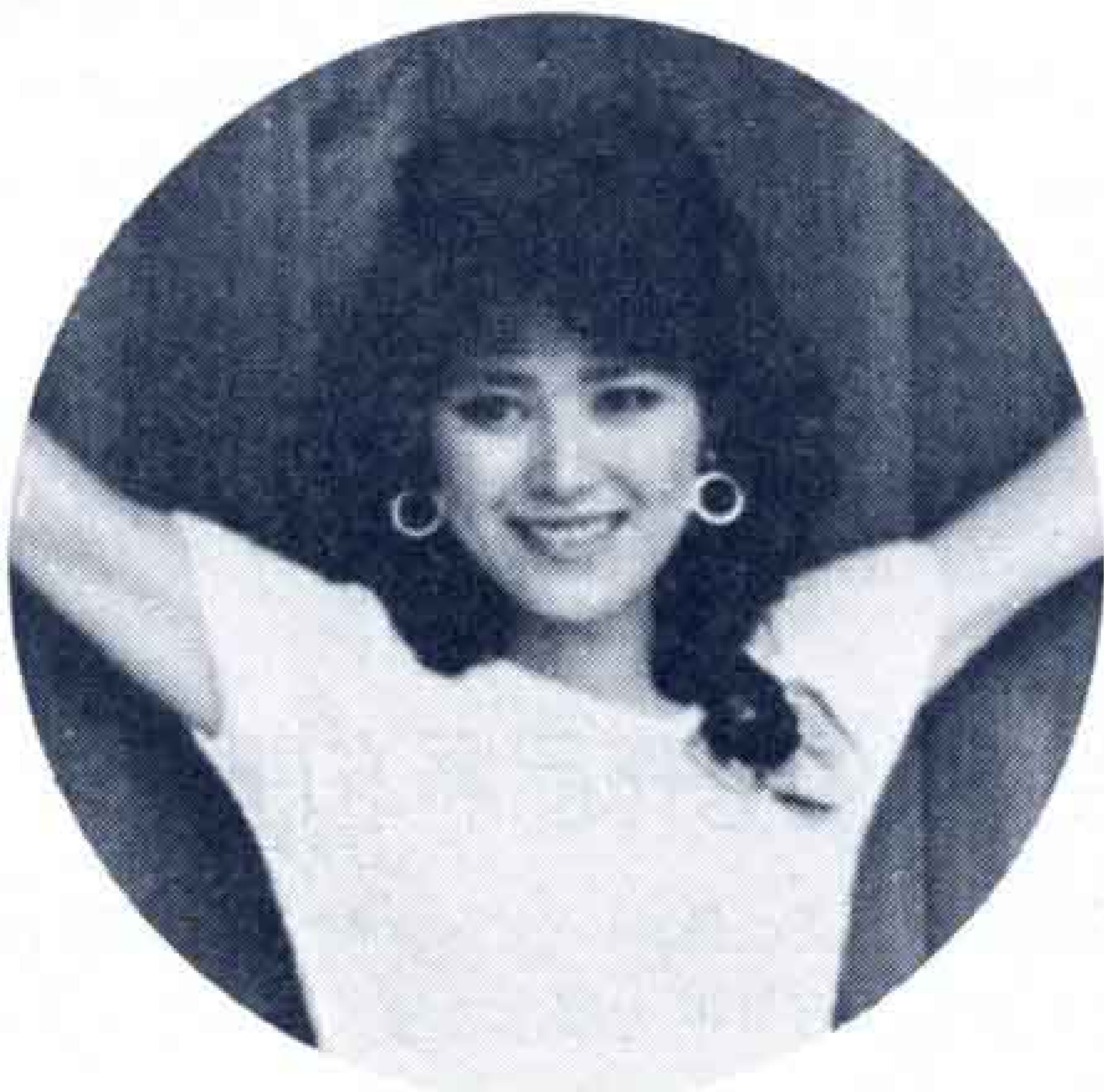
△市民文化に美女も一役