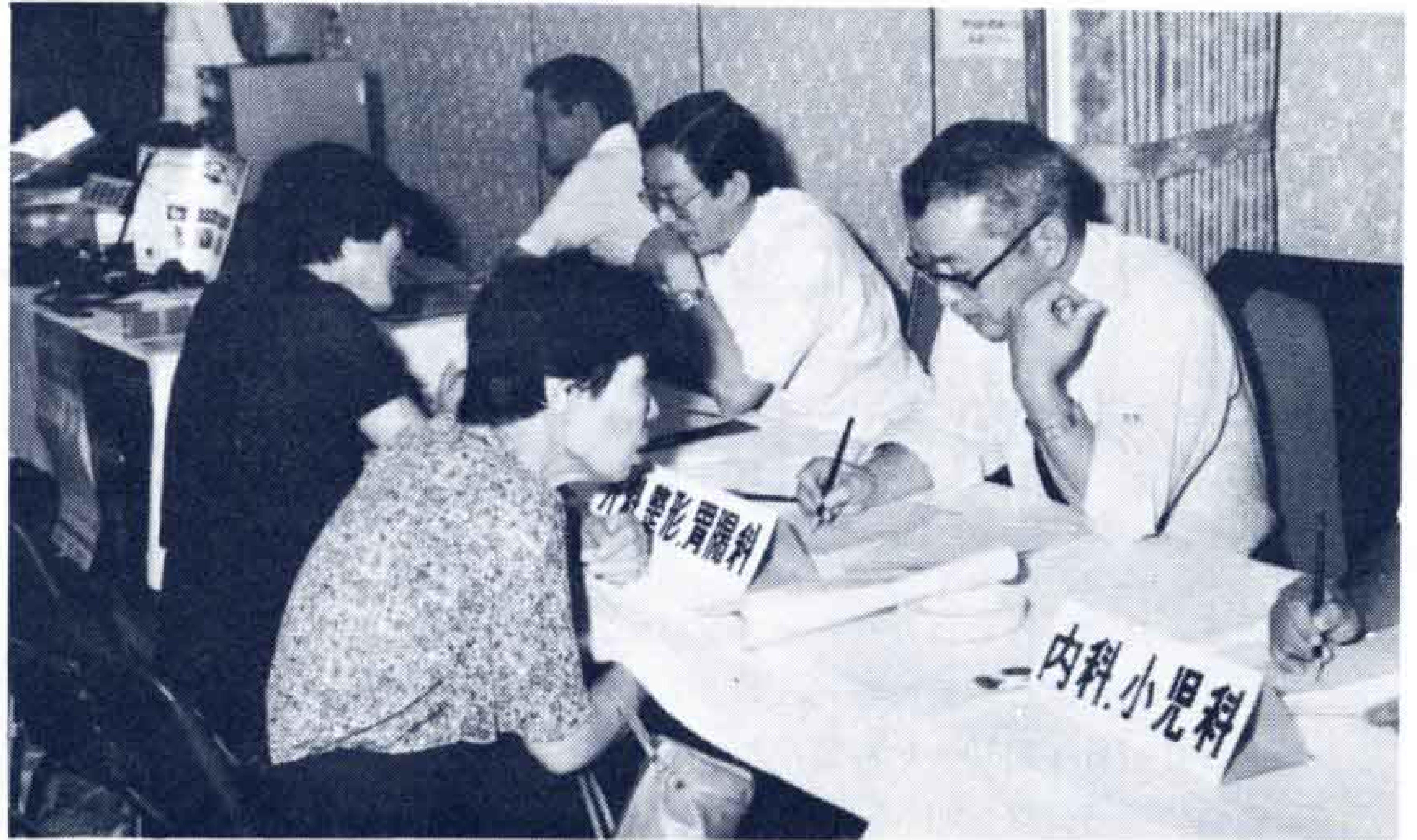
昨年8月行われた健康展

40歳以上で、寝たきりの人に対し保健婦などが訪問して、療養の方法や看護方法などの相談を行います。