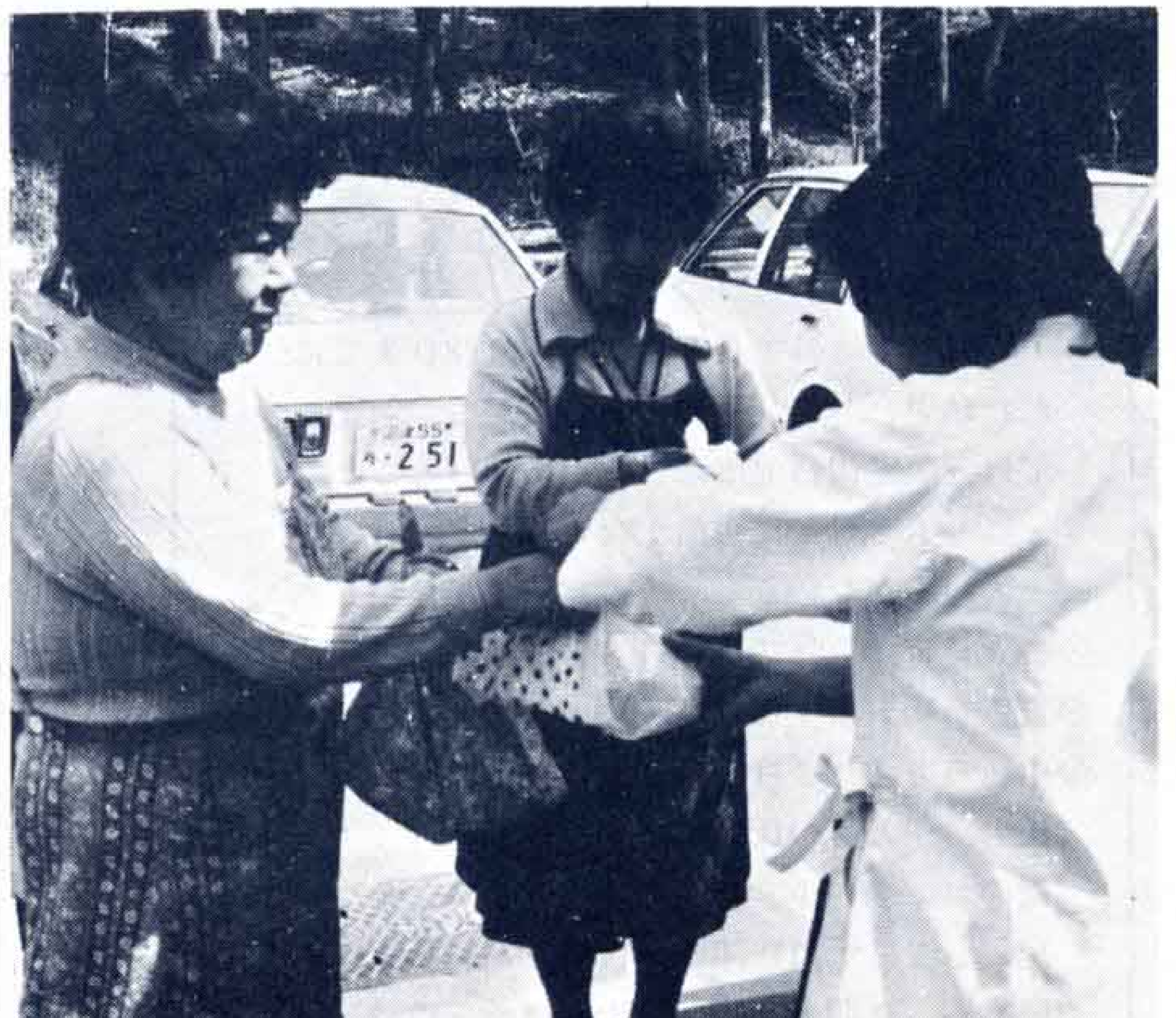
△お弁当は6ヵ所の中継ステーションへ