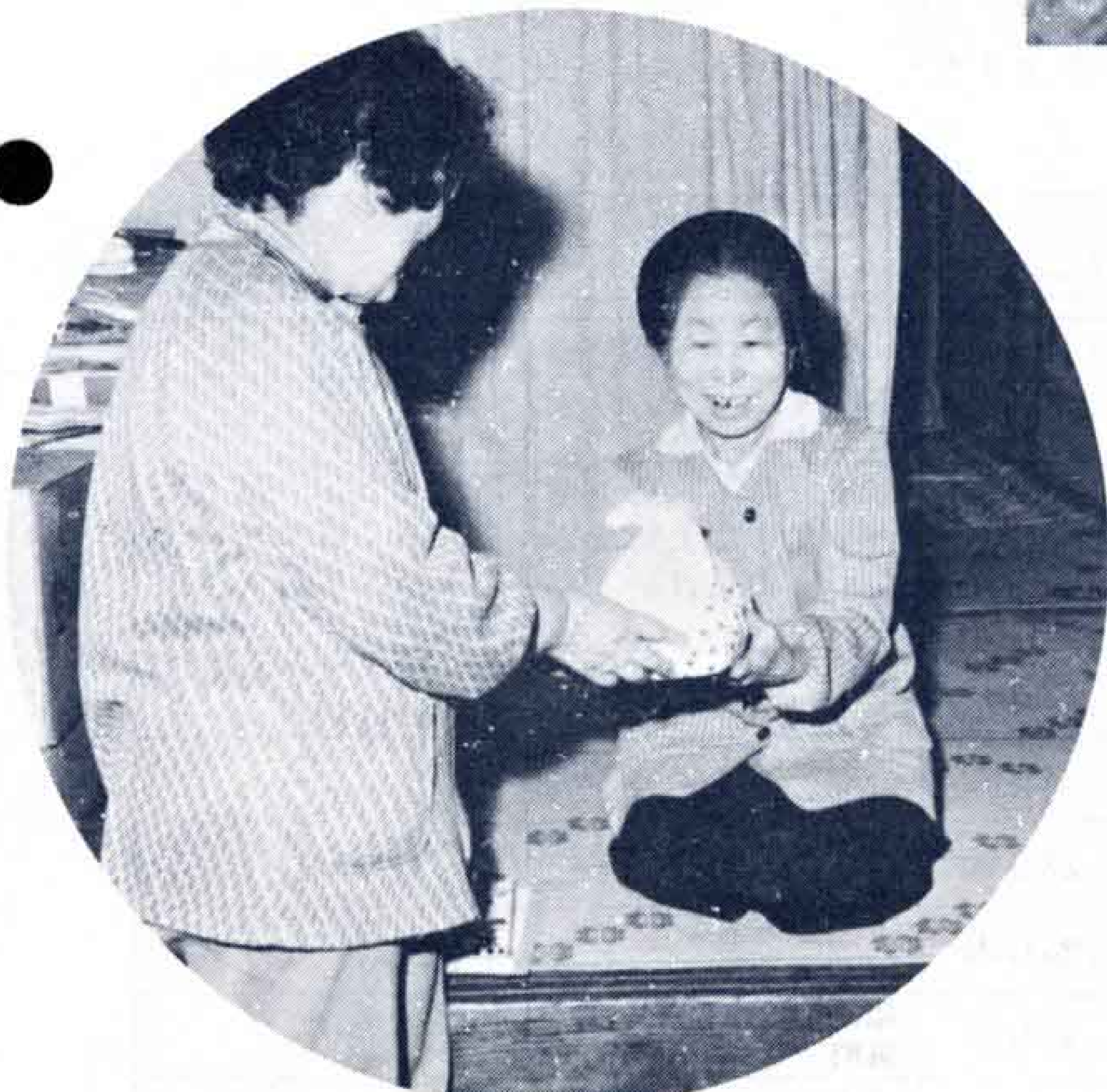
真心こめたお弁当を