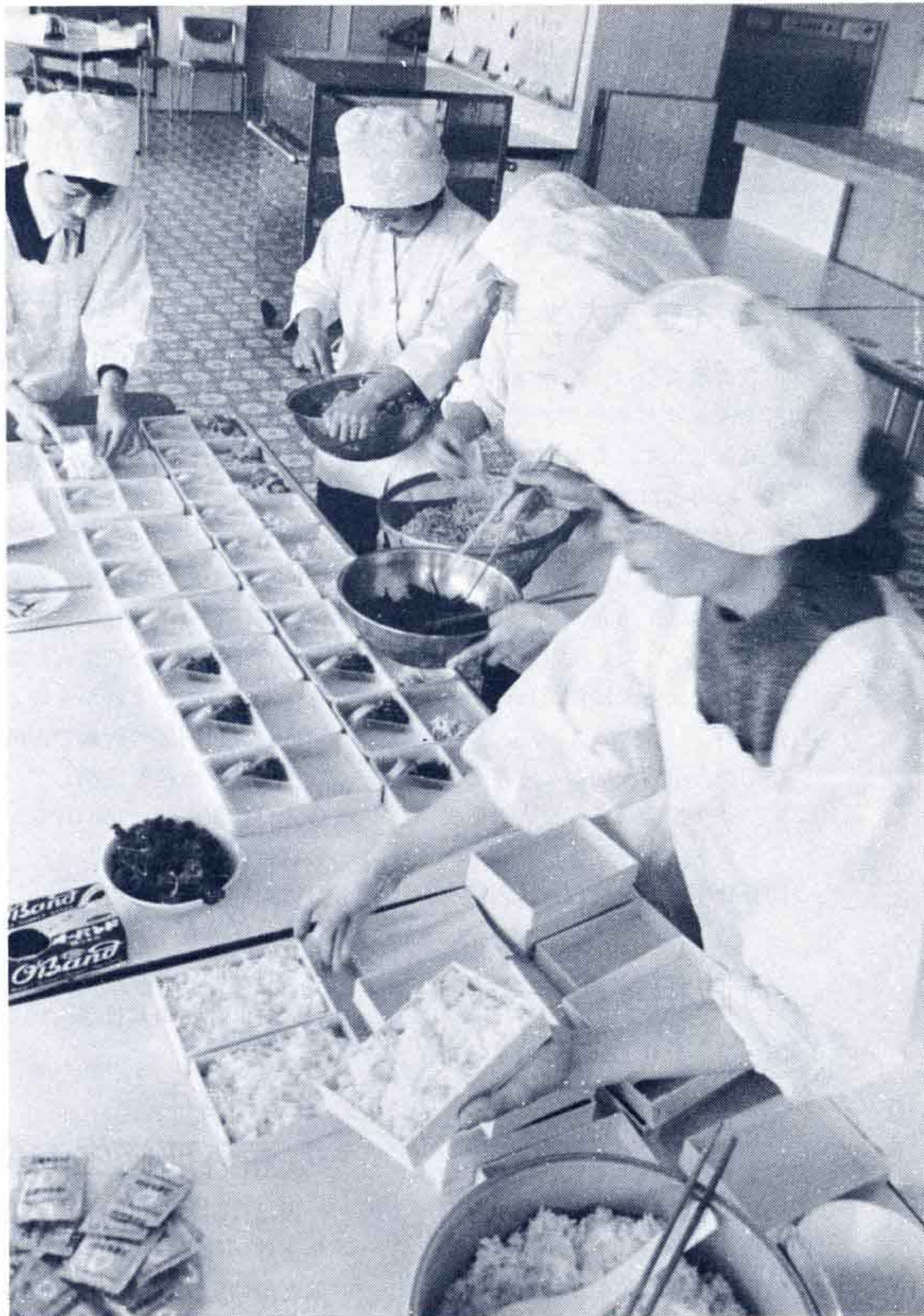
△ボランティアによるお弁当の盛りつけ

食事サービス事業、入浴サービス事業への申込みは、市福祉課へ☎51-0123 内線234