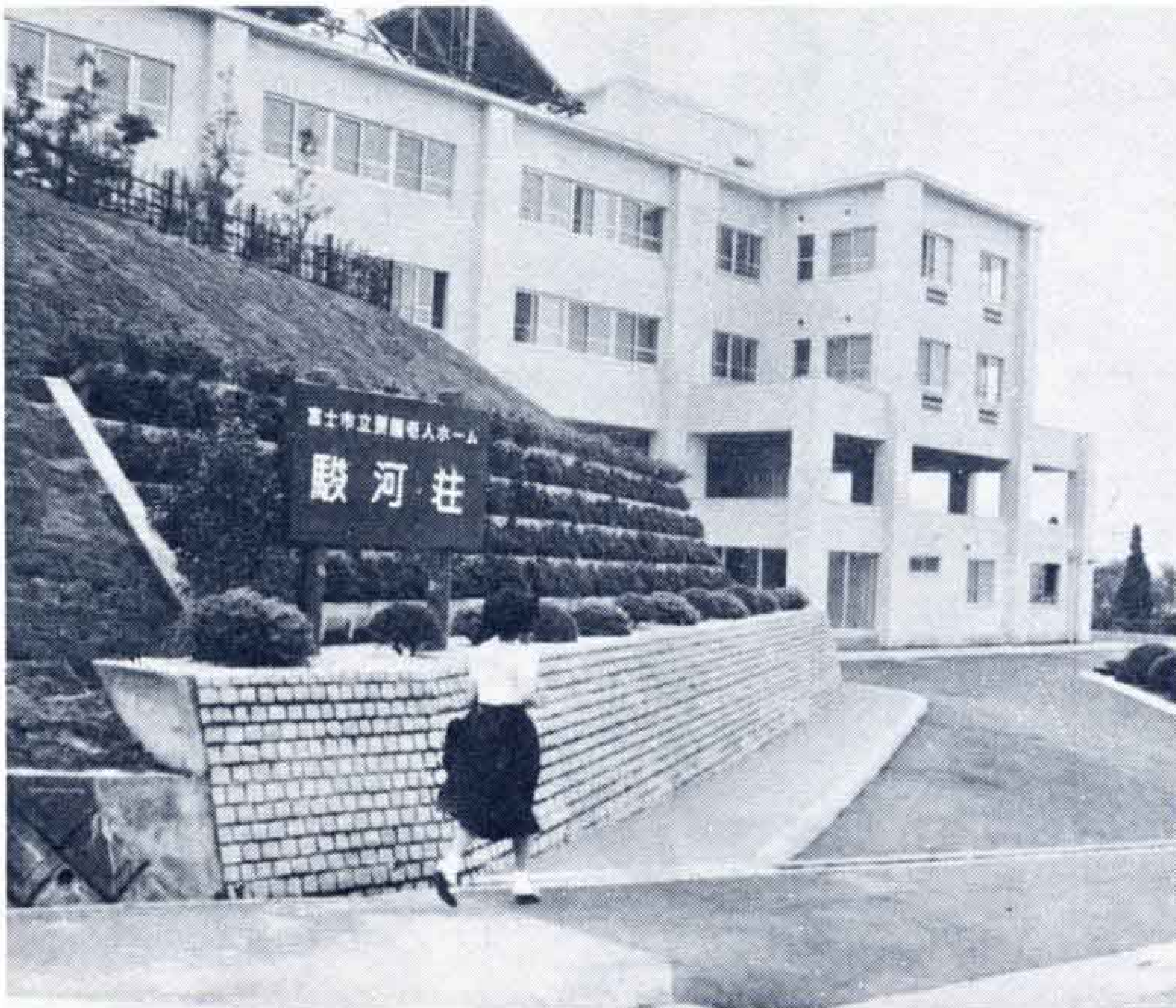
△地域に密着した施設として

地域に開かれた施設を——と昨年5月、富士見台5丁目にオープンした養護老人ホーム駿河荘は、食事サービス事業と入浴サービス事業をスタートさせました。この事業は、駿河荘とボランティアが協力し、駿河荘のもつ機能を地域にも生かしていこうというもので、老人福祉の向上をねらいとしたもののひとつです。