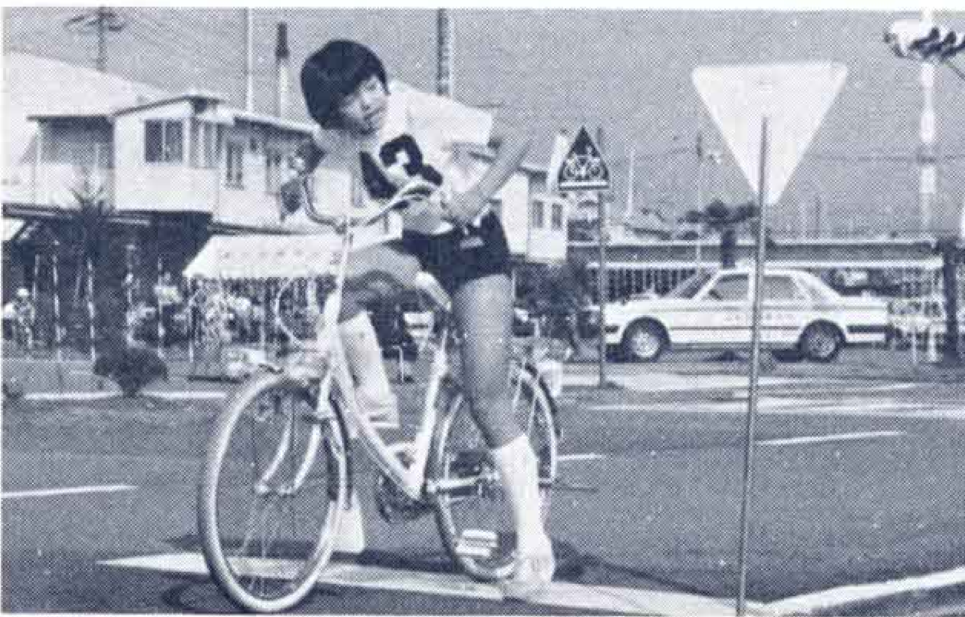
▽右ヨシ、左ヨシ、後方ヨシ、前方ヨシ発進