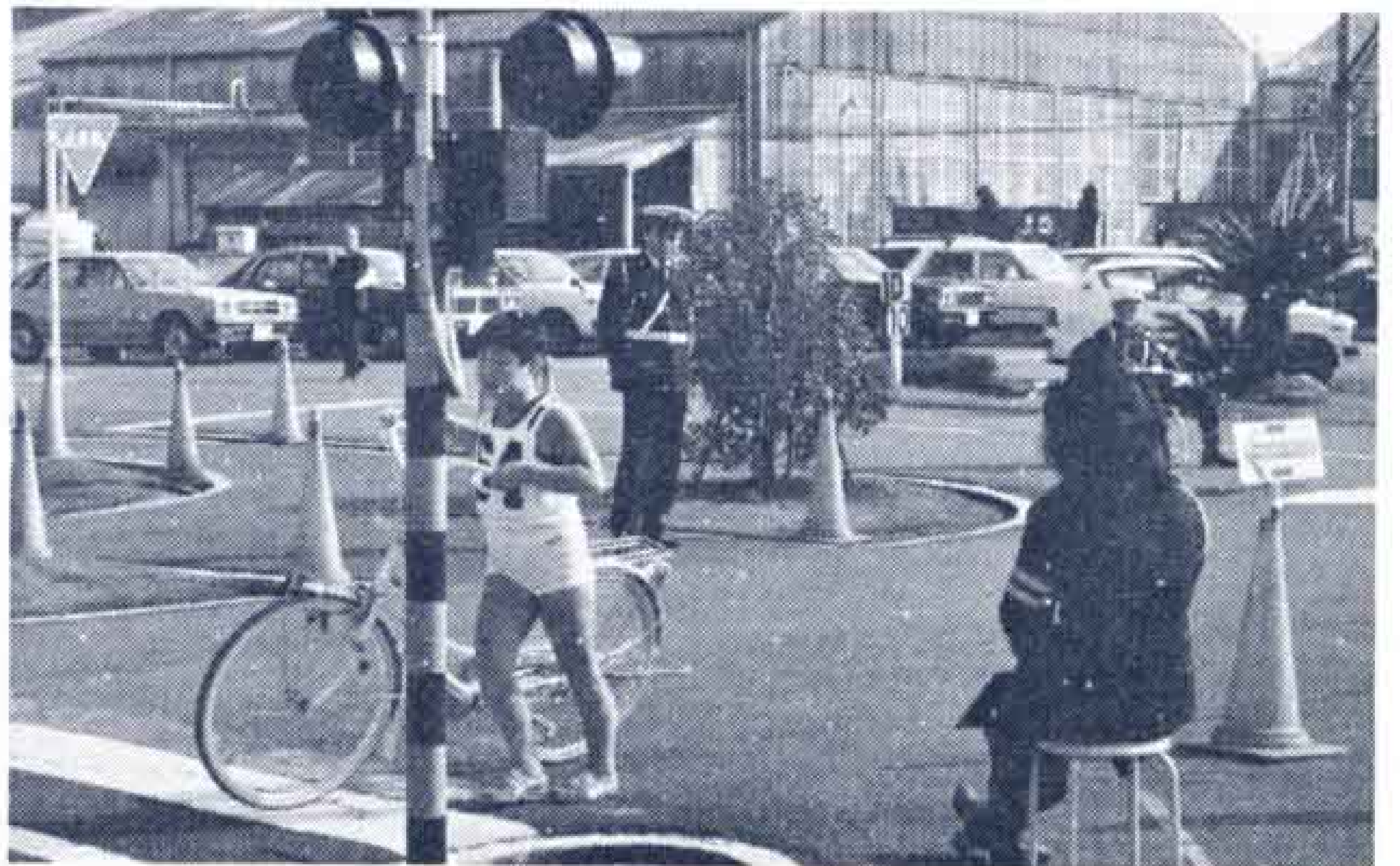
△踏切の横断は自転車を引いて