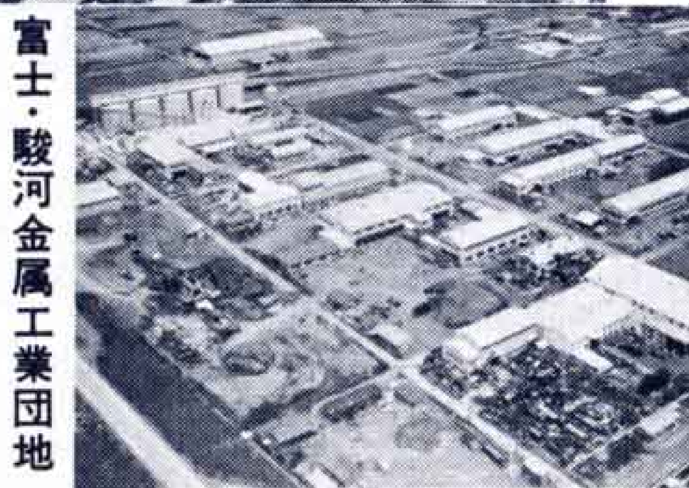
富士・駿河金属工業団地

一方国道一号線富士、由比バイパス南側の6万9000平方メートルの敷地に事業費3億2600万円をかけて造成された富士金属・駿河金属工業団地にも金型製造、機械など金属機械関係の工場が36社あります。