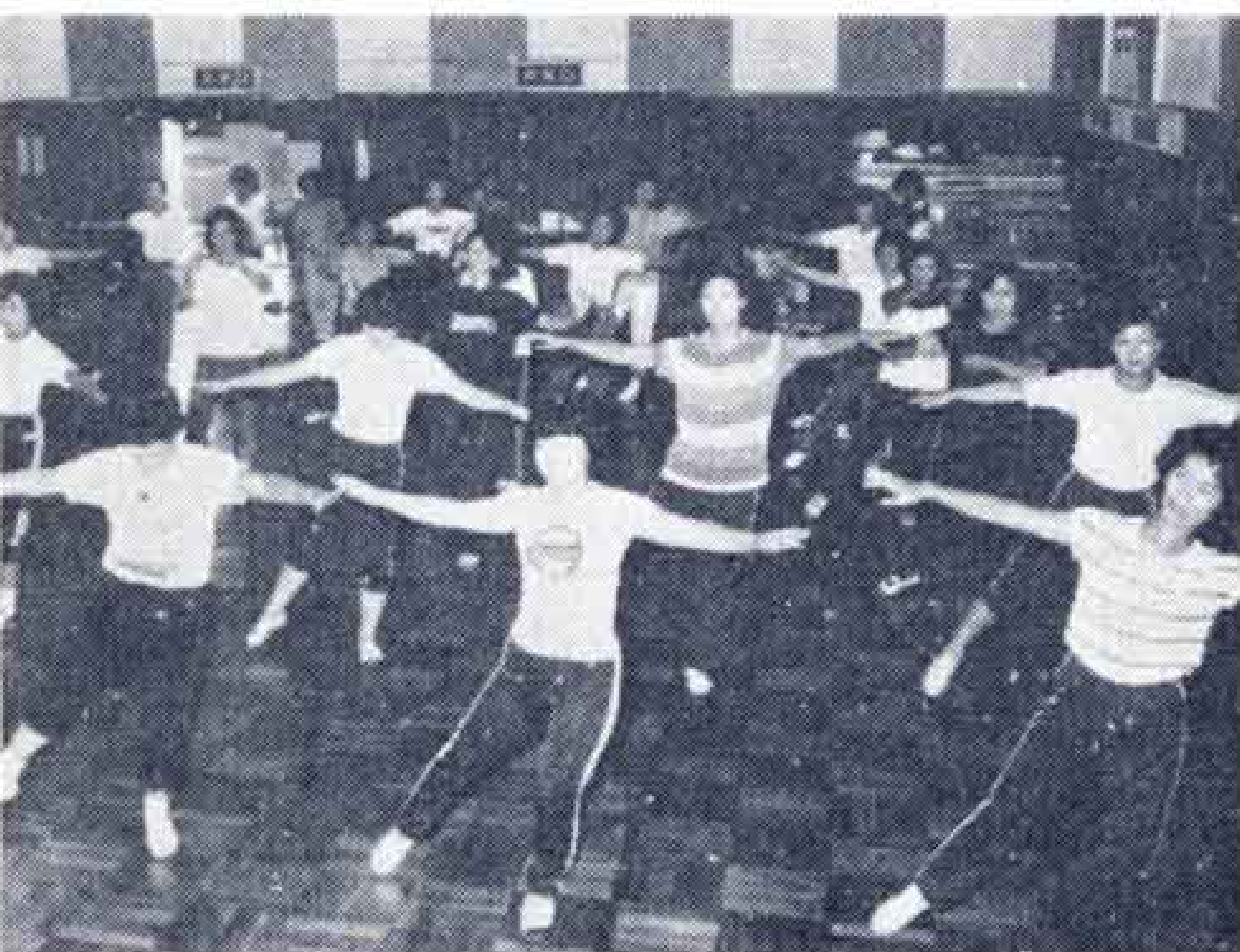
△トリム体操に汗を流すメンバー

軽体操の汗をふきながら、上気した顔で口々に話してくれる。忙しい十二月は練習は休み、一月から再開するという。