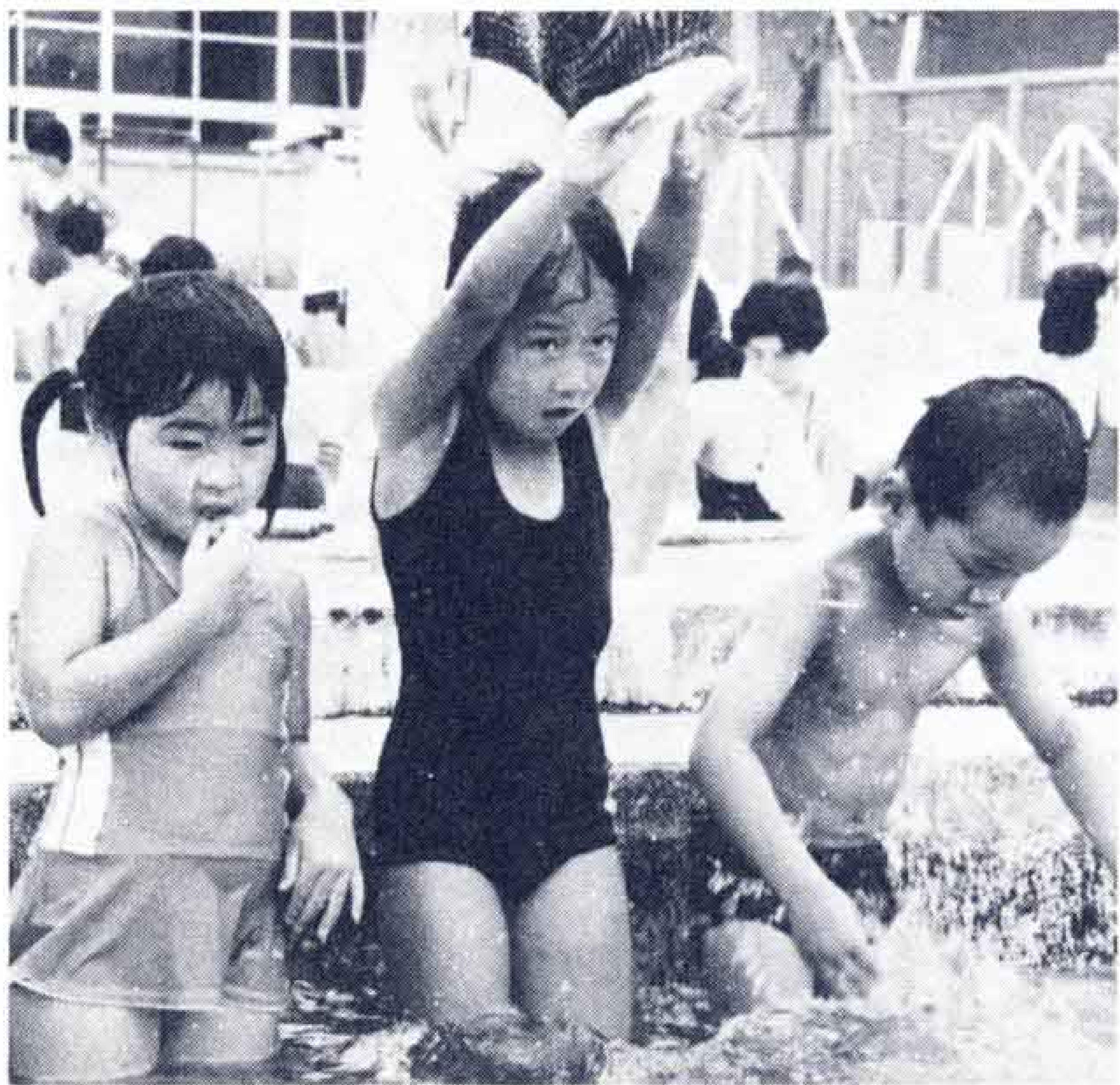
◁飛び込みはこのスタイルで