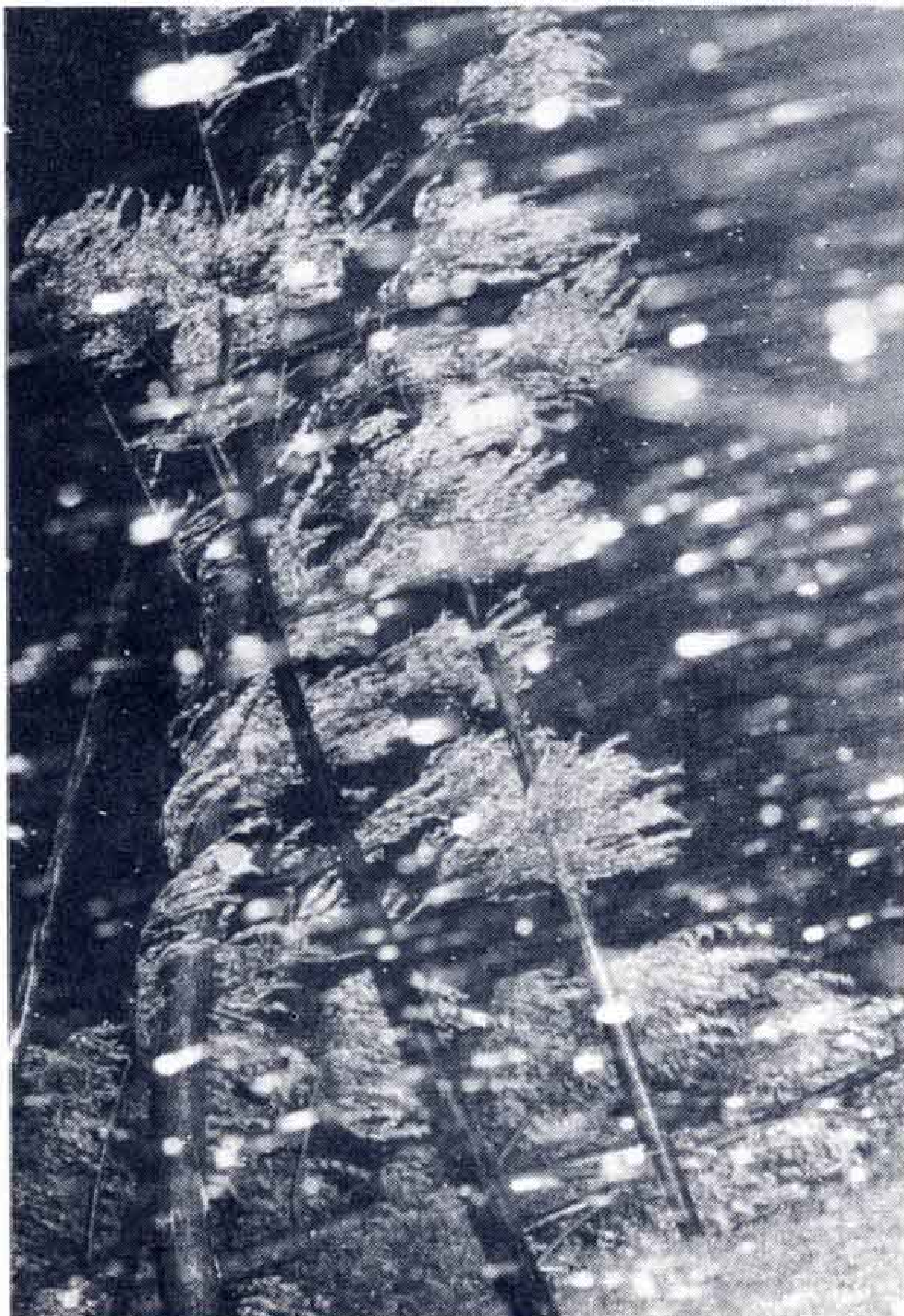
△瞬間最大風速41.0メートルを記録