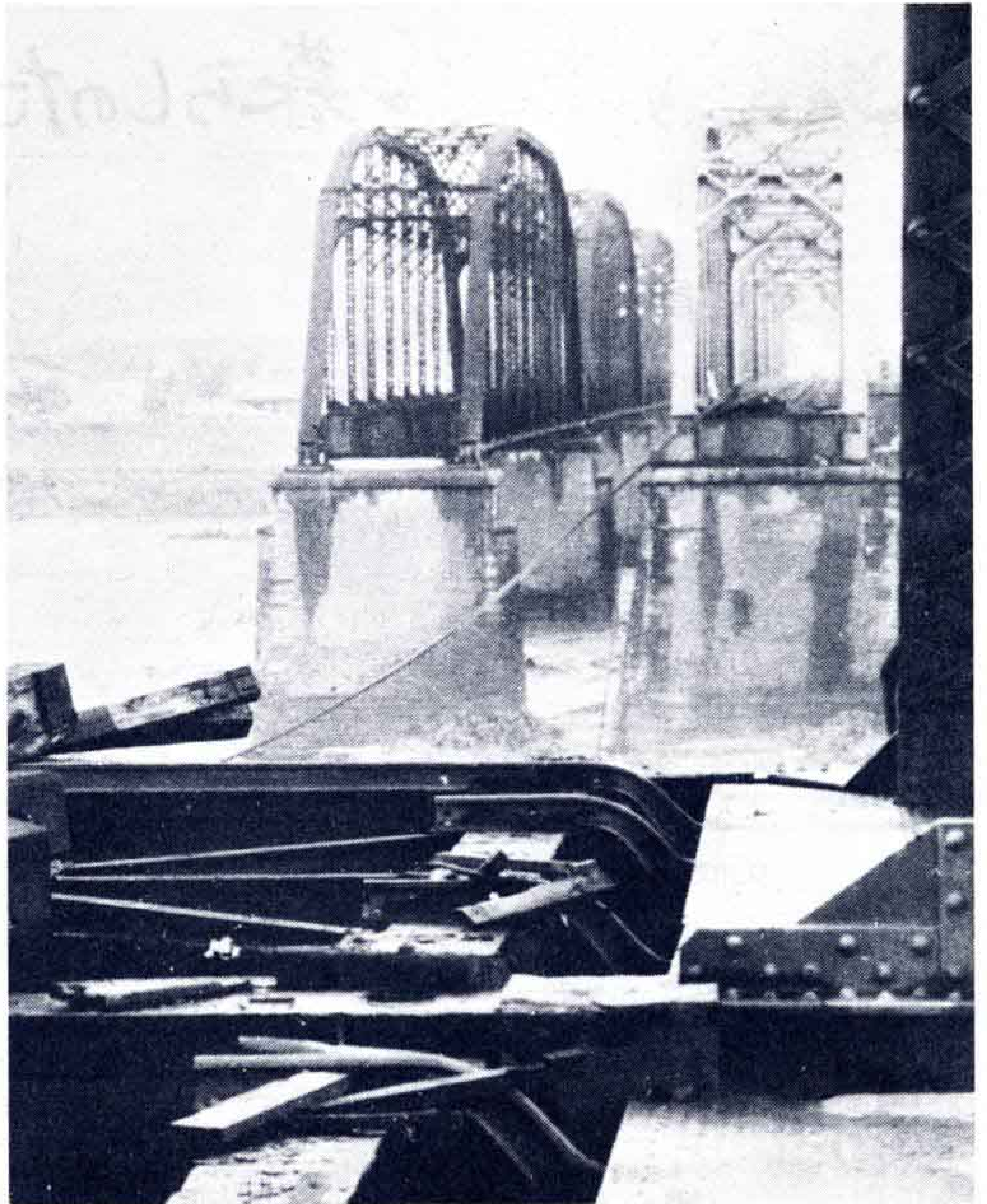
△国鉄富士川鉄橋下りの橋脚が流失

このため、家屋の一部損壊や堤防の一部欠損などの被害が出ました。一方、山梨県内の豪雨によって、富士川が警戒水位を越えたため、国道1号線が一時ストップした他、東海道線下り富士川の橋脚が流失してしまい、東海道線は不通となりました。