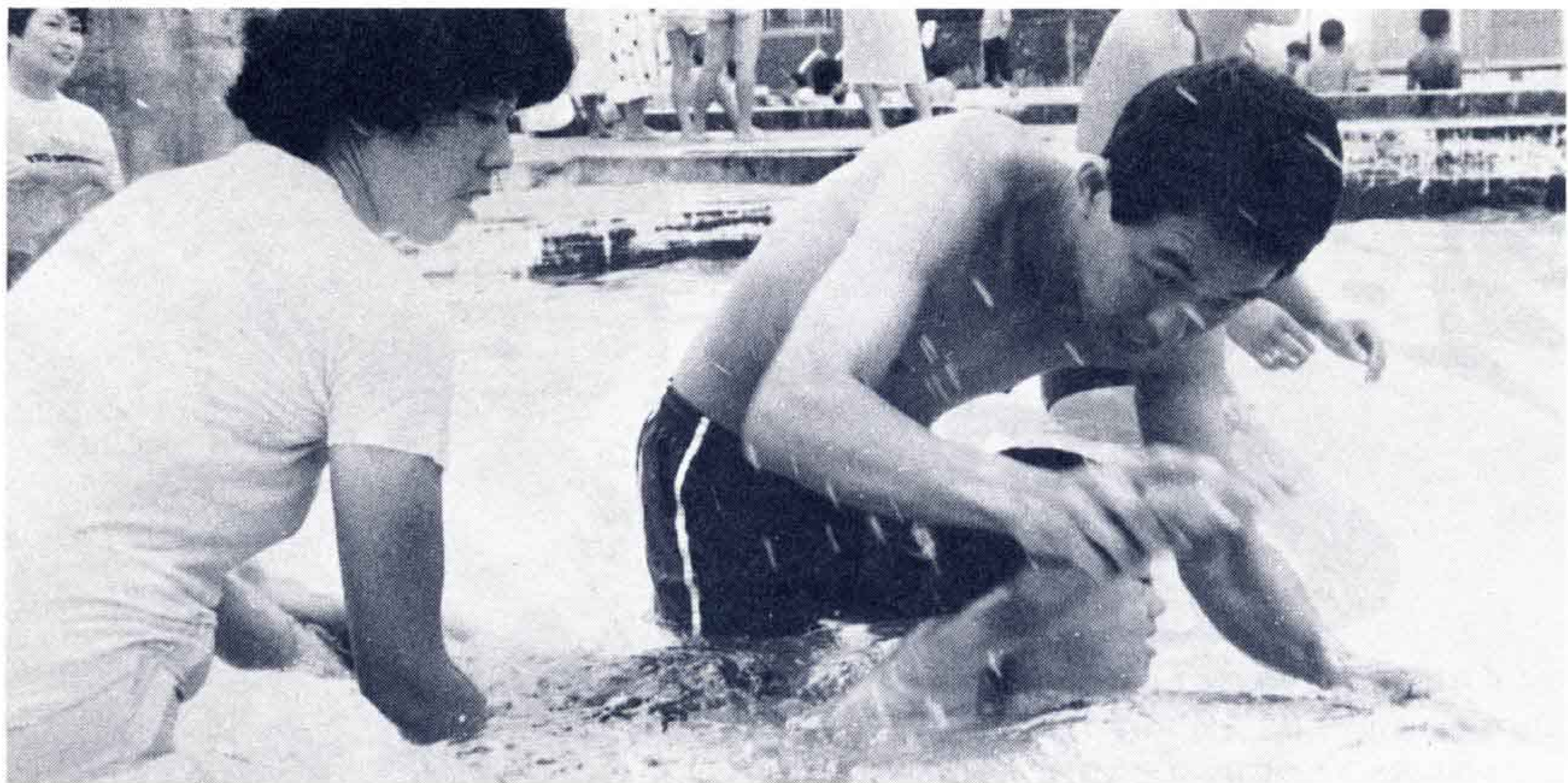
△指導員の手にも力が入る…