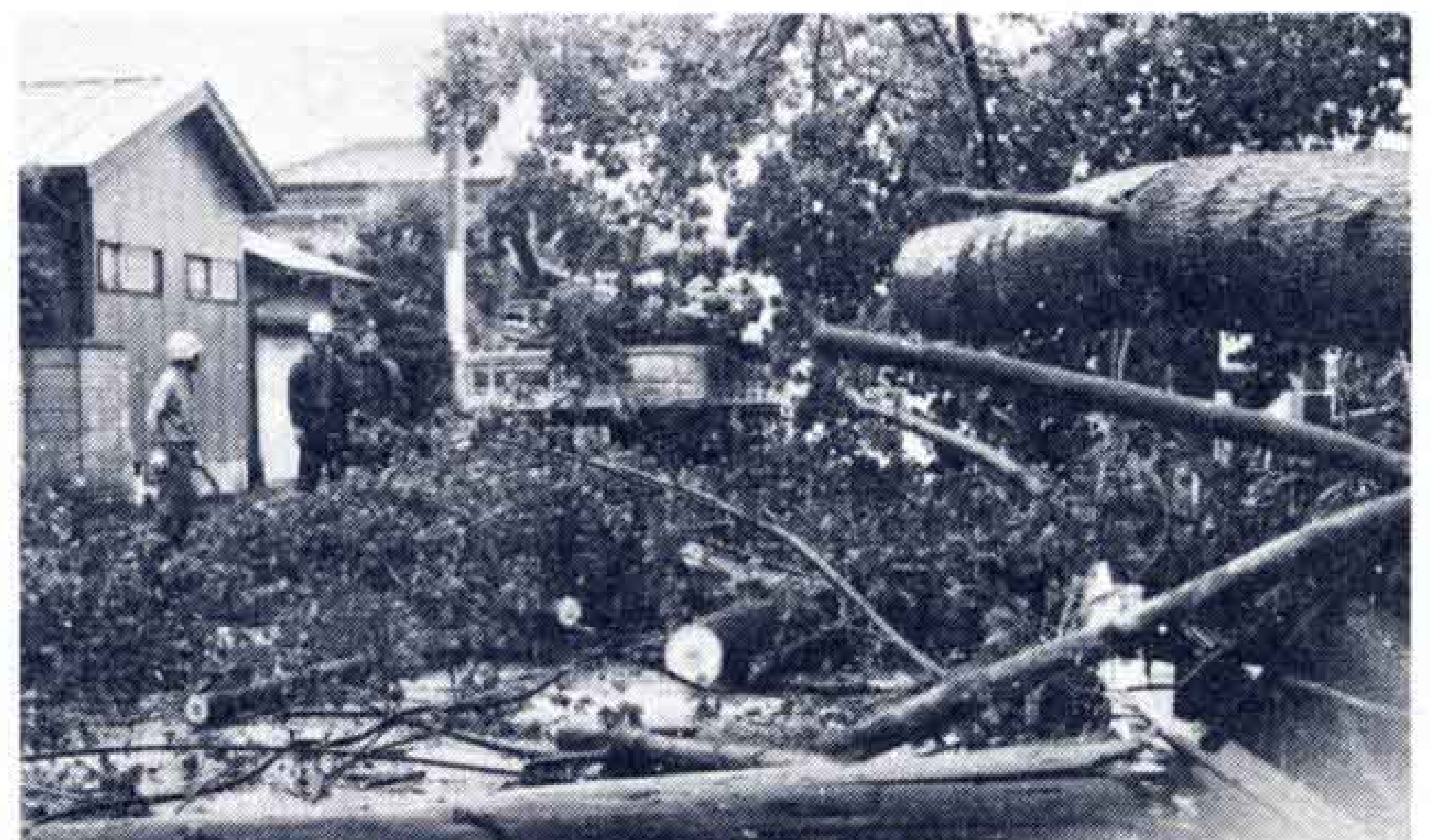
△大木もついにダウン(米の宮神社前)