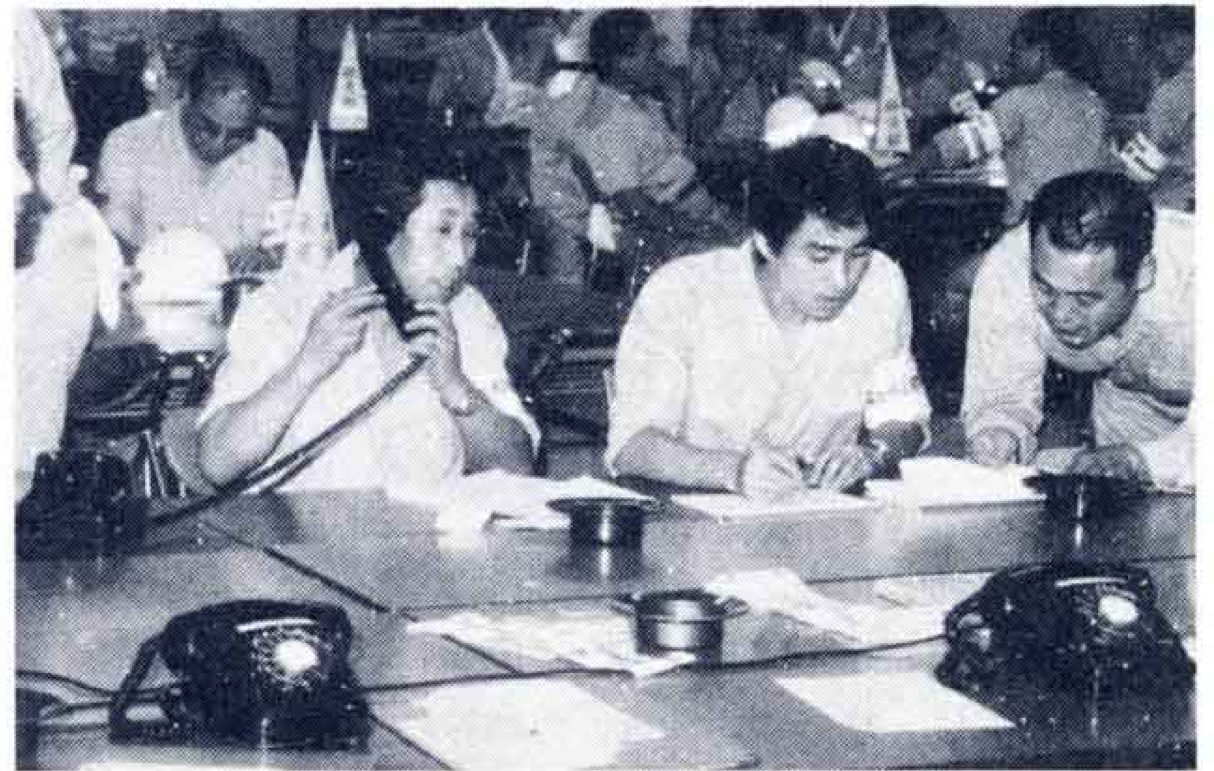
△災害対策本部を設置