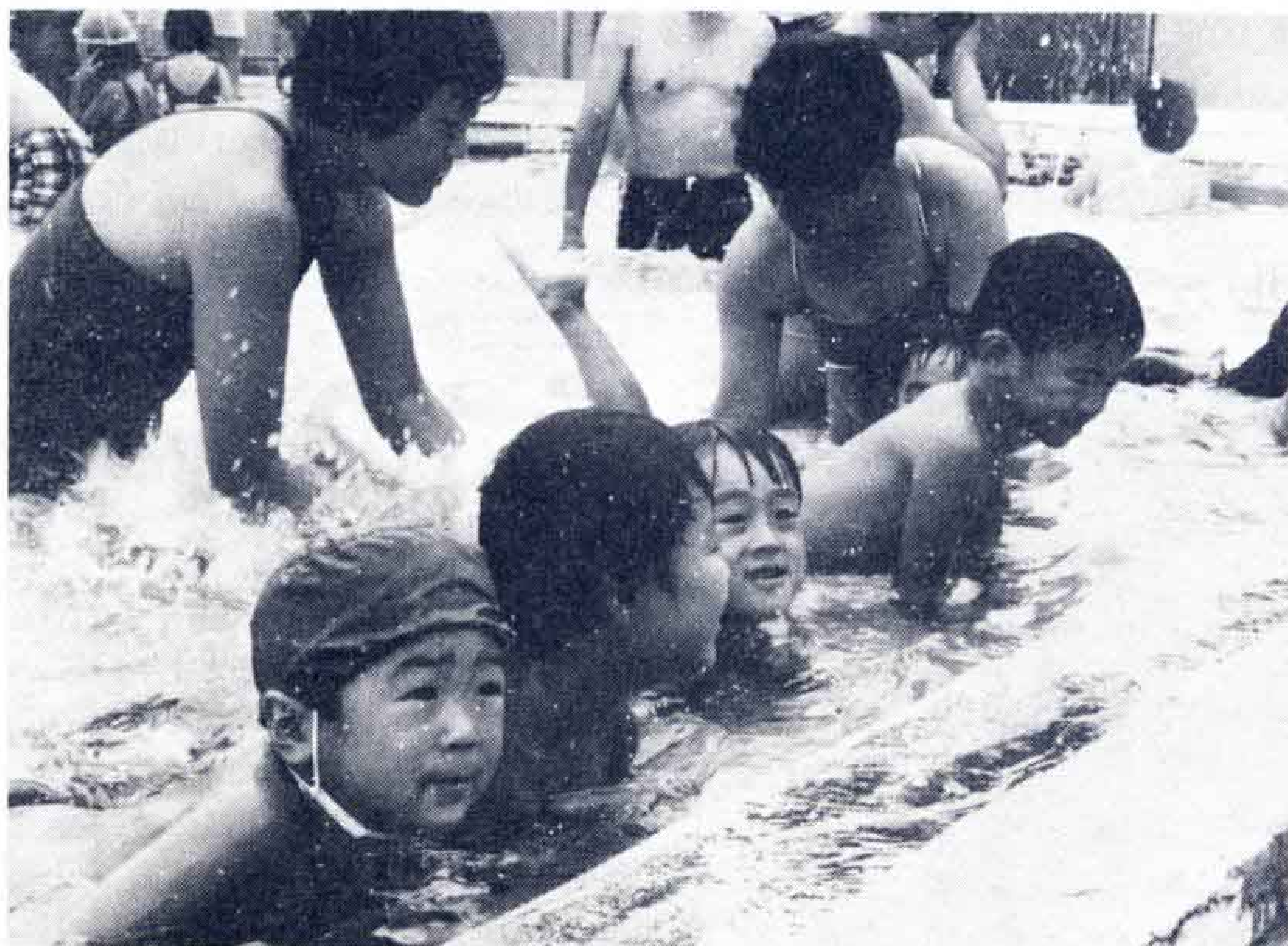
△プールサイドで、まずバタ足の練習

子どもたちは、それぞれの能力に応じた4つのグループに分かれて練習。今までまったく泳げなかった子どもたちも、猛練習の甲斐あって、4日目には泳げるようになりました。