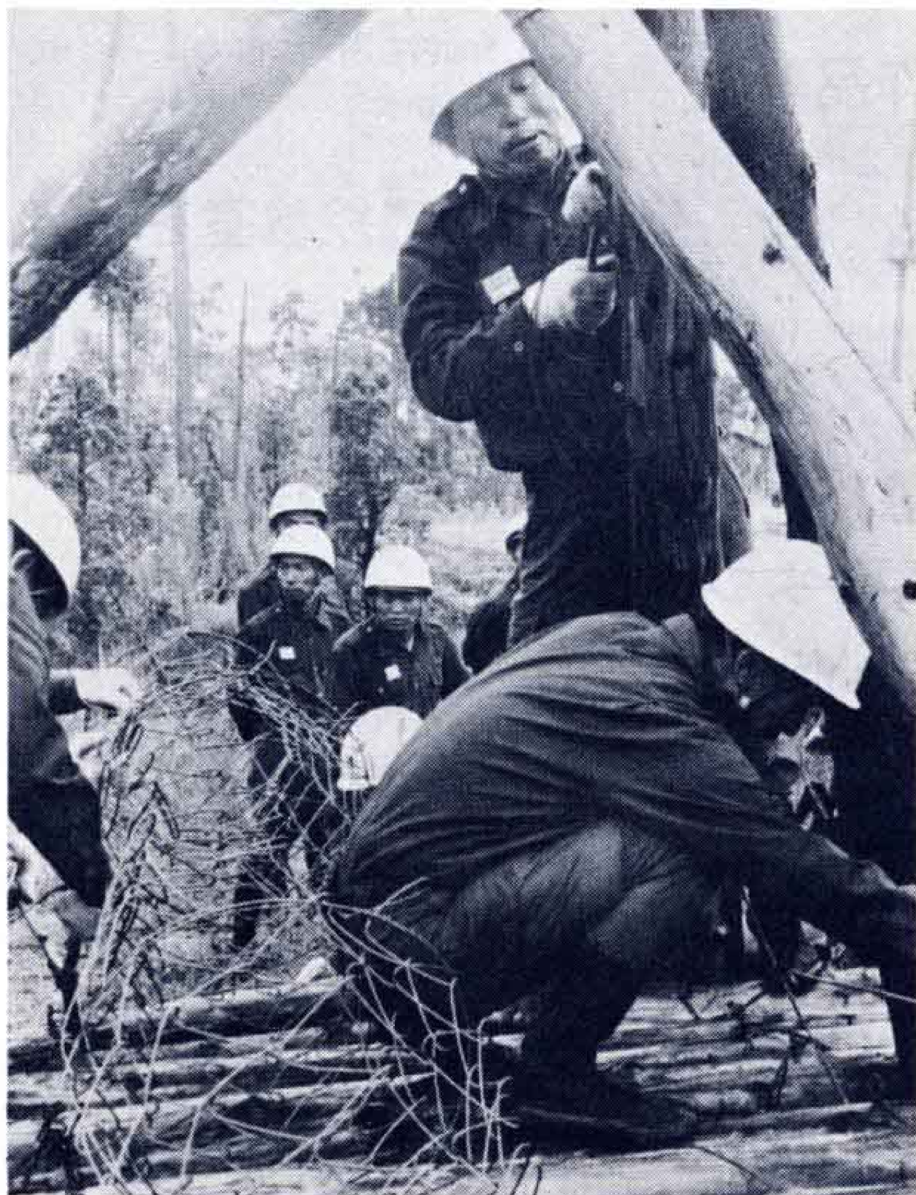
材木と蛇籠を使った川倉工法