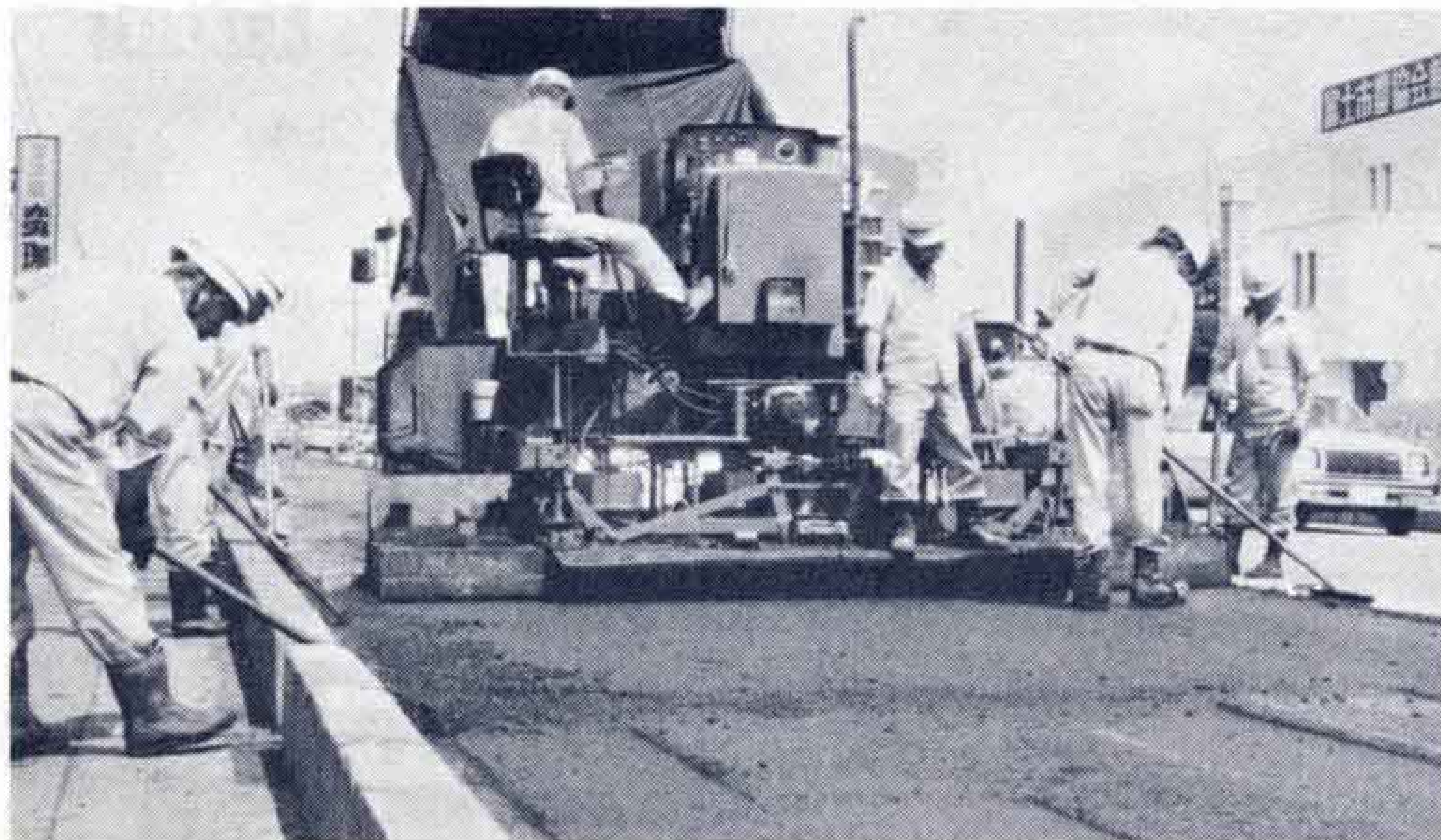
道路補修には多くの人手と経費がかかります 国道1号線