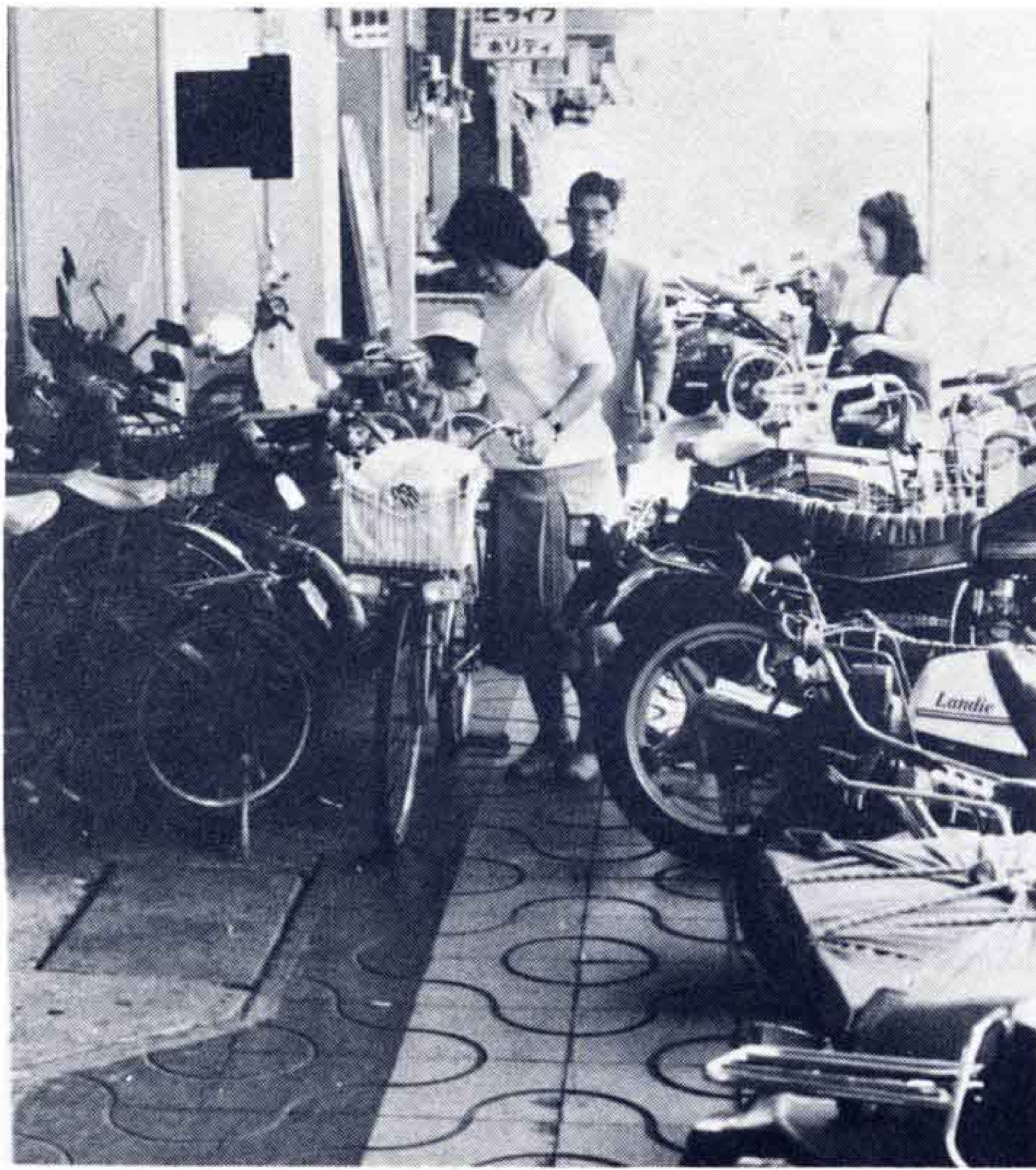
△せつかくの舗道もこれでは……