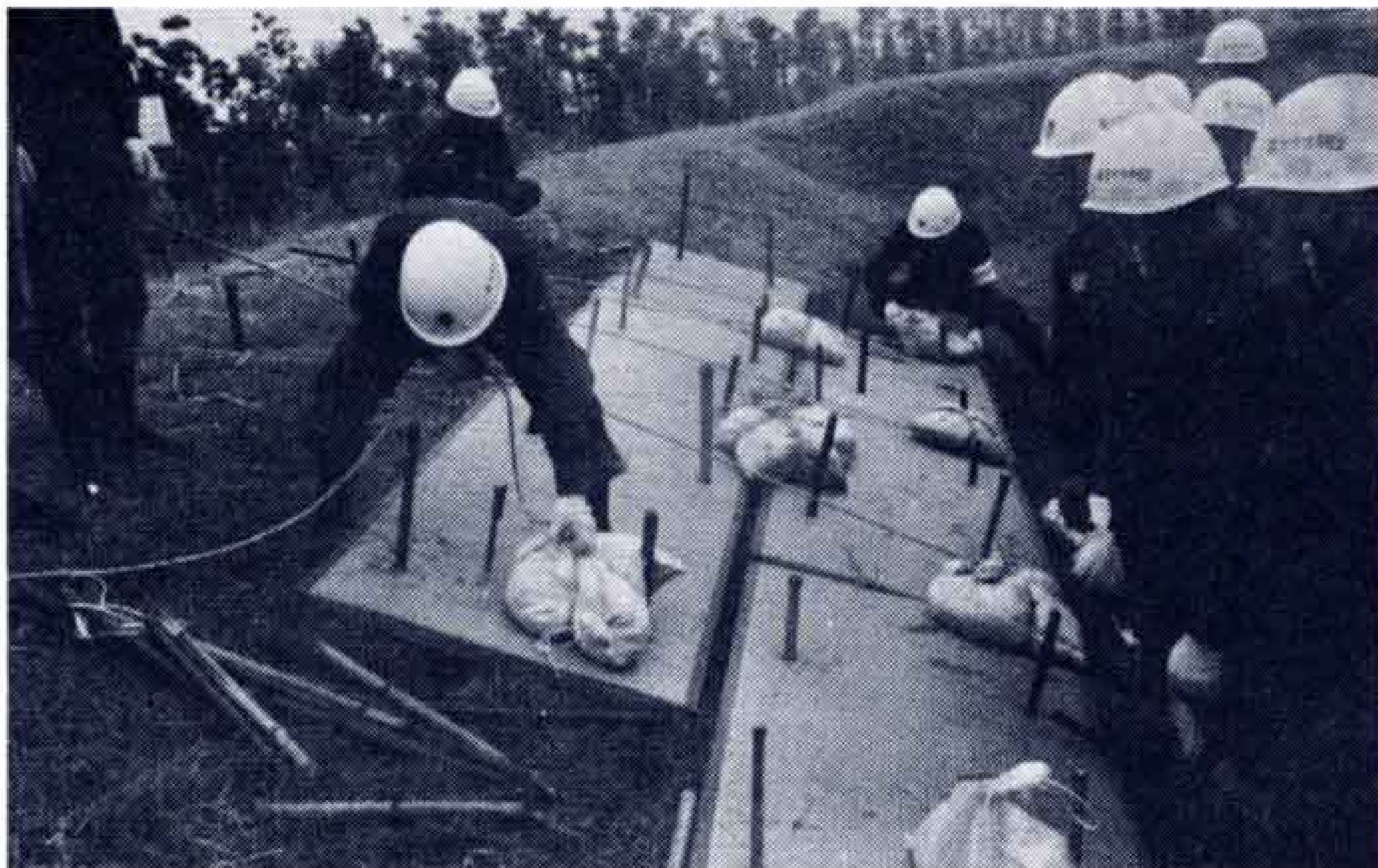
畳を使って堤防の亀裂を防ぐ畳張工法