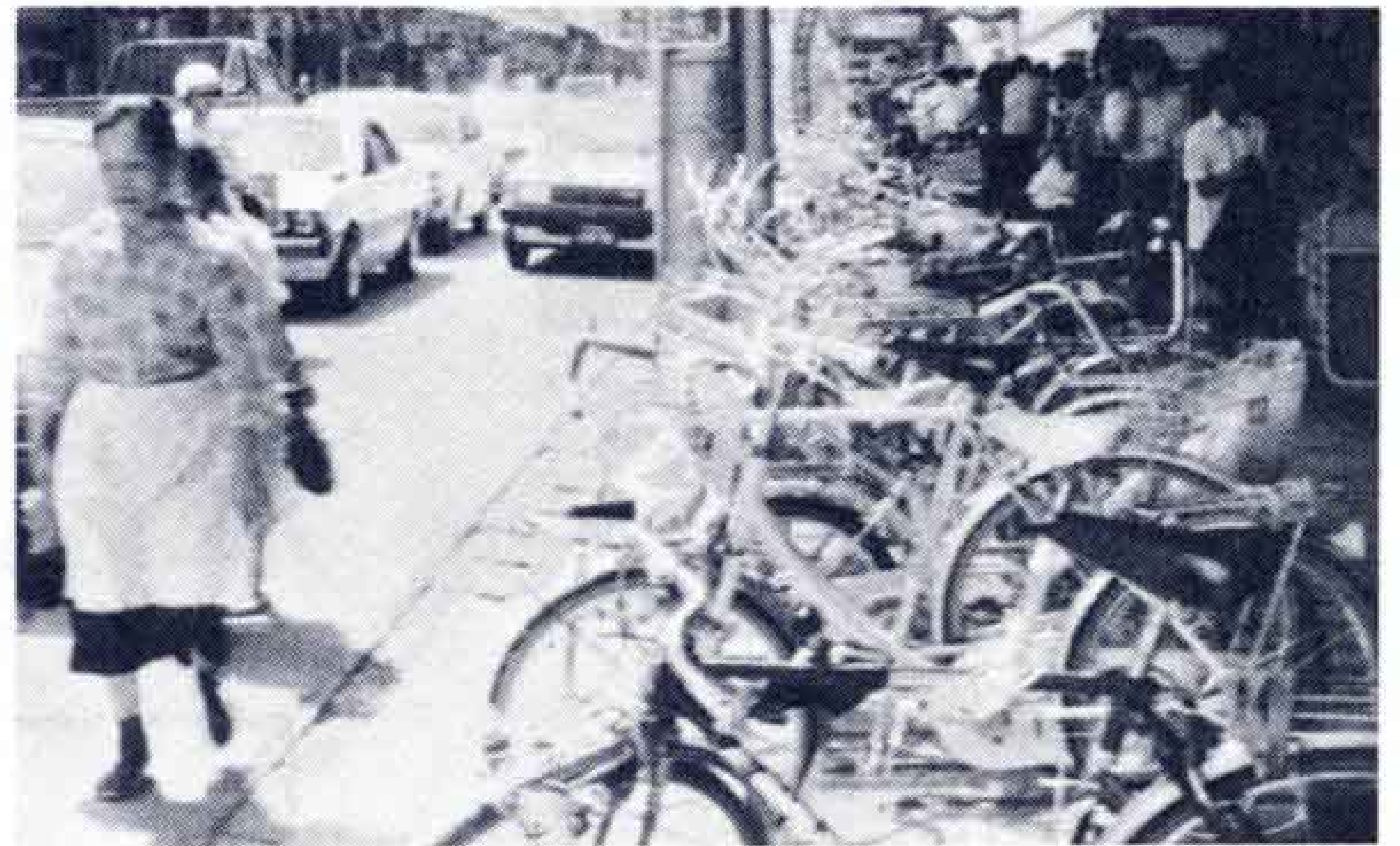
▷舗道は右側ですよ