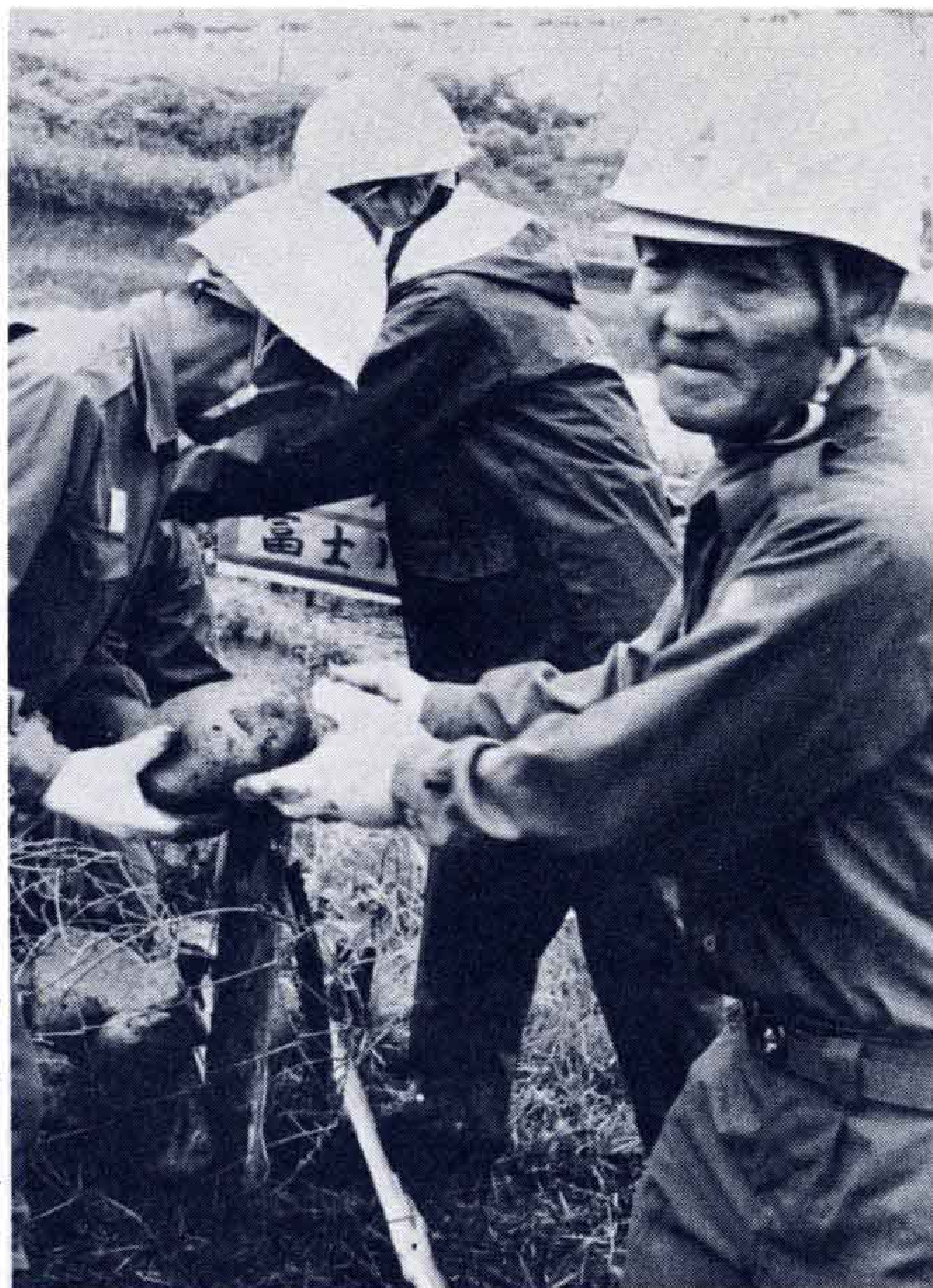
▷石を渡す手にも力が入る