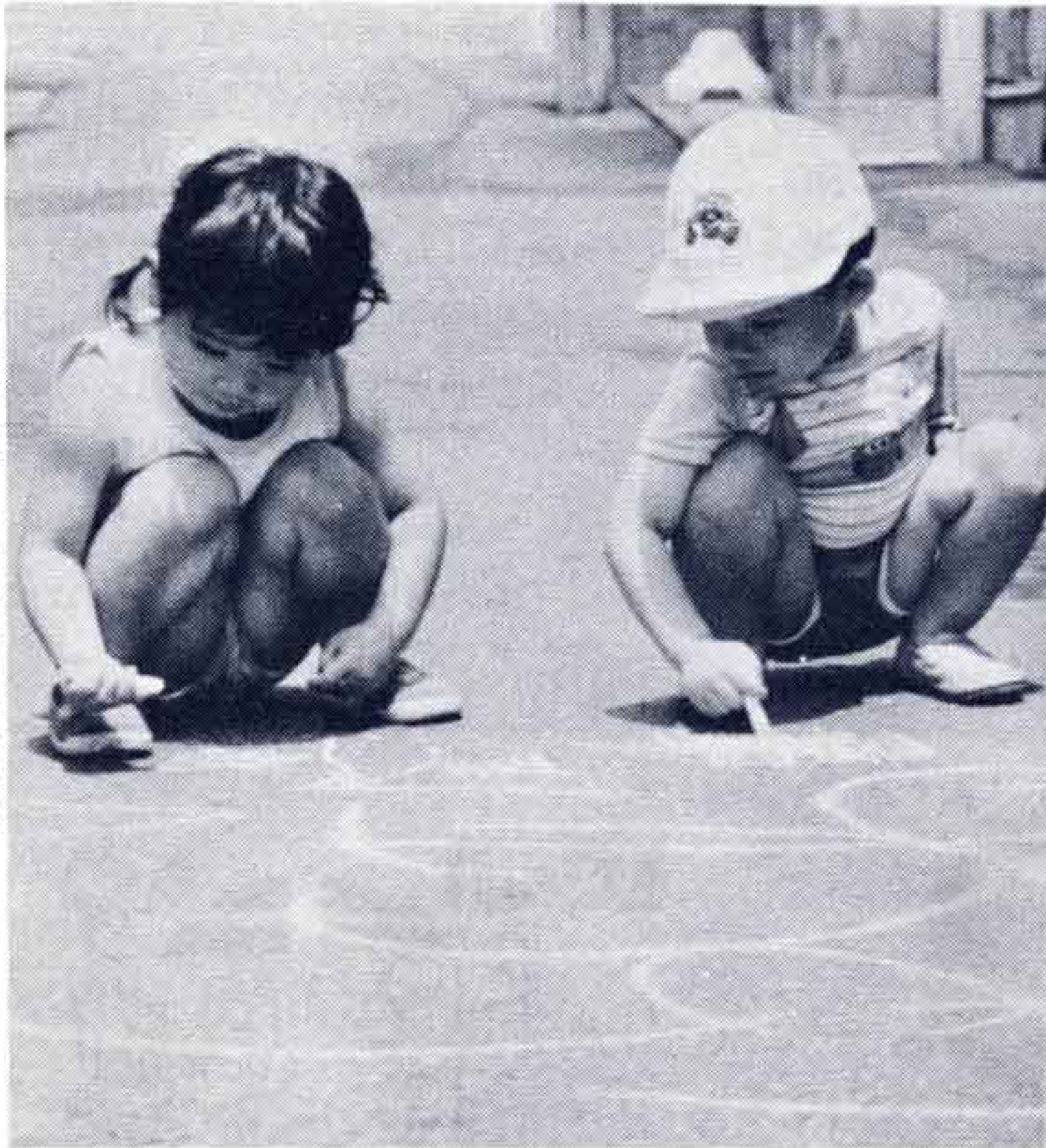
▷露地は子どものふれあいの場でも

道路は、人間にたとえると血管と同じようなもの。もし、血管が切れたり、つまったりしたら大変なことになります。これと同じように、道路が破損されたり、狭い道路の上に物が置かれていたら、私たちの生活に支障をきたします。道路は、私たちみんなの財産です。汚さず、こわさず、いつも広く、きれいに使いましょう。