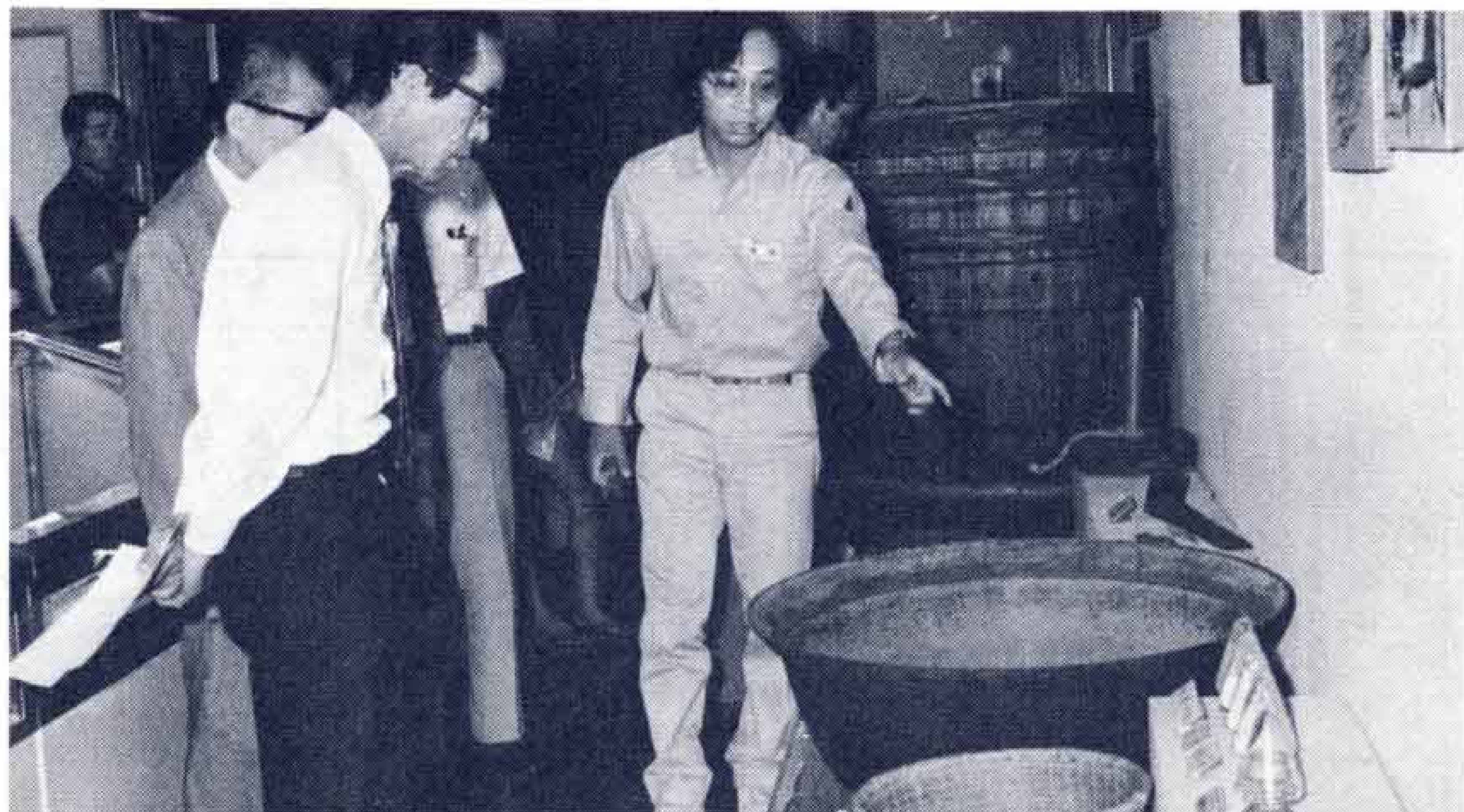
8月31日まで開かれる企画展

この企画展は、富士市の地場産業として発達してきた製紙に対する理解を深めていただくためと開いたもので、世界17ヵ国の手漉紙52点、原料や道具等96点が展示されています。