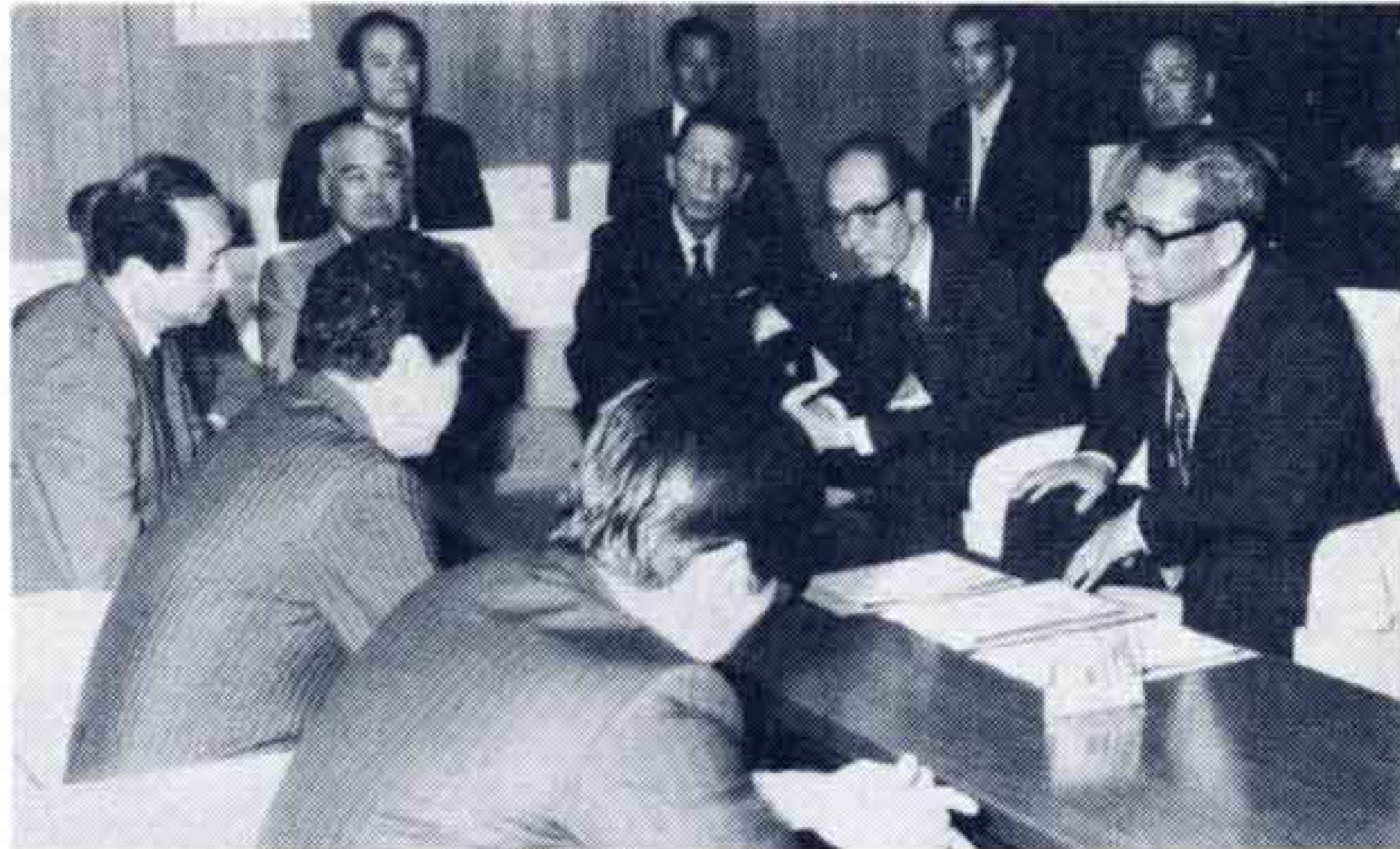
新幹線富士駅設置を国鉄本社に陳情

第2点は、耐久性の問題です。海岸など特殊な地域を除き、部品交換などの手入れによって、10年以上の使用に耐える設計になっているかを確認しましょう。また、優良な温水器にはBL（ベターリビング）マークがついています。建設省では、優良な住宅部品の認定表示としてBL