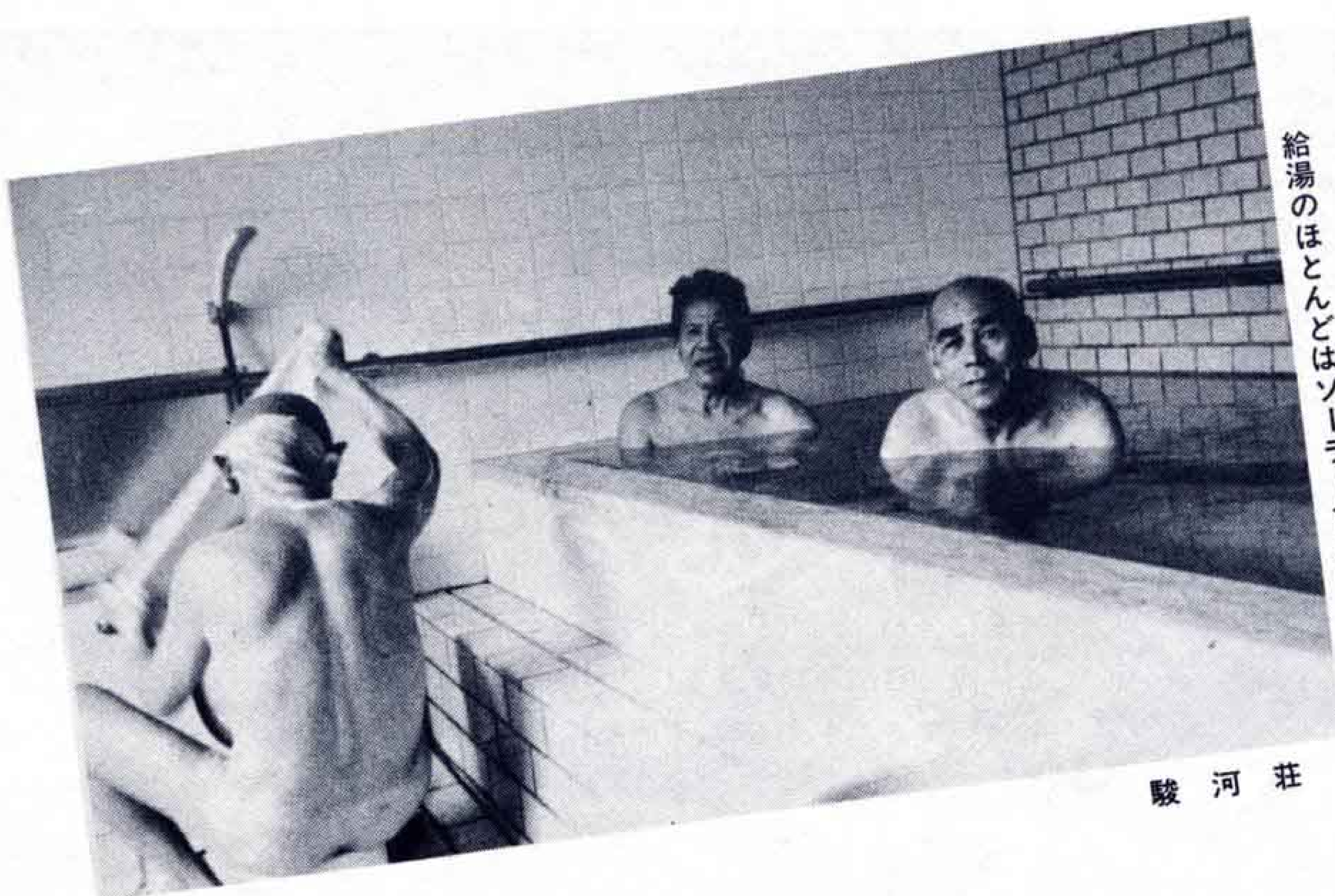
給湯のほとんどはソーラーシステム