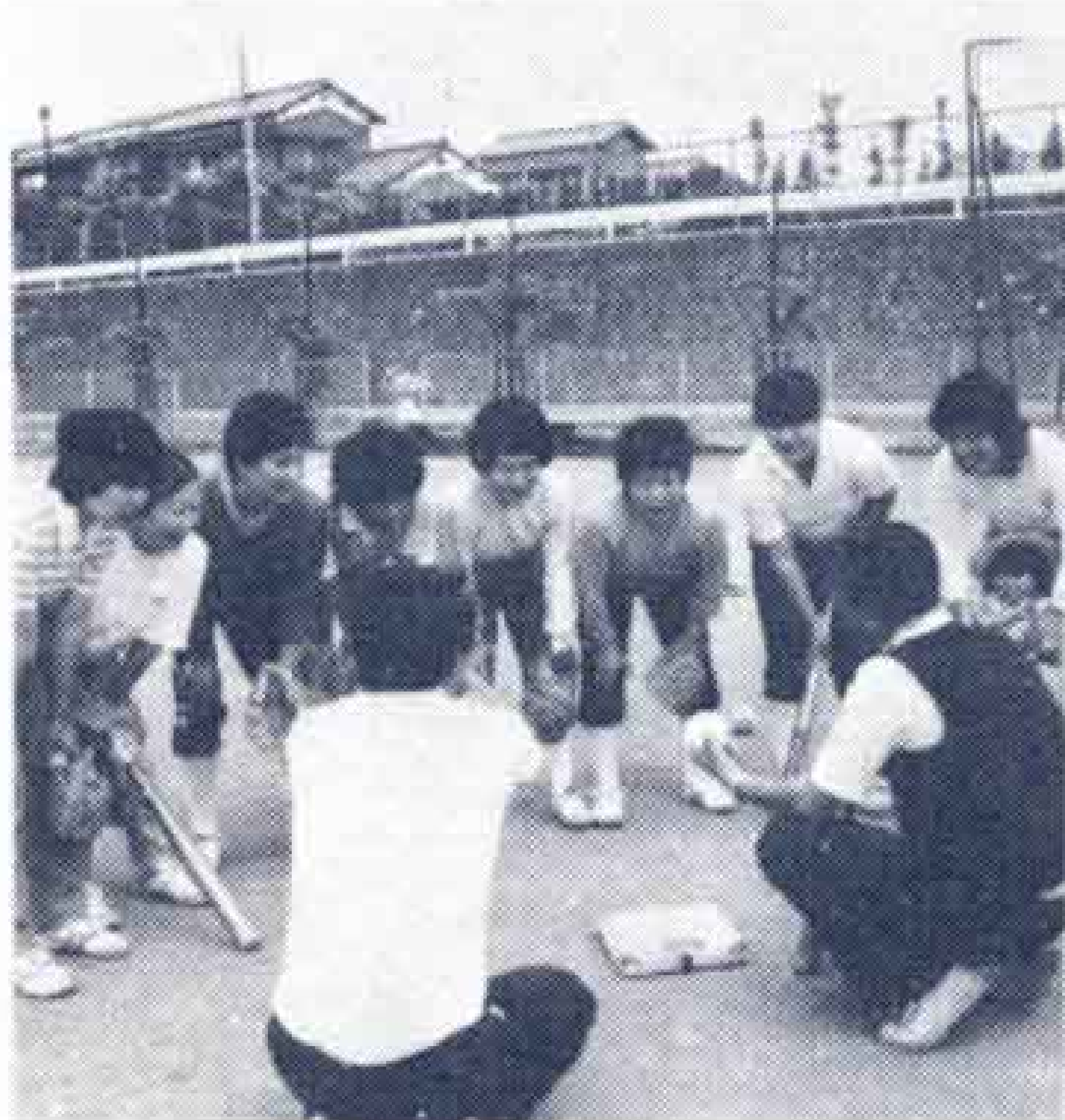
●監督を中心にチームワークの良さが自慢

創立四年目で念願の全国大会出場が決まった。来る八月二十七日、全国家庭婦人ソフトボール選手権大会が後楽園球場で開催される。先の東海四県の予選会で三位に入賞したからだ。 強いチームが目標。高校でソフト部に入っていたメンバーが多いこと、チームワークの良さが幸いしている。 「若さが保てるからと主人も協力的よ。」子供づれの主婦が笑いながら言った。