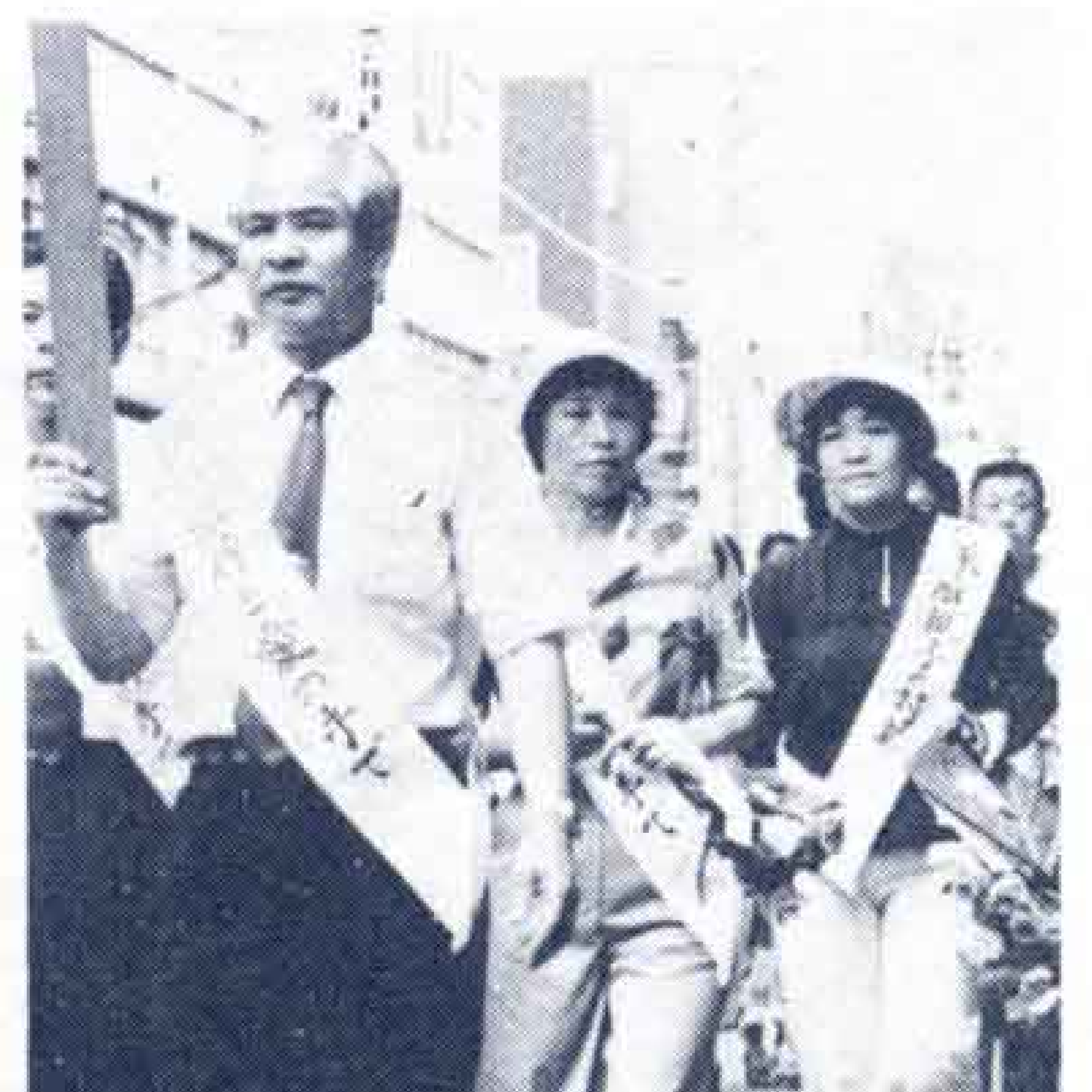
昨年の社会を明るくする運動街頭パレード