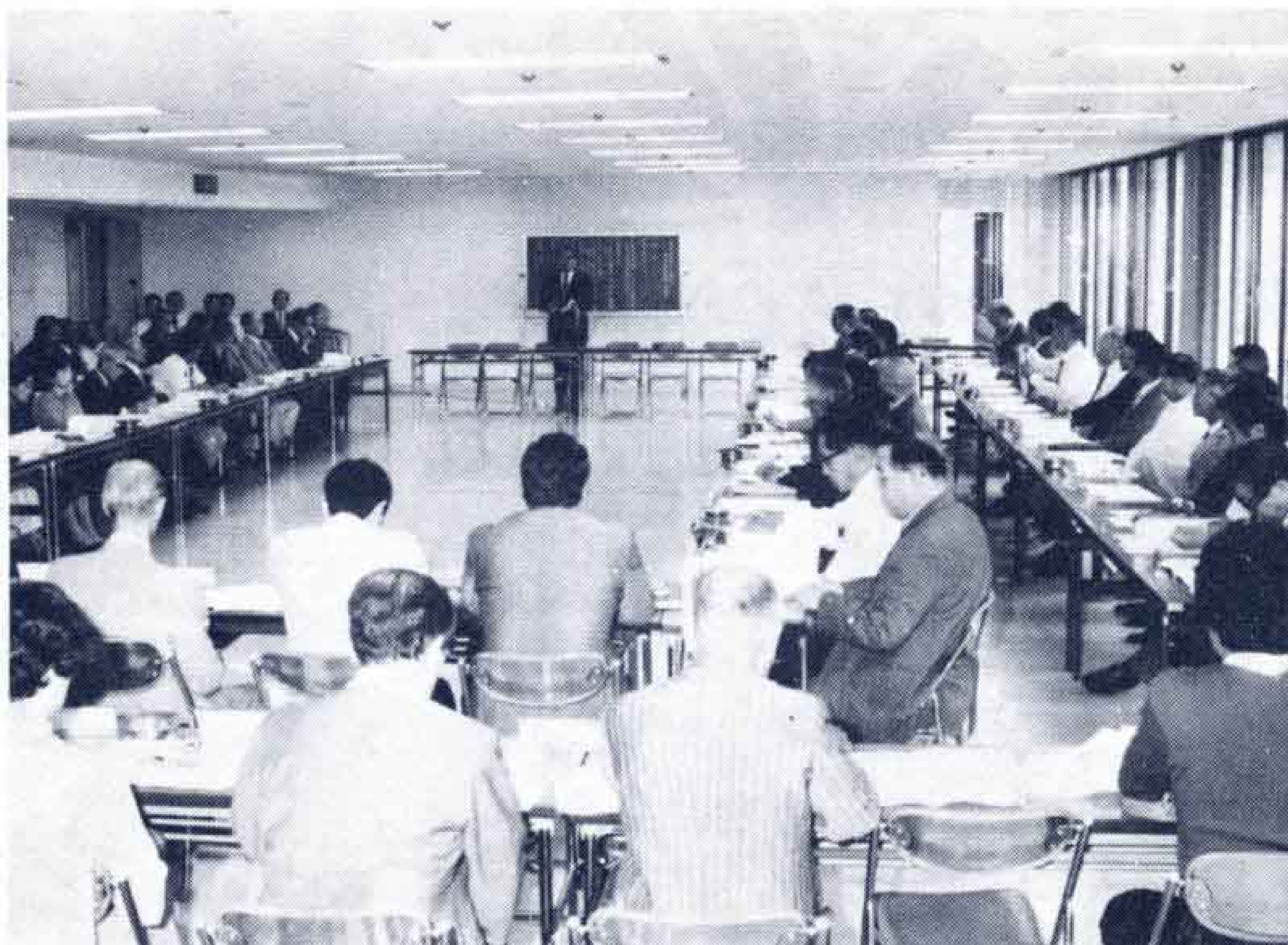
市民懇話会が結成されました