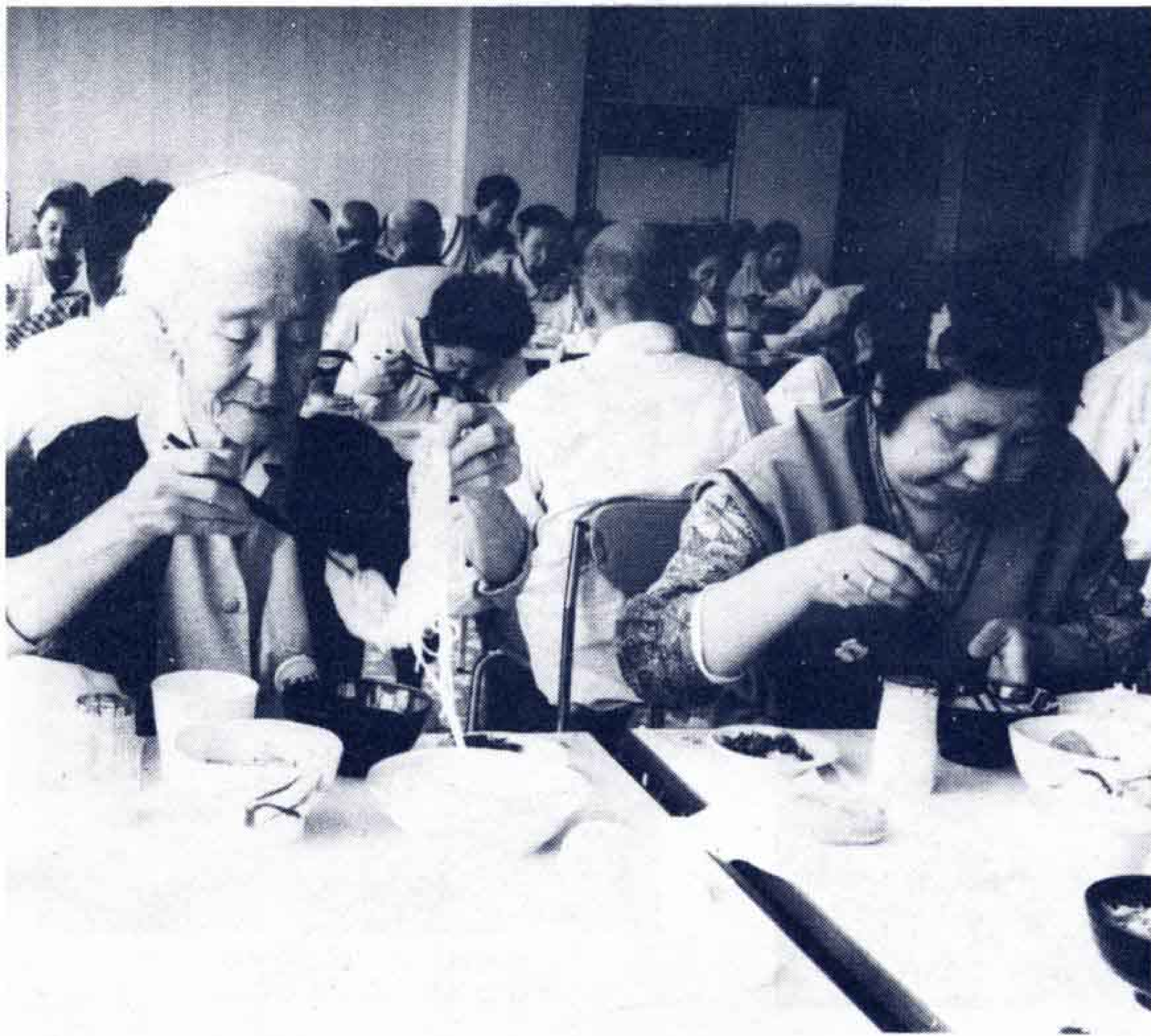
△食事の時間は楽しみのひとつ