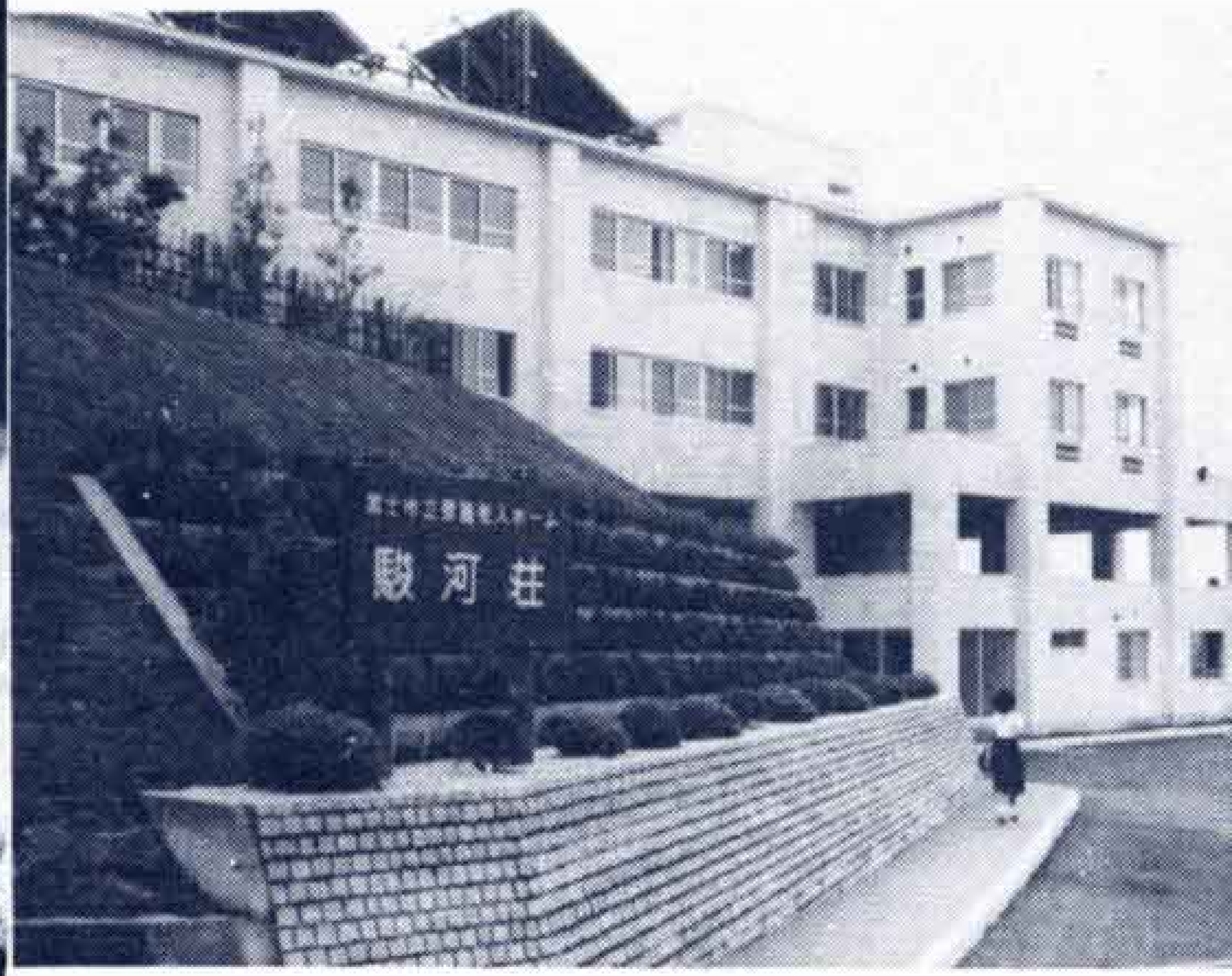
△ソーラーシステムを採用した駿河荘