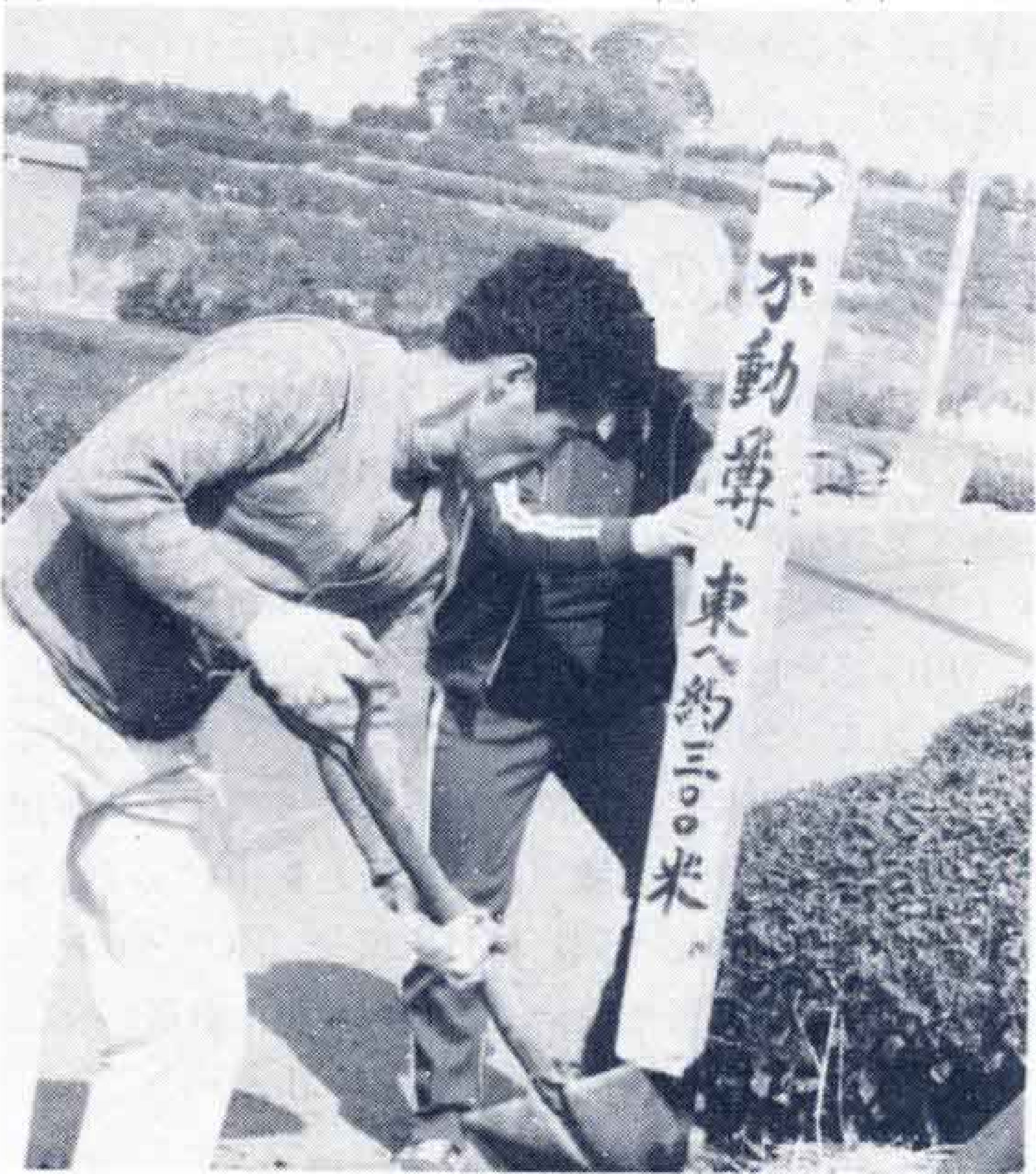
(不動尊はこのすぐ先)