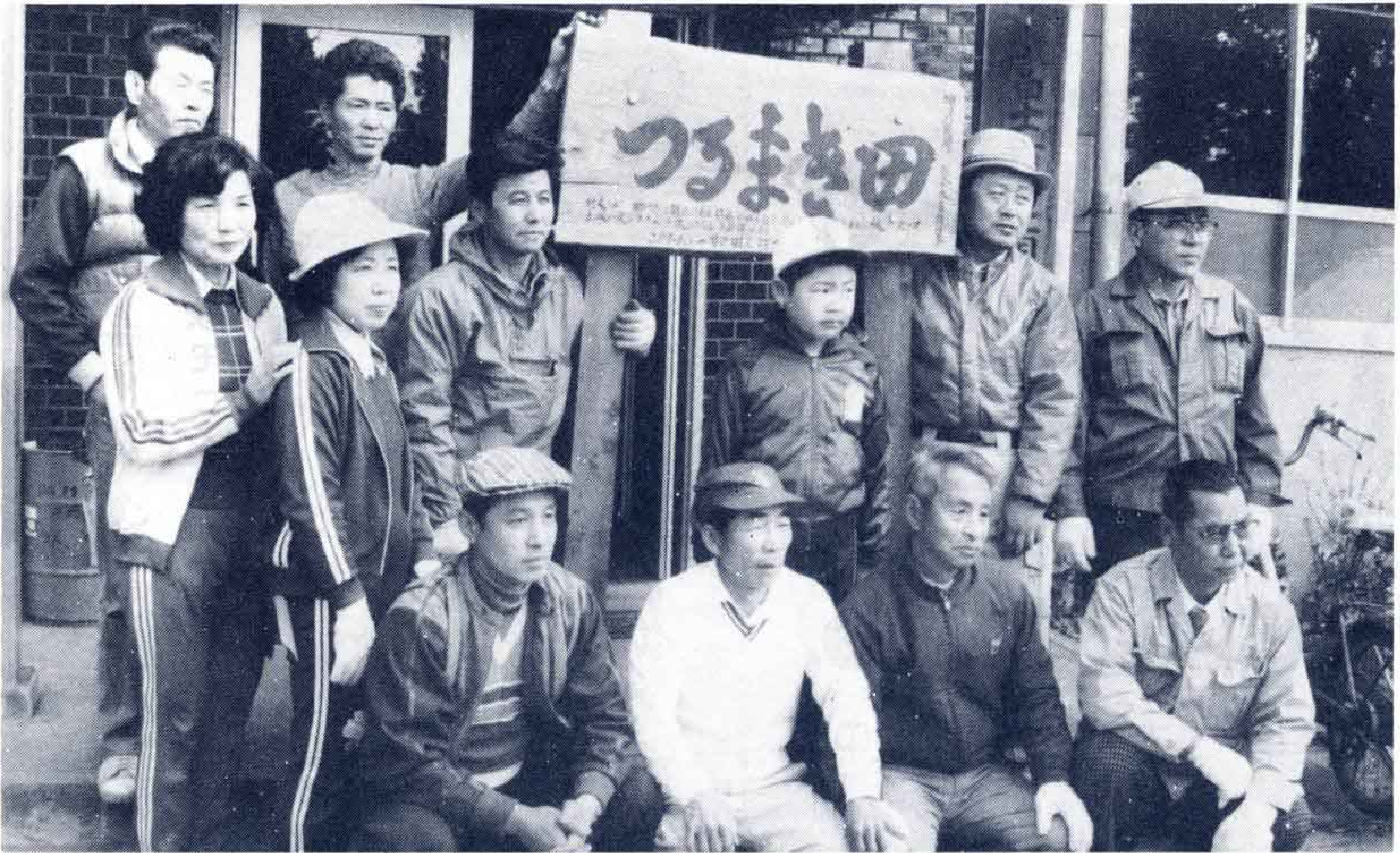
(須津公民館前で記念に一枚)