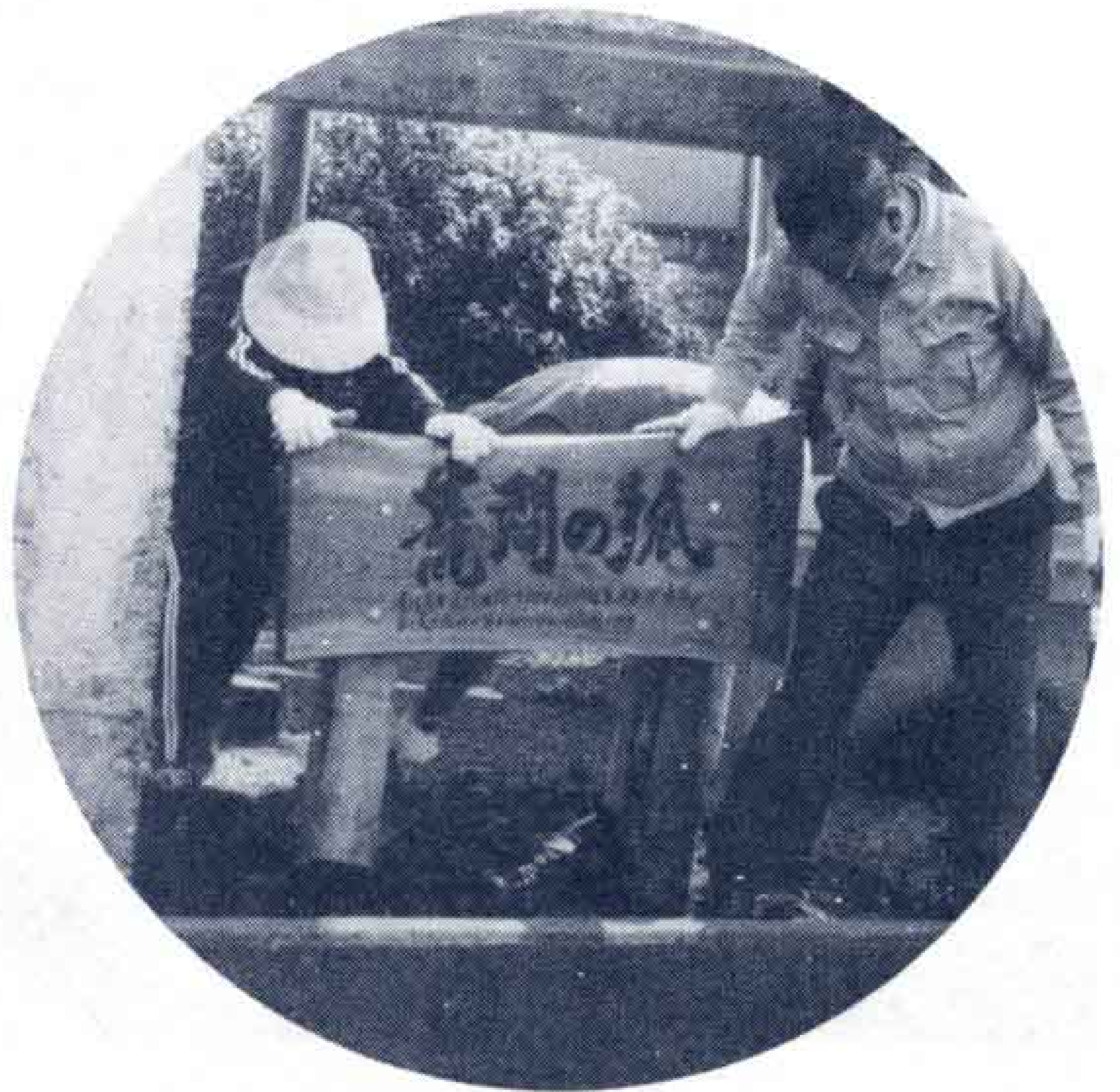
(古狐が出て人間を化かした)