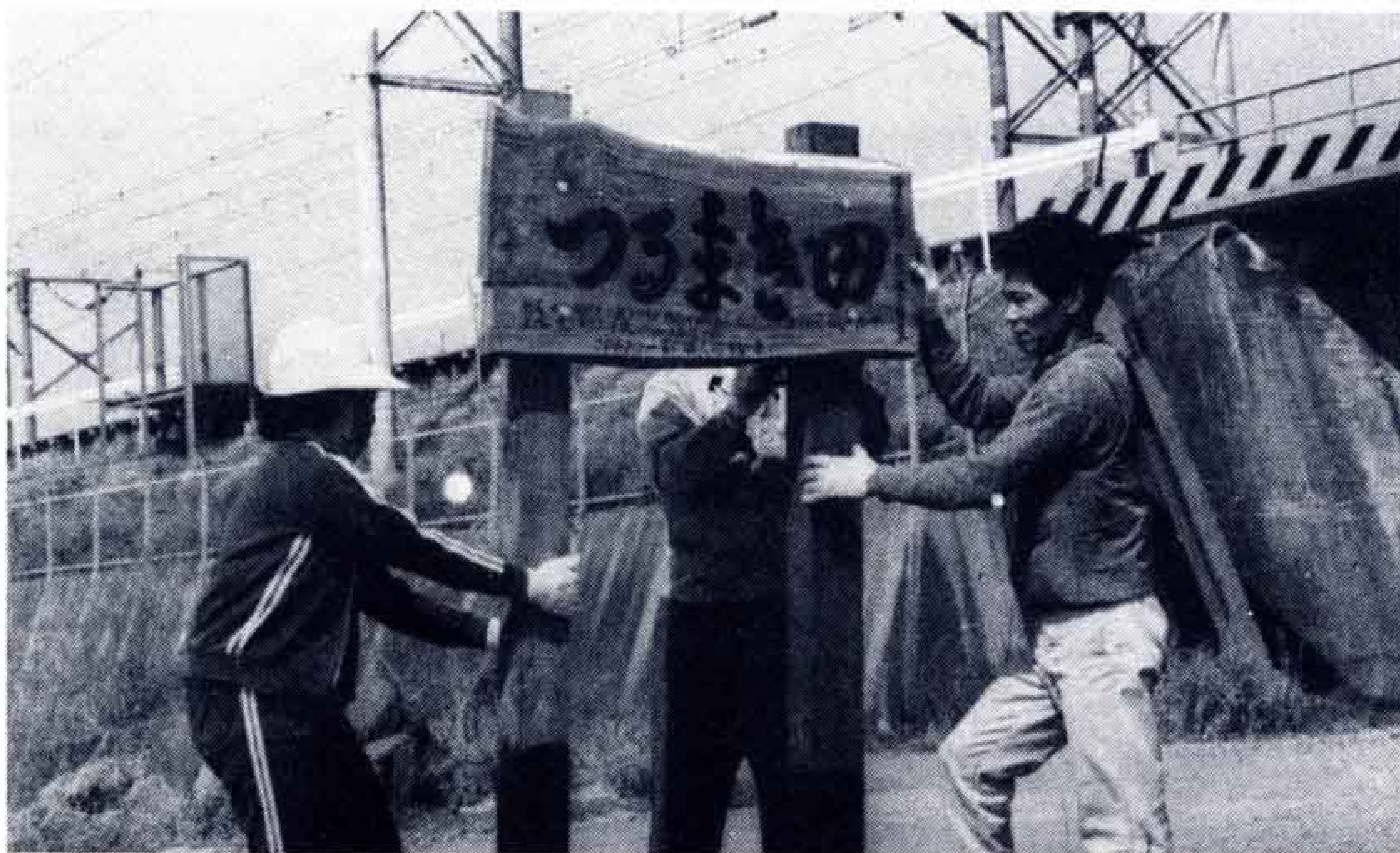
(このあたりが鶴の田んぼといわれた)

3月19日、須津地区社会教育推進協議会のみなさんが、地元の文化財を市民に知っていただくためと案内標識や看板たてを行いました。