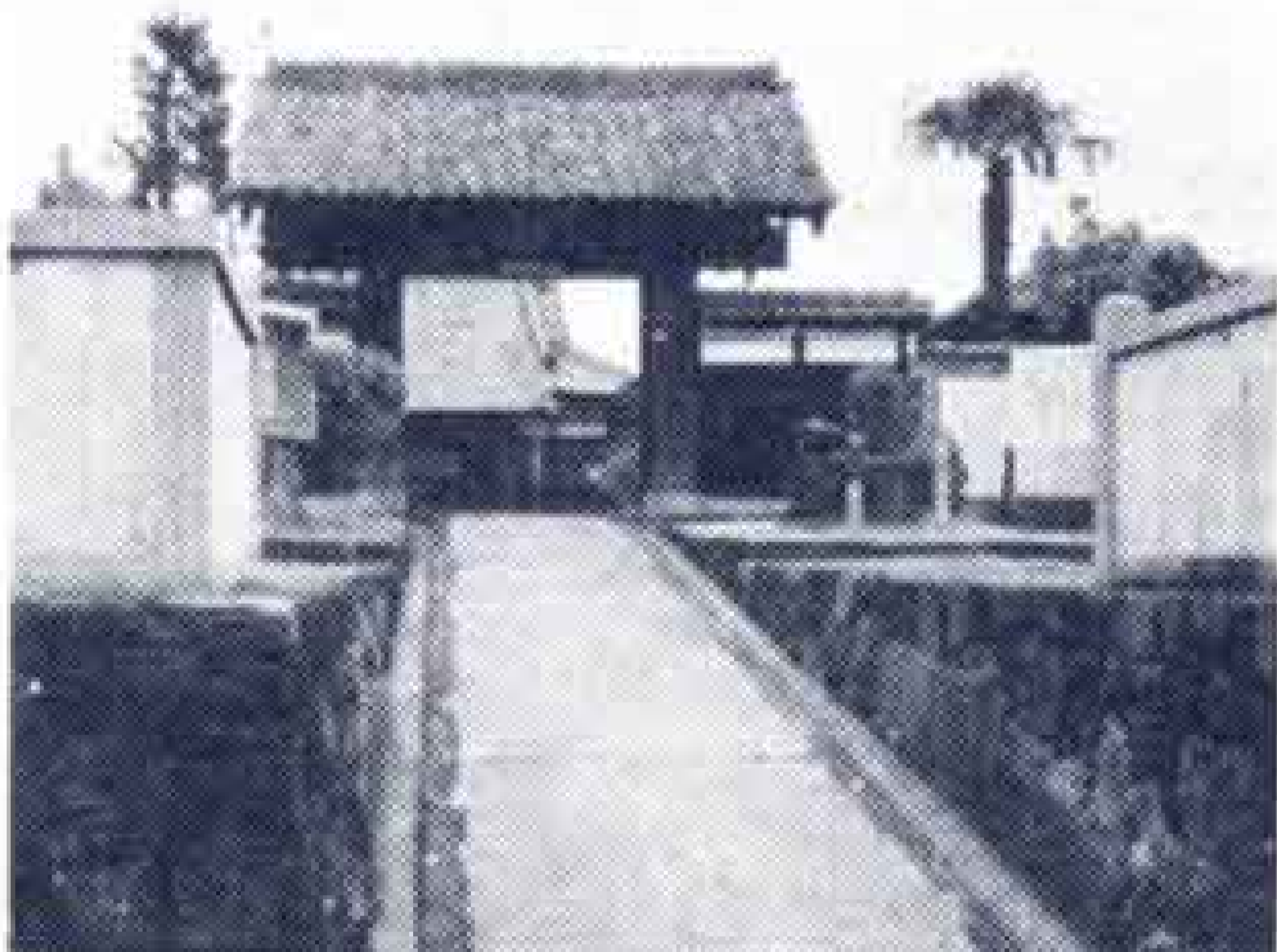
原田にある清岩寺山門

いずれにしても万葉の昔、旅人が 遠くに残した妻や恋人を想って足を 止め、積りつもったせつなさが、い つかこんな物語となって残りました。