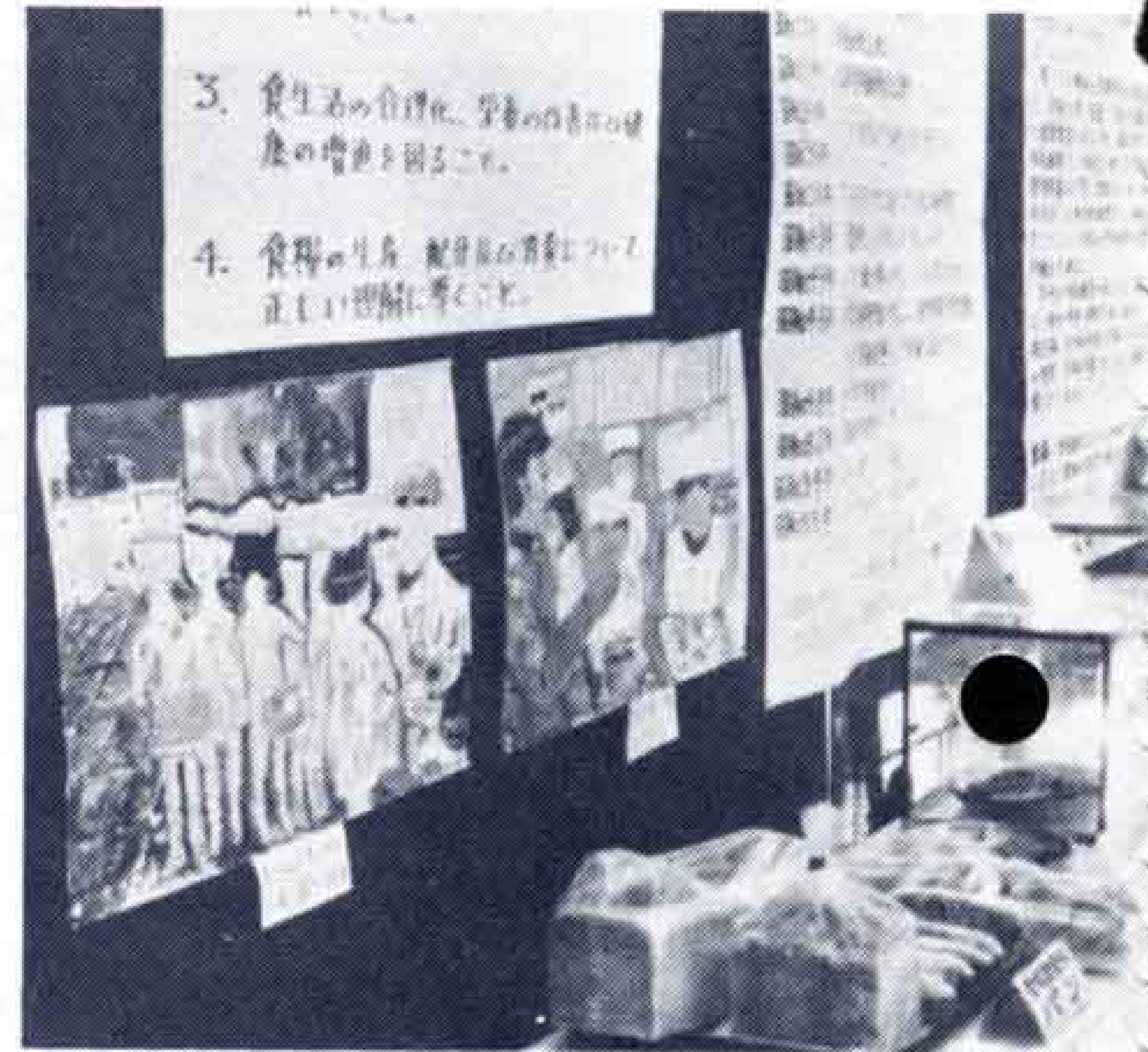
給食週間を記念して市役所市民