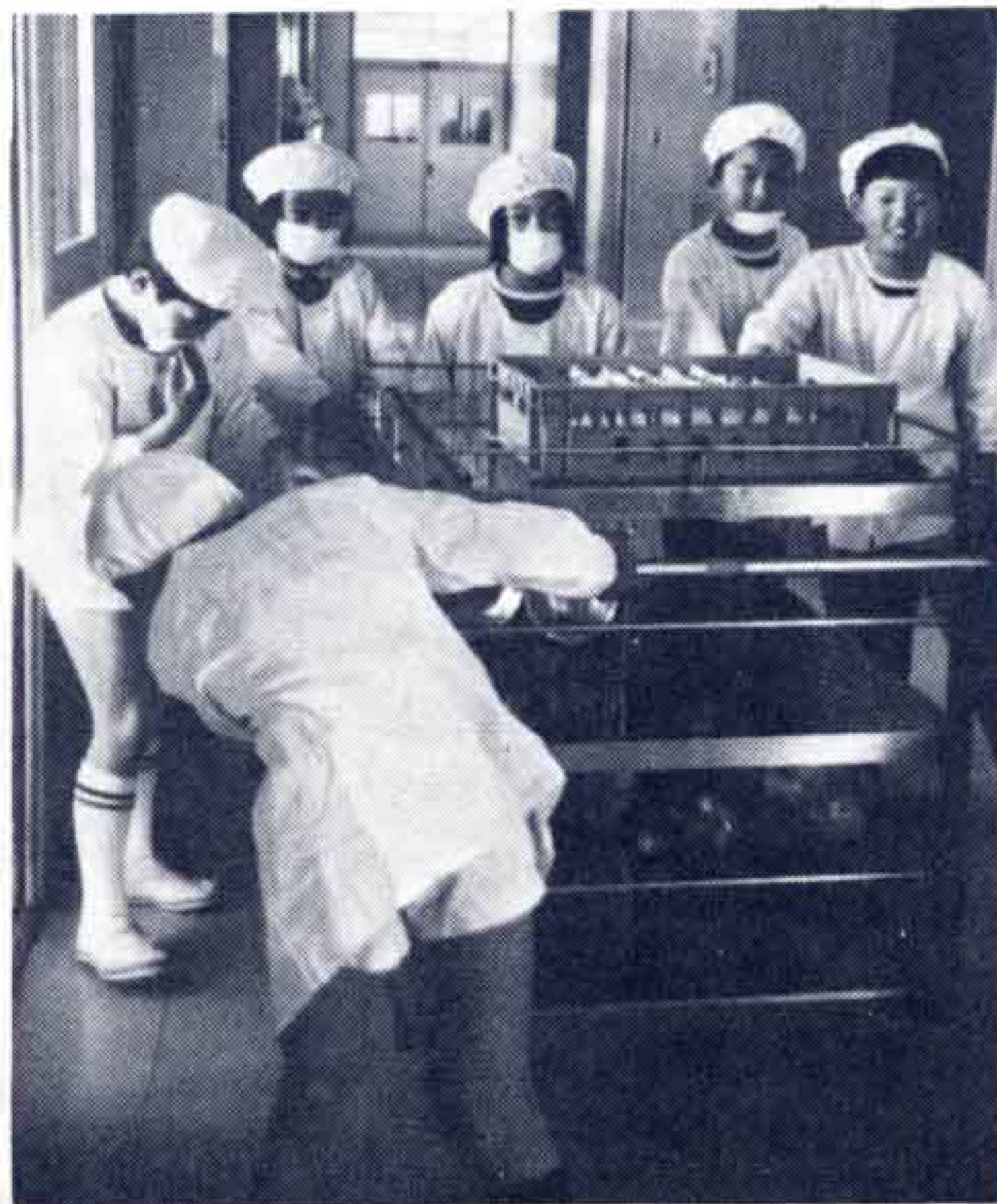
今日は僕らが当番だ