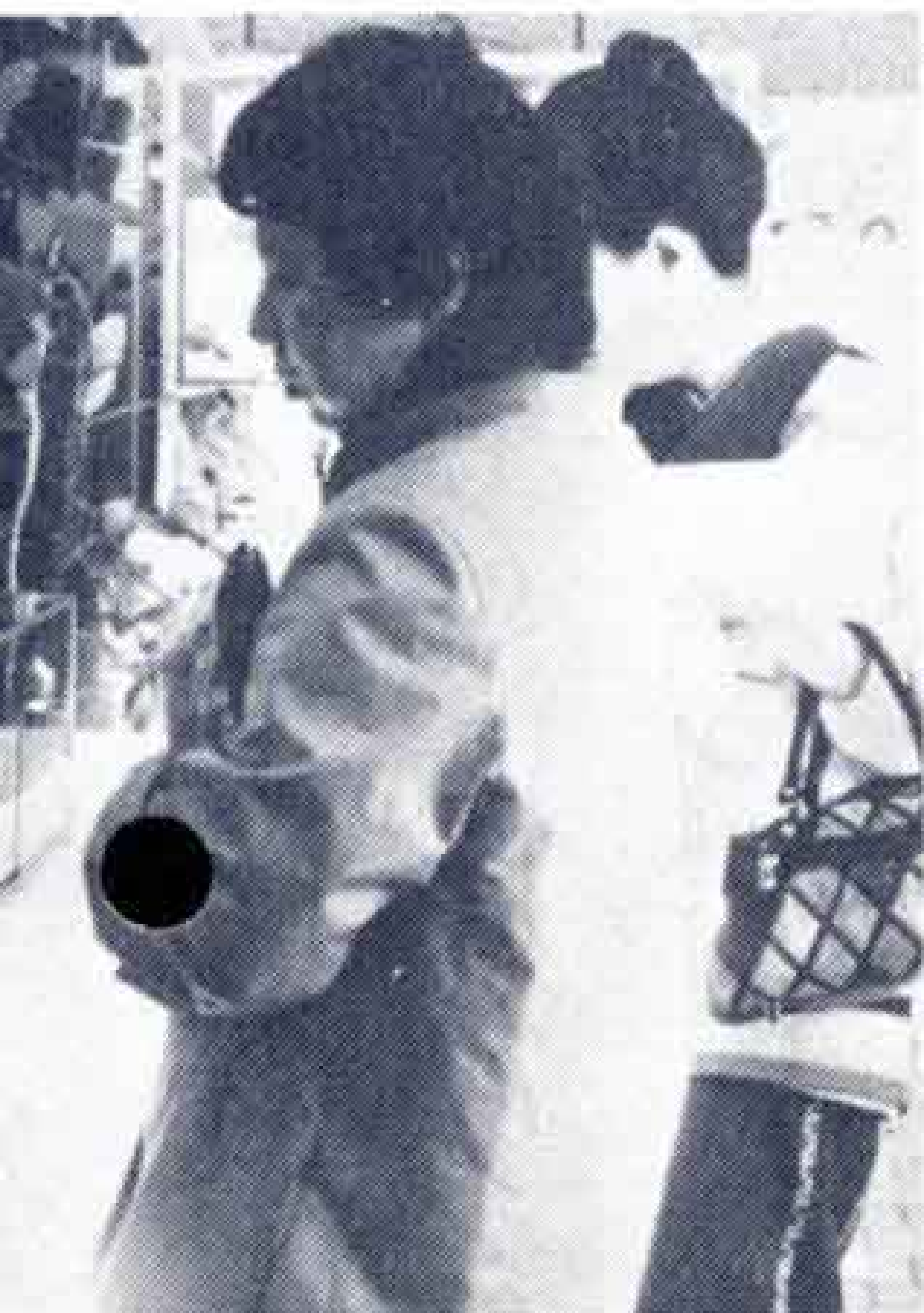
ギャラリーで展示会