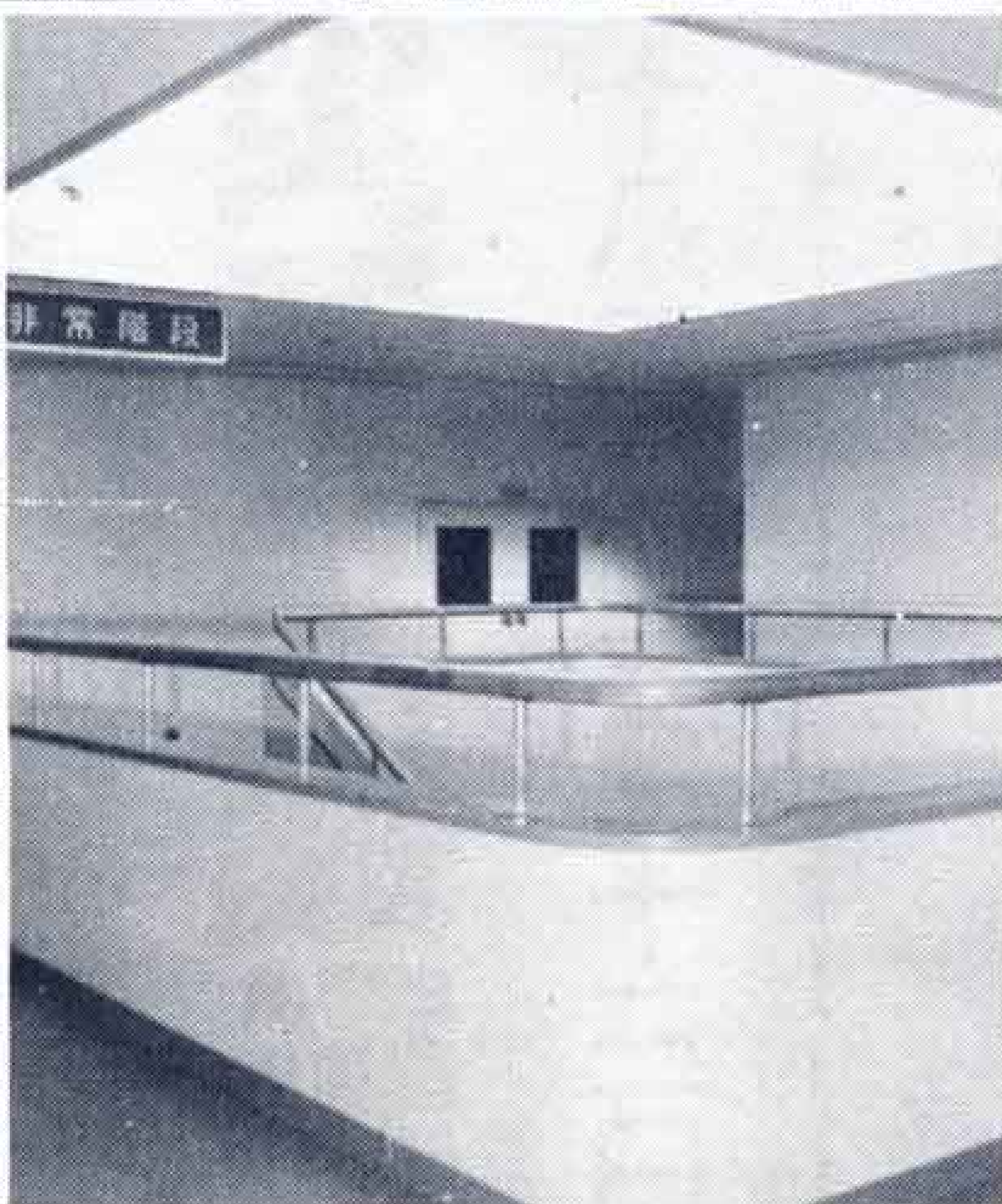
▷二階天窓からは自然採光を △二階大会議室