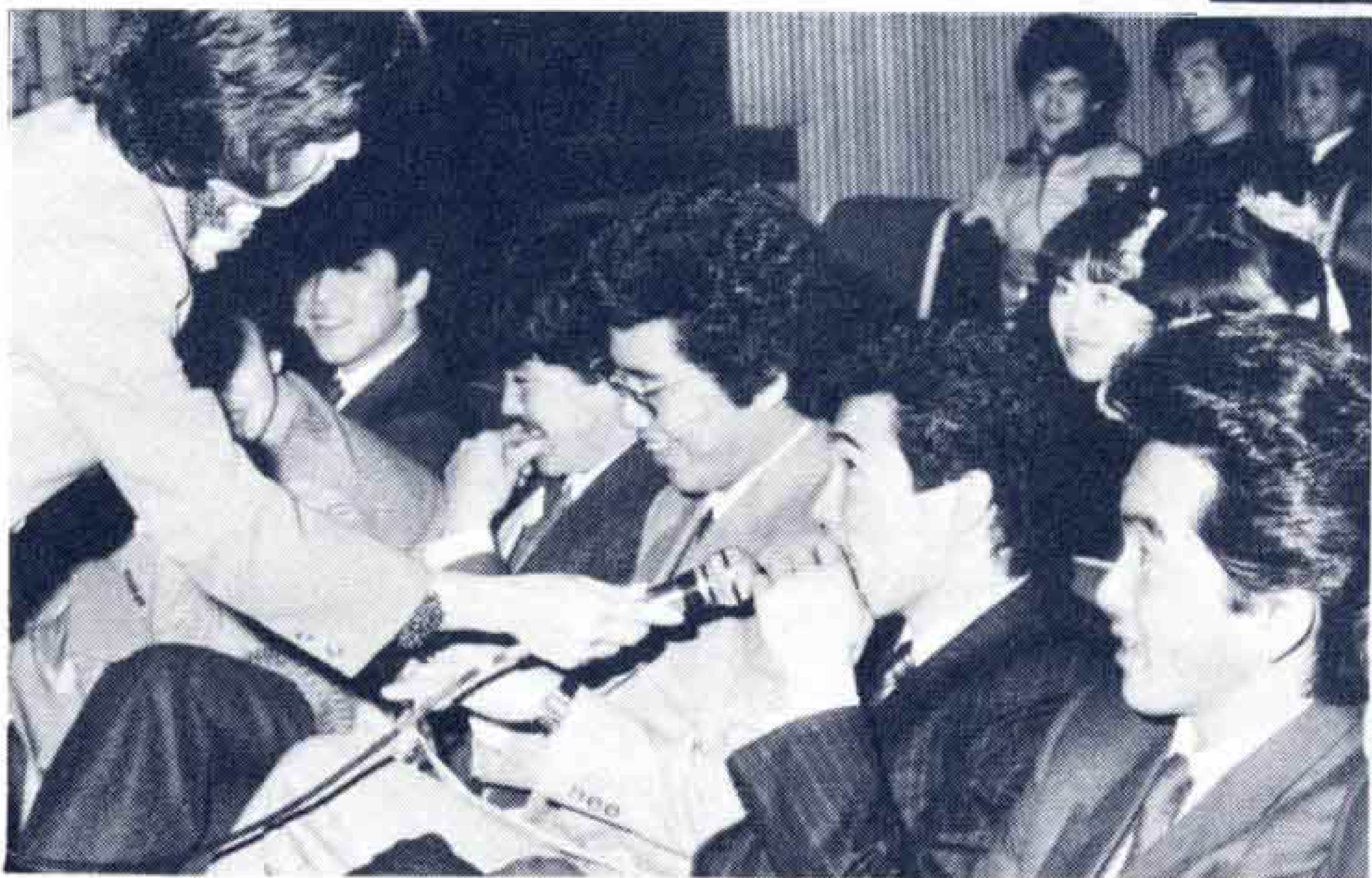
△ 成人を迎えられた感想は？……エエッ、マア、がんばります。