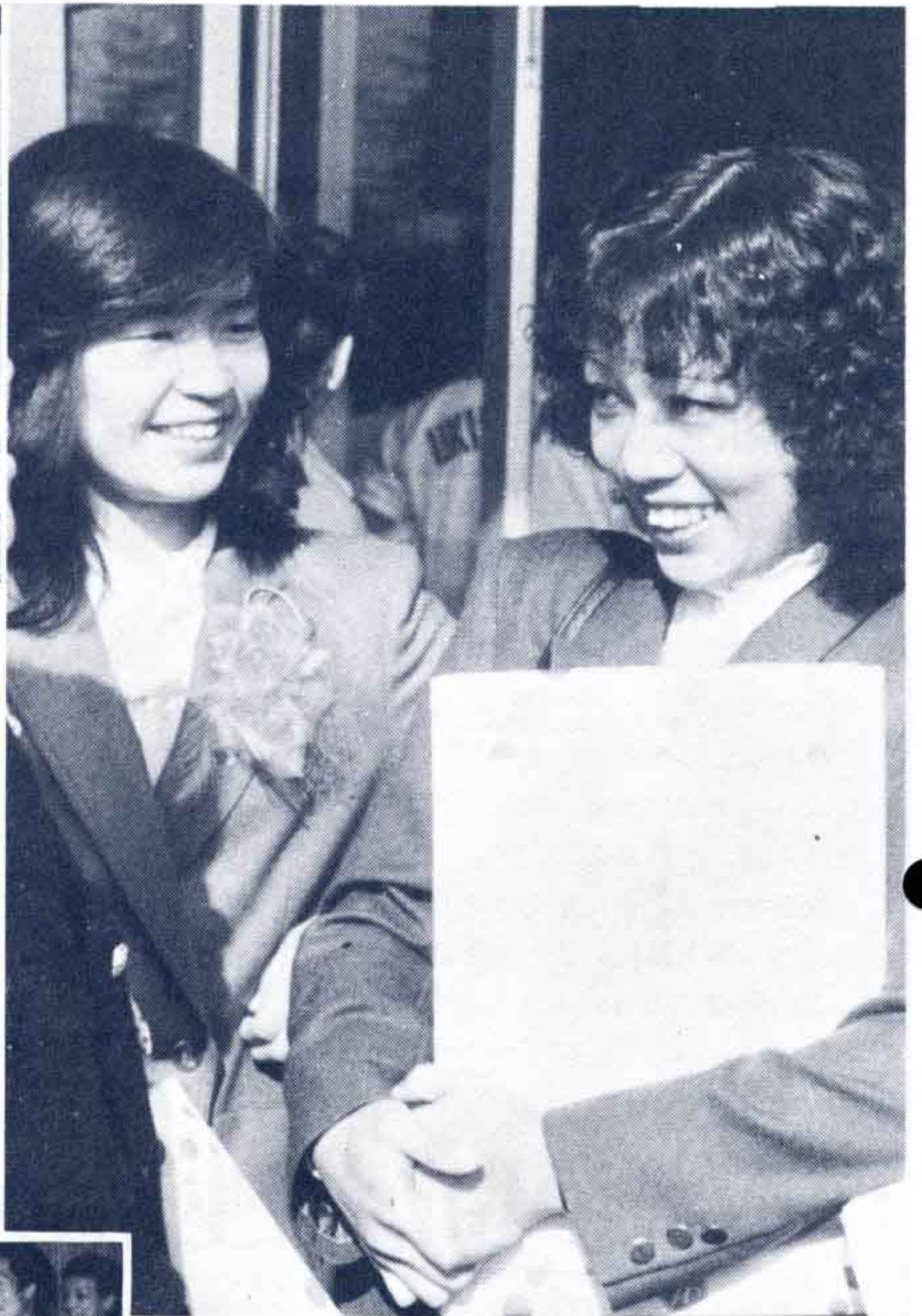
△ 成人者としてのほほえみが……