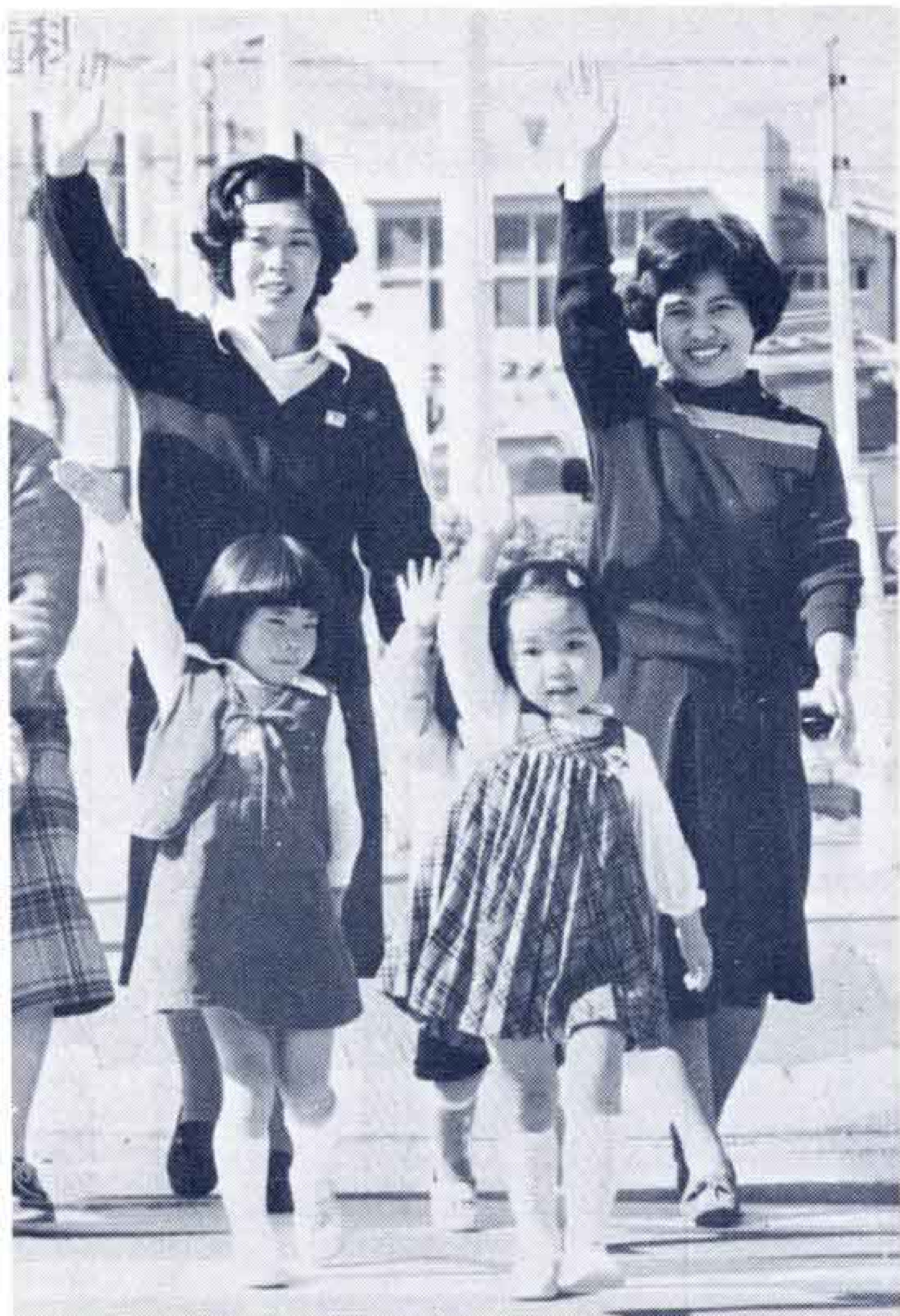
〔横断歩道は手をあげて〕

富士警察署では、ドライバーに対して、「飲むなら乗るな、乗るなら飲むな」の鉄則を自覚してほしいことと、家族やまわりの人たちにもこれを守ってほしい——と強く呼びかけています。