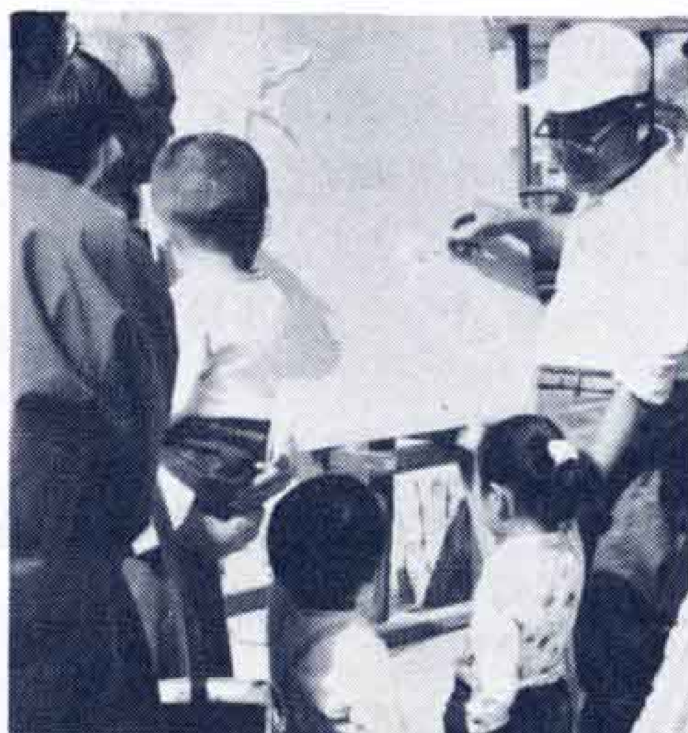
昨年の技能フェスティバル