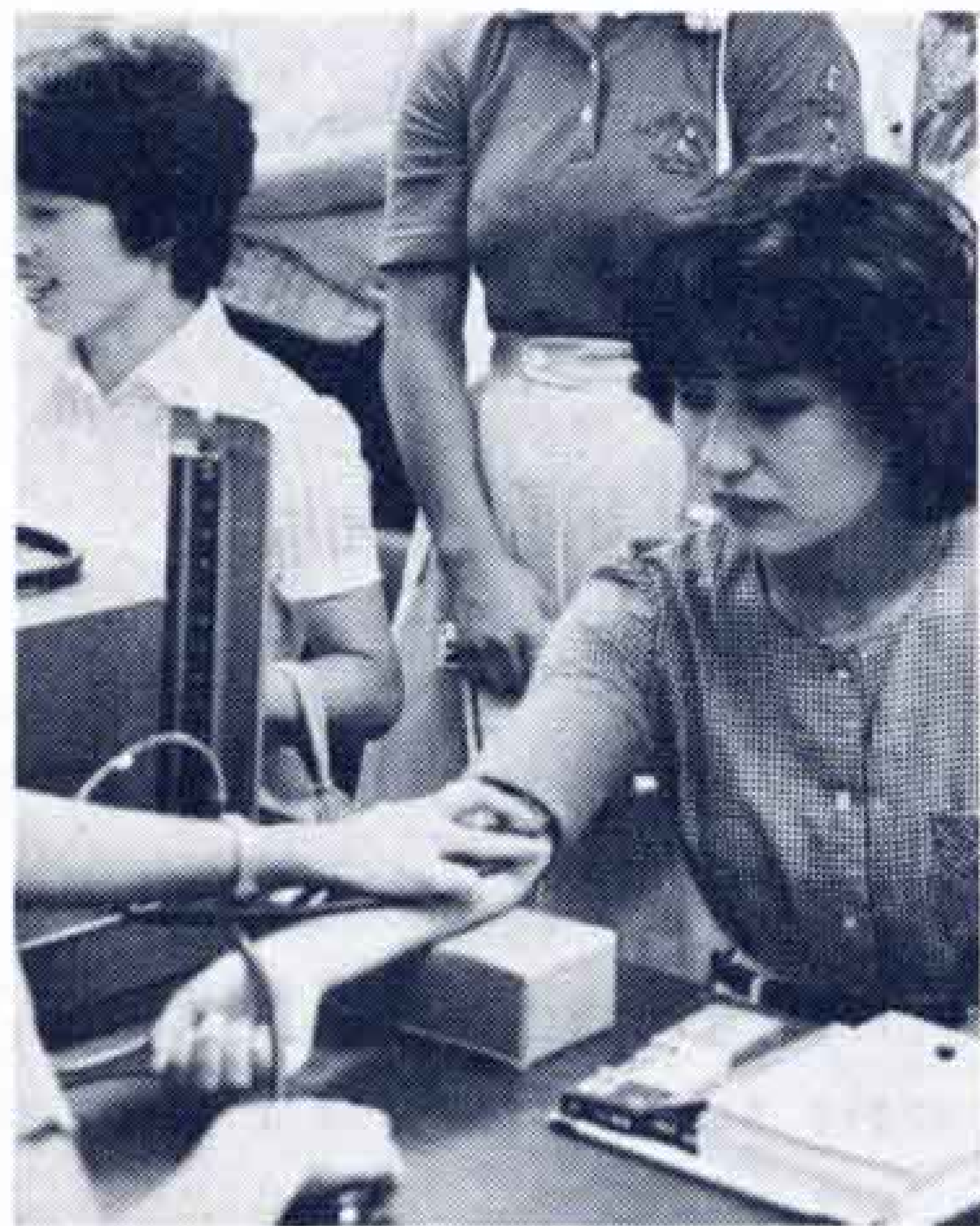
定期的な健康診断を

このように問題は早期発見です。これには、定期的に検診を受けるしか方法はありません。