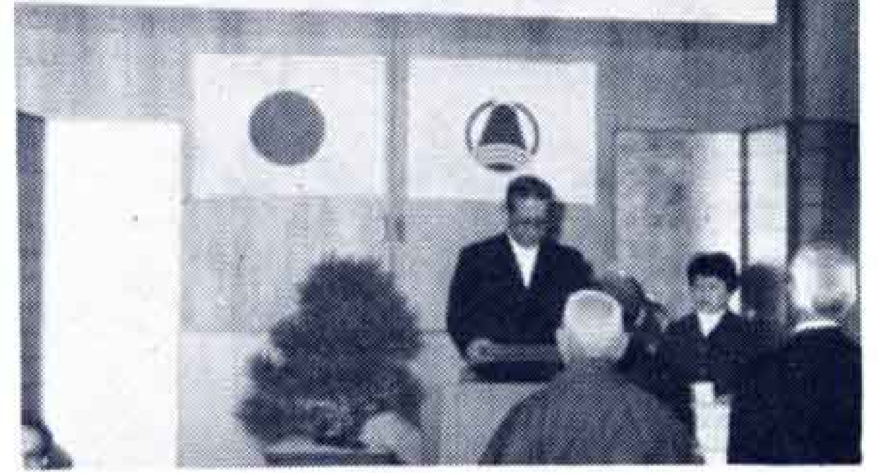
昨年の技能功労者表彰