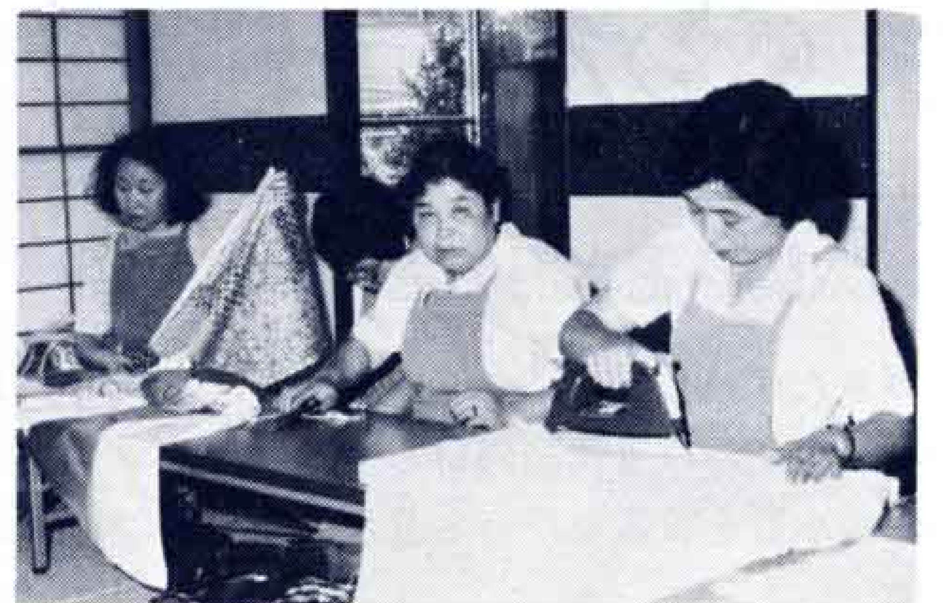
寝たきり老人のオムツをつくるボランティア