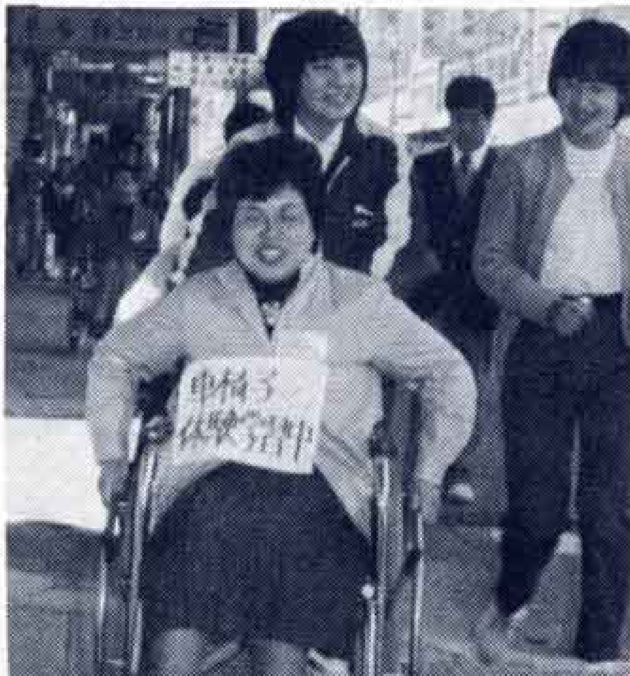
◀車イスに乗っていただき体験を たつた5センチが断崖に