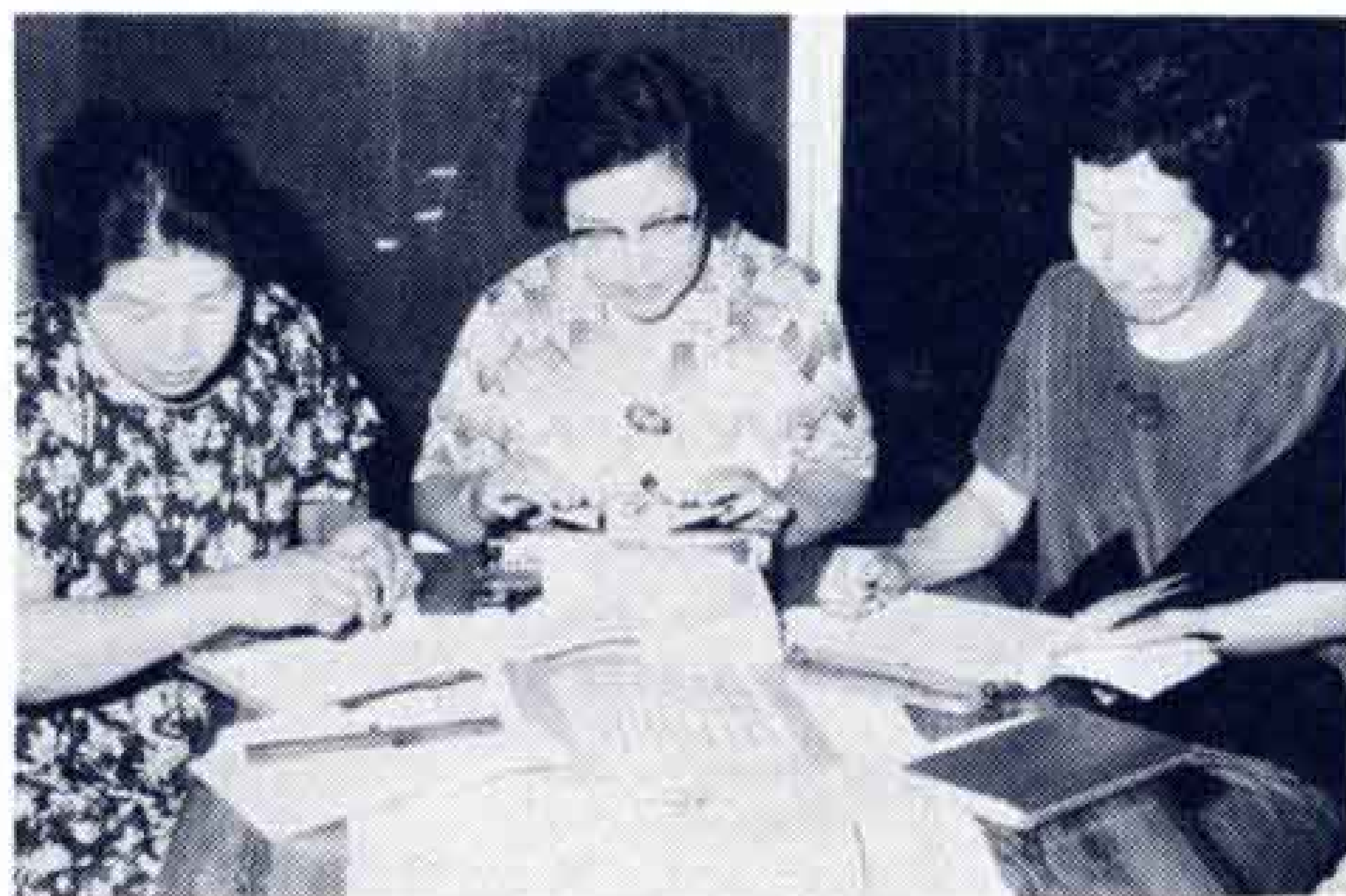
点字本づくりのボランティア