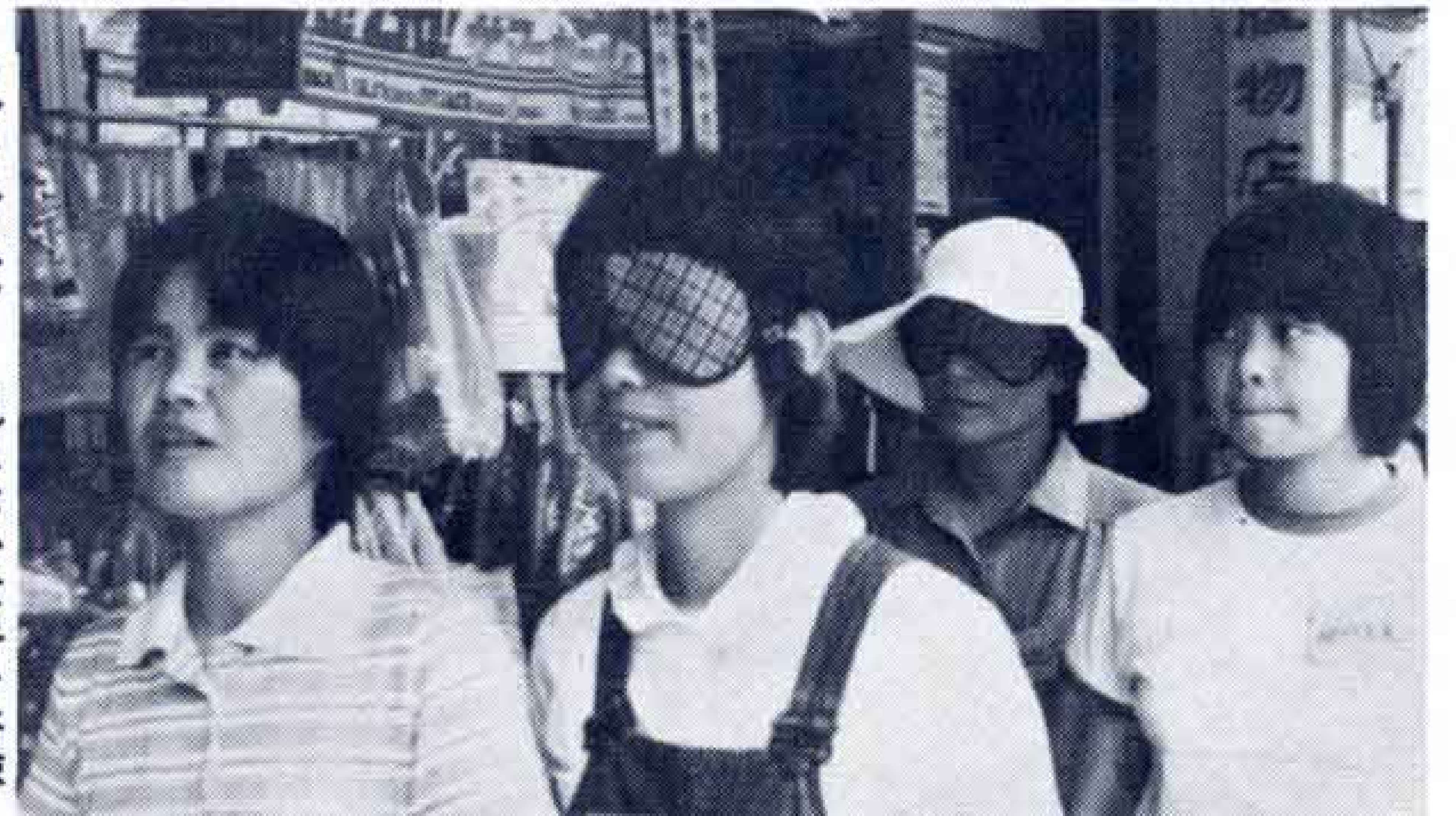
▶アイマスク—見えない世界を体験