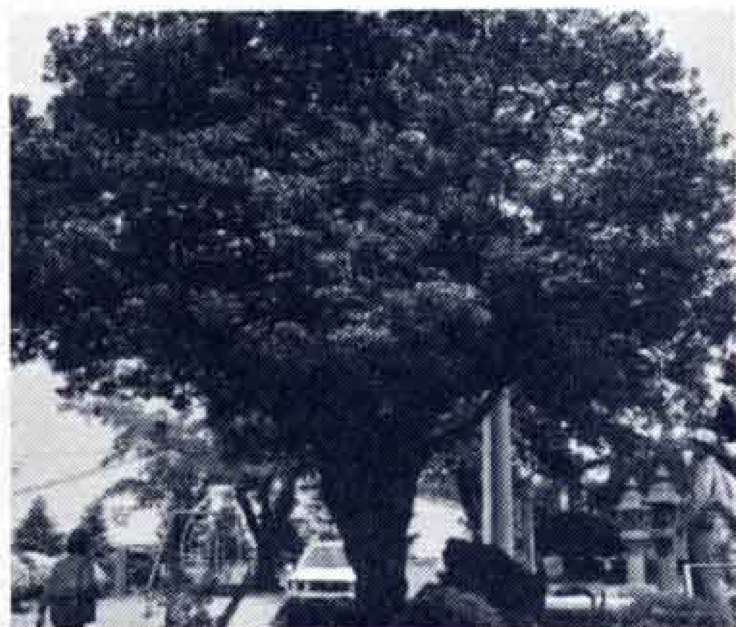
次郎長 白髭神社のヒイラギ

木之元神社のムクロジは、高さ11.6m、太さ1.8mあり、樹勢はよく珍木として市内では貴重な存在です。