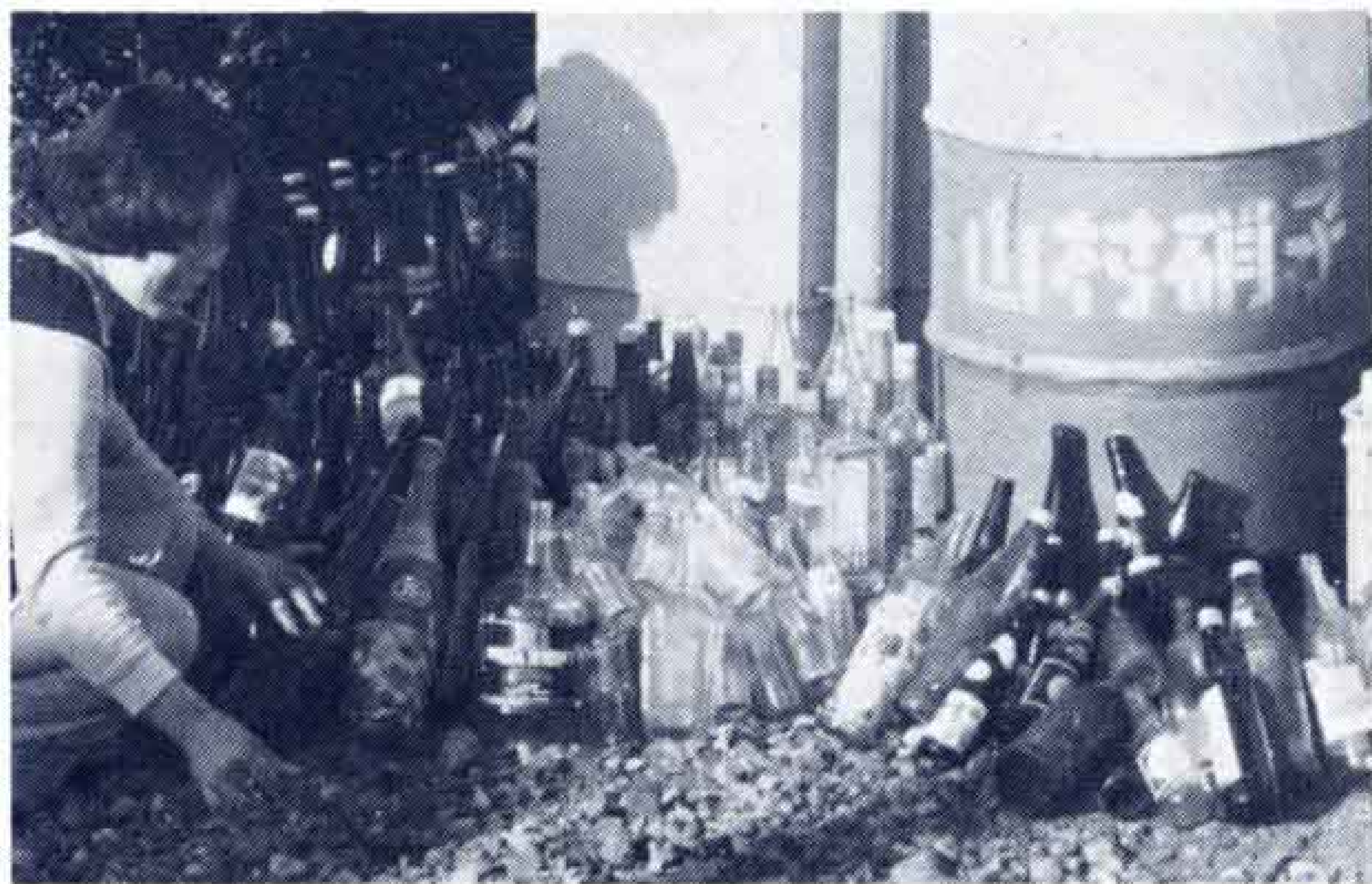
ごみも分ければこのように…