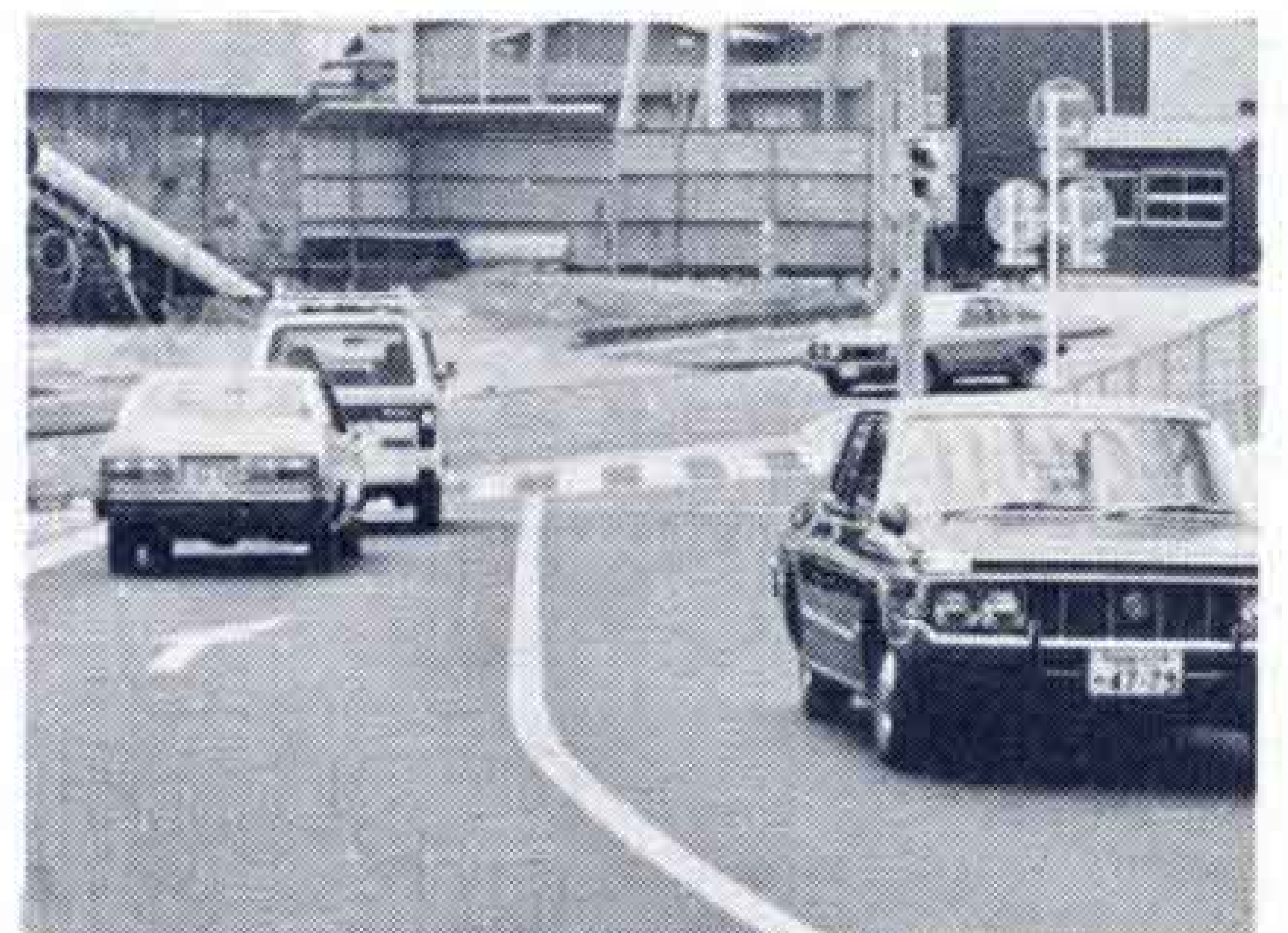
国道139号線と結ばれた伝法～原田線

同線の開通によって、吉原市街地を通過することはなく原田方面と鷹岡方面が結ばれるので、吉原市街地の交通渋滞が緩和されるものと期待されます。なお、国道139号線との接続部分は、T字路となっているため、富士宮方面へ向かう139号線からの右折と、374号線からの左折はできません。