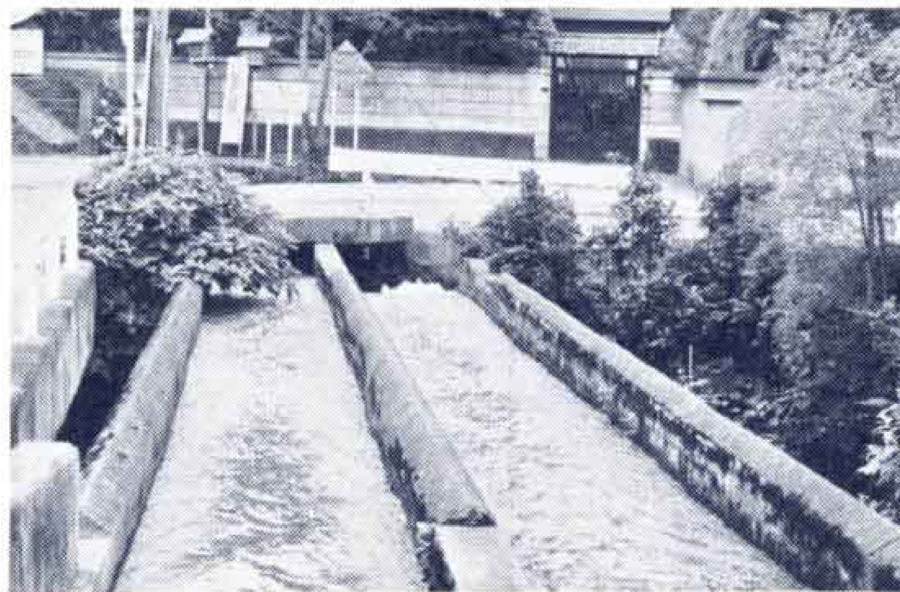
凡夫川にかかる二本樋