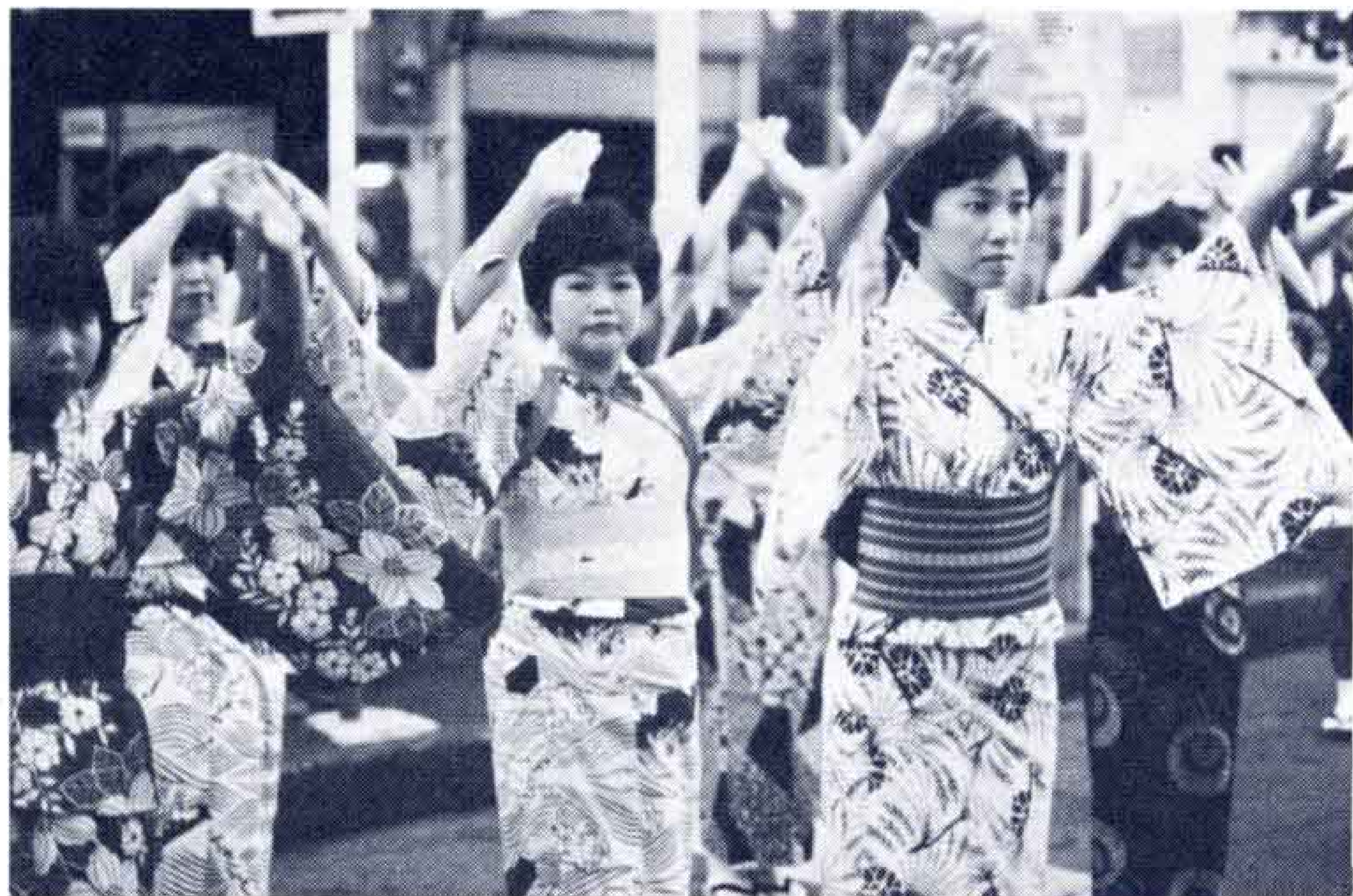
富士山ながめて オチャチャのチャ