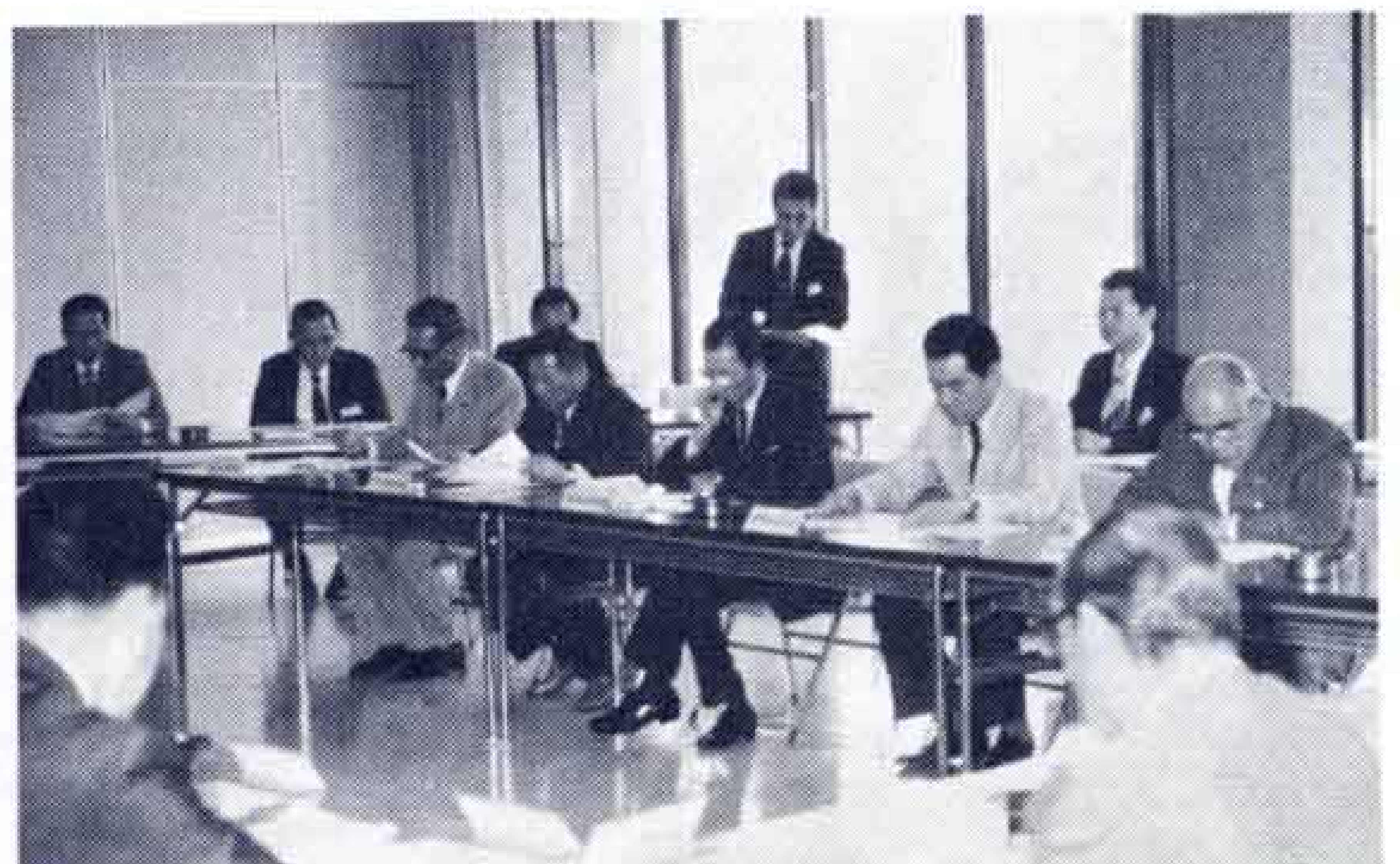
〔新幹線富士駅設置の強い声が…〕

新幹線富士駅設置を一という声は、昭和45年ごろから高まり、47年に二市二町の連合町内会が母体となり、準備会を結成、活動を行ってきました。今後は、期成同盟会を中心