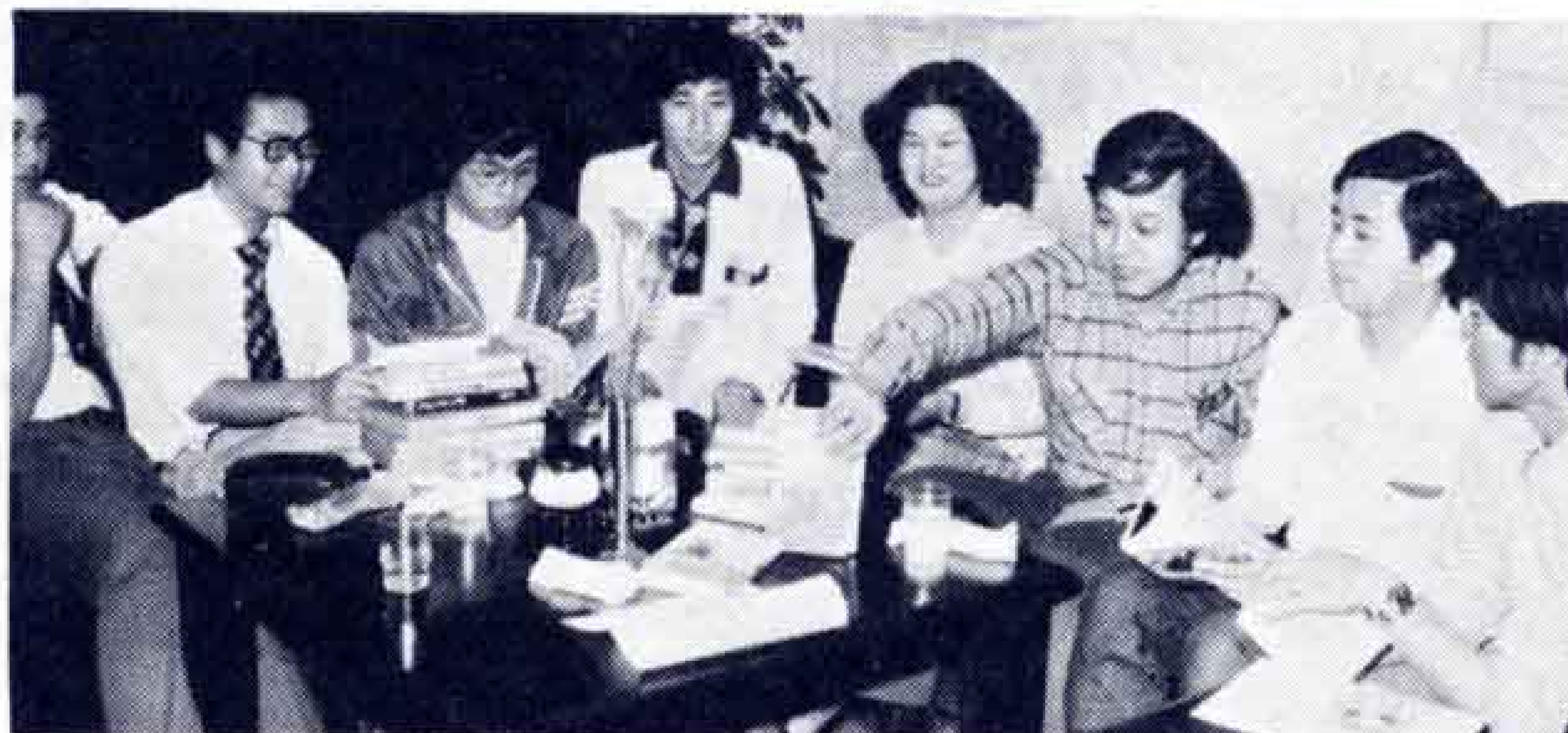
〔本を持ちよって喫茶店での例会〕

それまであった富士SF友の会を発展させて「銀河亭宙食会」が発足したのは昭和54年。以来月2回の例会と月1回のSF小説の読書会が続いている。自分だけではしまっておけないSFの感動、それを受け入れ共感してくれる仲間がいる。メンバーの誰にも共通する気持ちなのだろう。手づくりの機関紙・誌からもそんな雰囲気を読みとれる。プロ顔負けのイラストが随所に見られる。