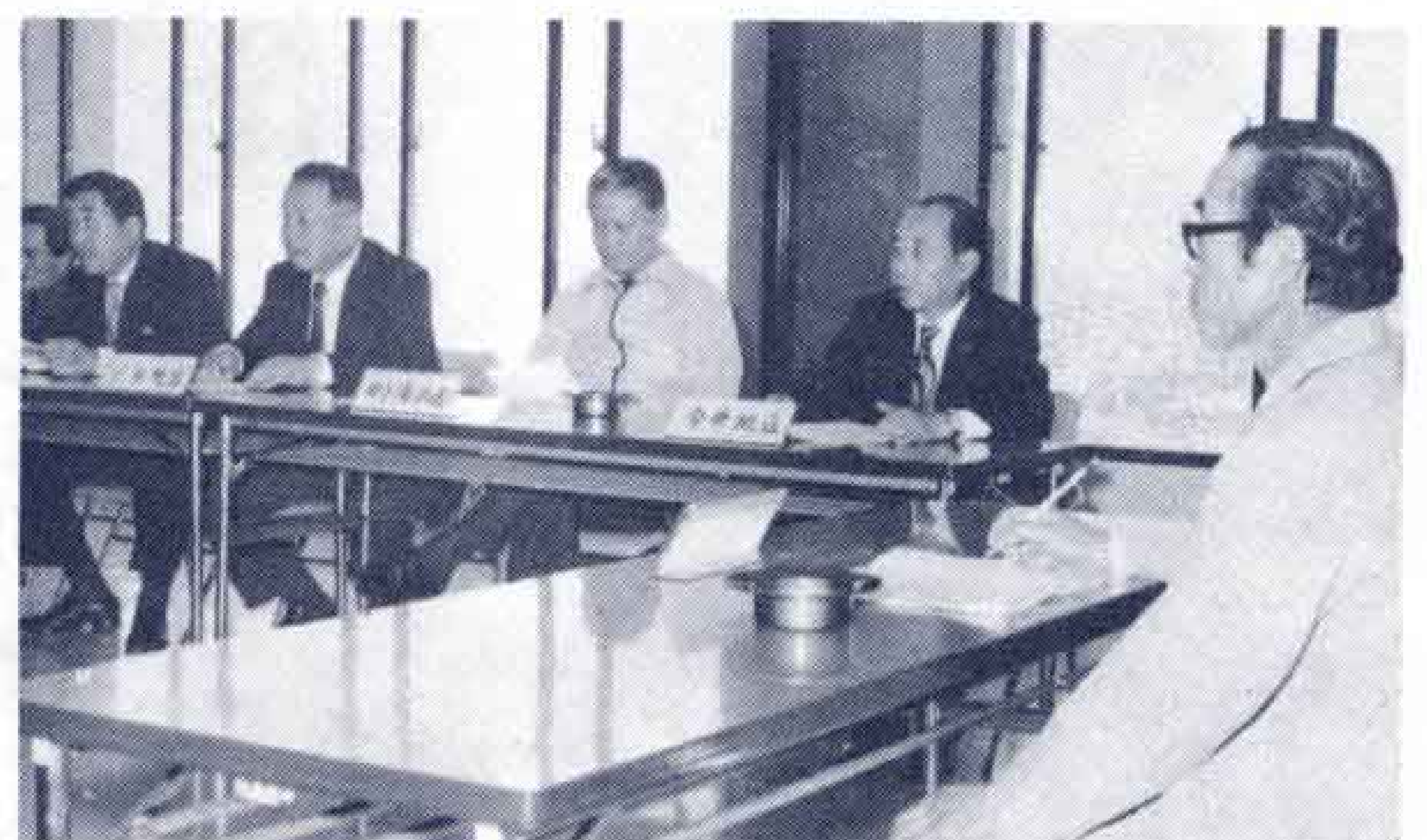
〔公害防止に対する意見交換が…〕