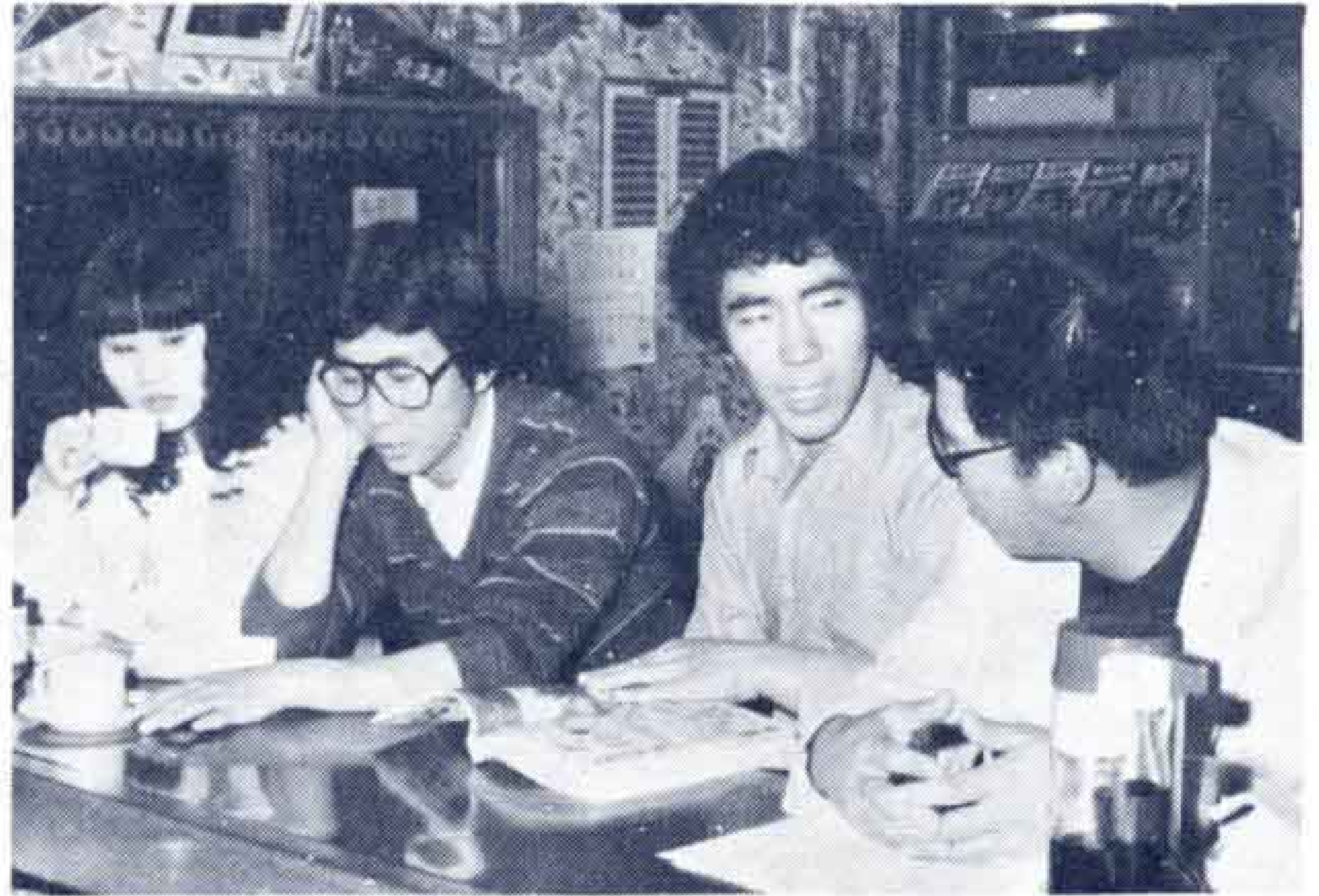
ホームの喫茶室で語る若人