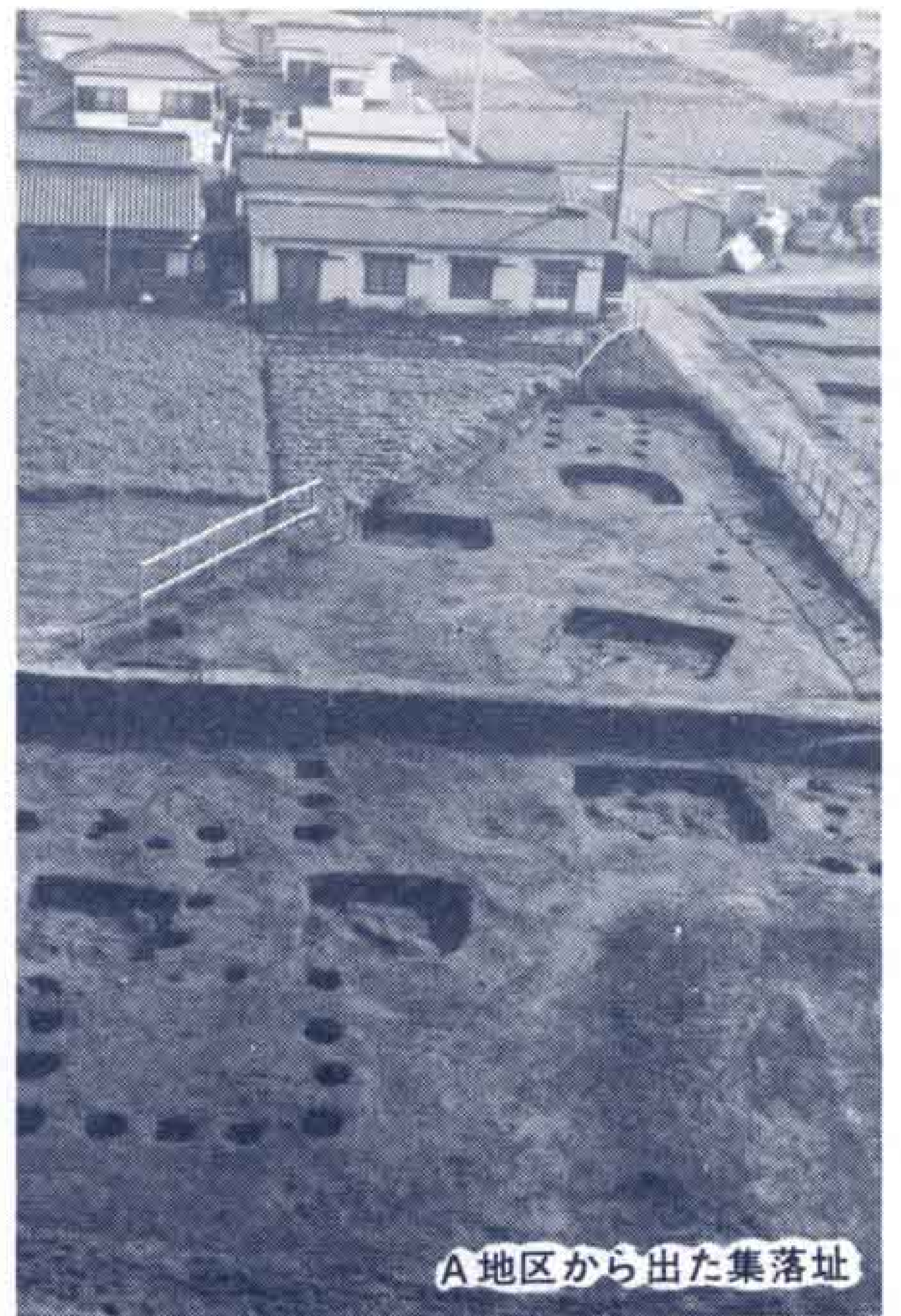
A地区から出た集落址

(現在の法律)に基づき天皇を中心とした中央集権の政治が強くおし進められていました。そのため地方の人々は、律令に基づく税負担や労役に窮々とした生活を送っていたと思われれます。この東平遺跡も他の遺跡と比べ規模がきわだって大きいことから、律令体制での地方の中心的役割を果たしていた集落だったと想像されます。