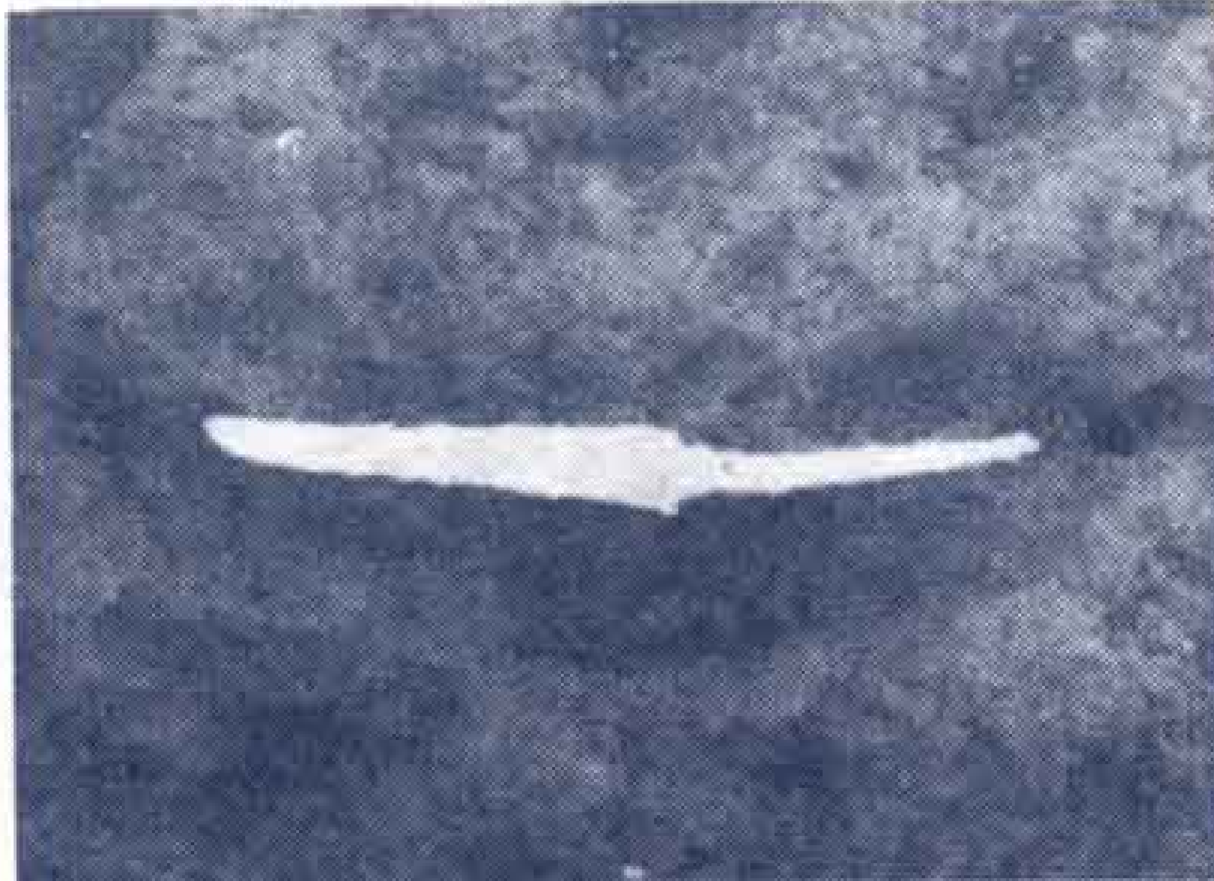
【住居址から出土した小刀】