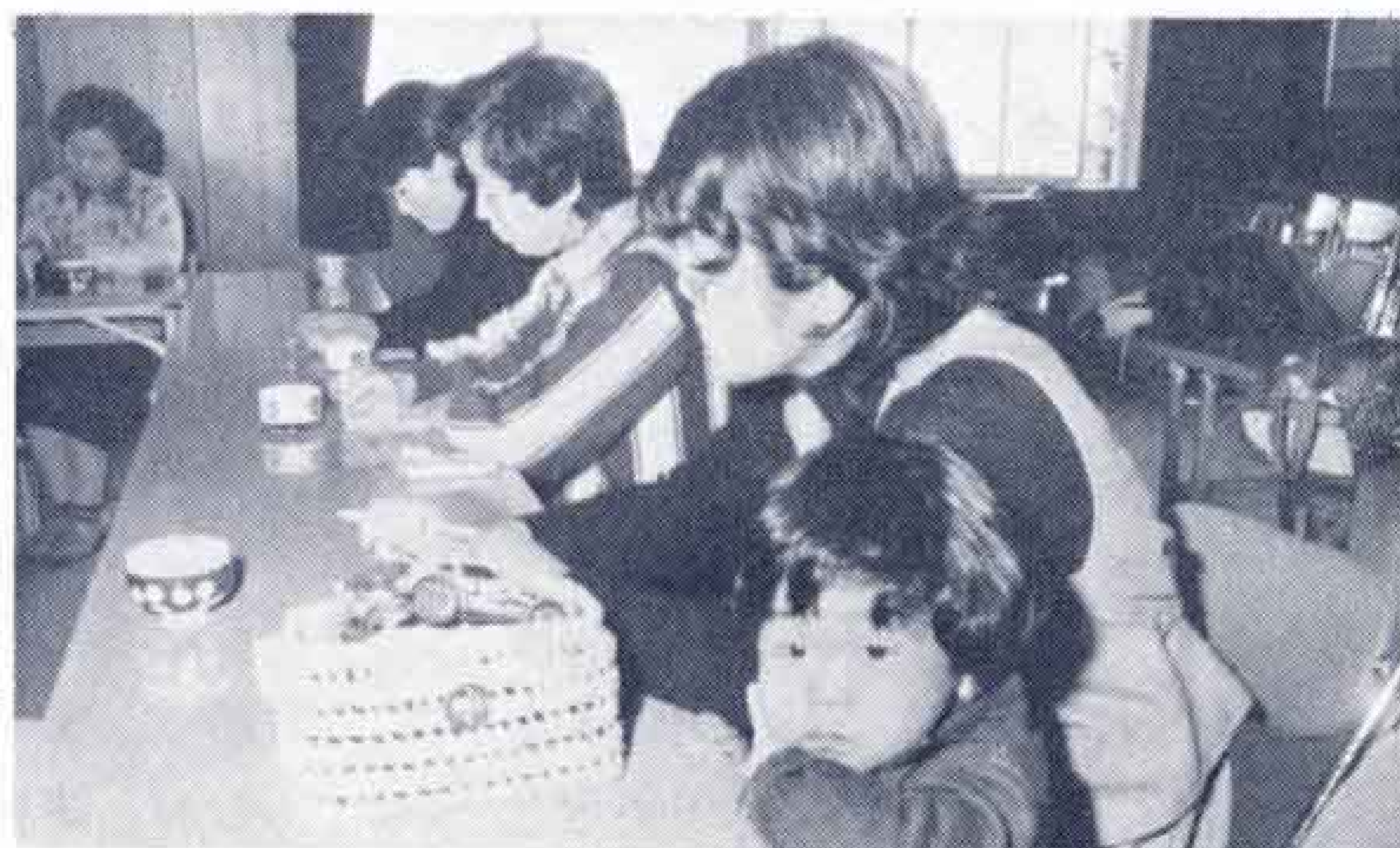
（ママといっしょにボクも学習）

これまでに、地域の歴史を訪ねたり、ケーキやそばづくりの実習にとりくんできたほか、製紙工場やハム工場の見学など行動を兼ねた学習を行ってきました。また、本読みボランティア活動として、放課後の小学生のために、読書会をやっていることが特色です。紙芝居もそうしたとりくみのひとつ。中でも手づくりの人形劇は近ごろ人気上昇中。市の文化祭にも参加しました。