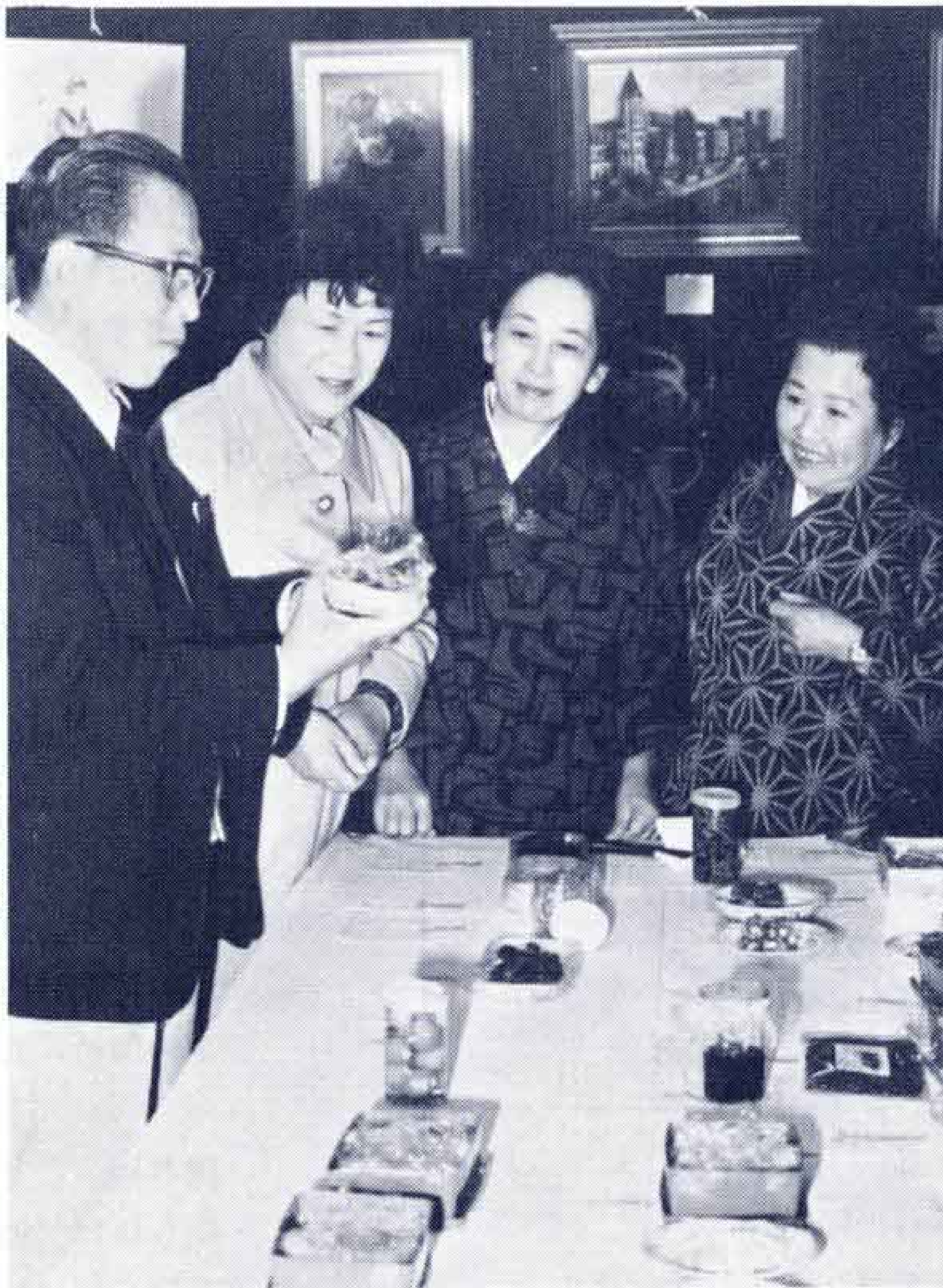
須津地区文化祭 大豆・ゴボウなどの自然食品を展示