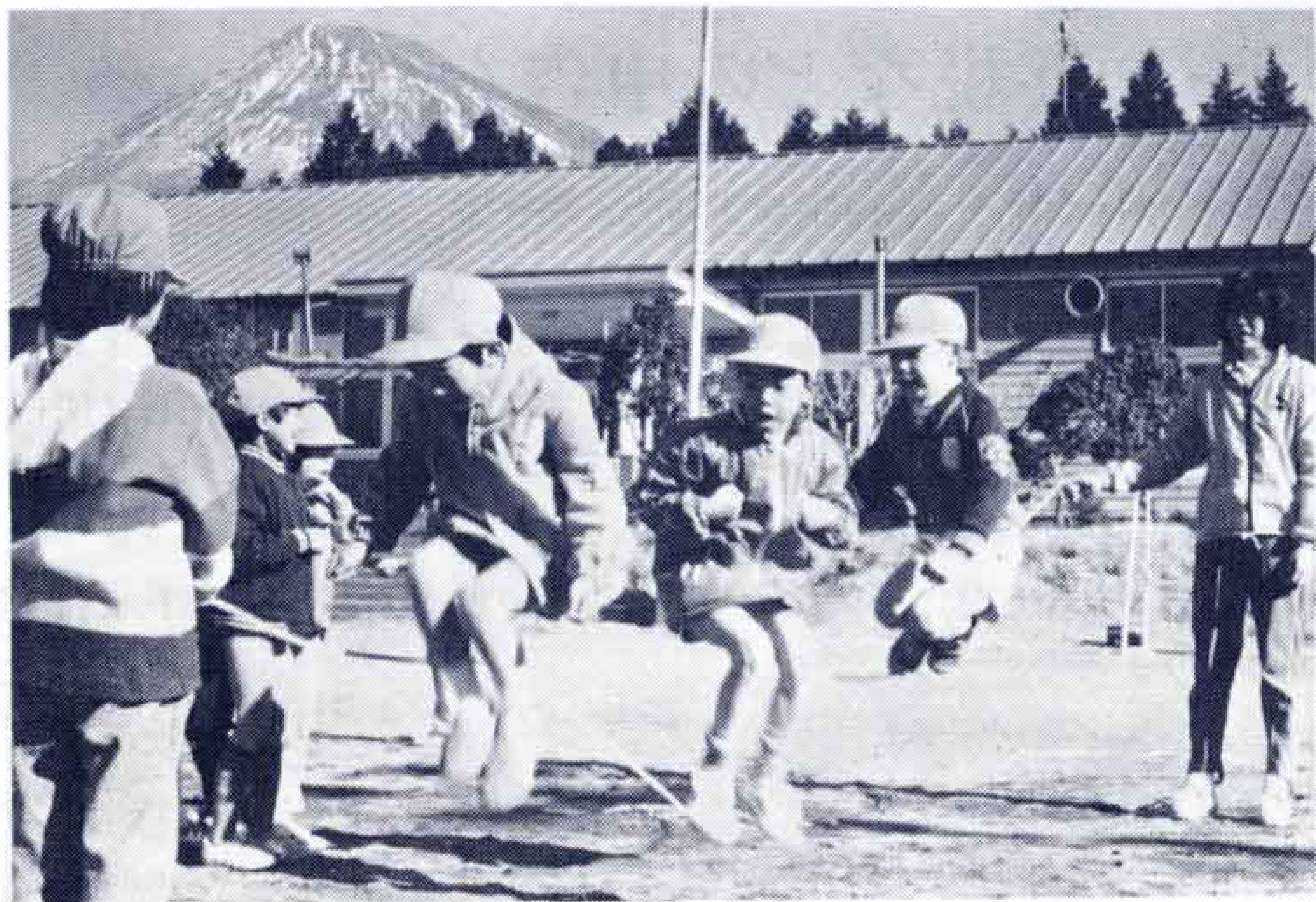
大淵二小の児童たち81人は、なわとびで体力づくり