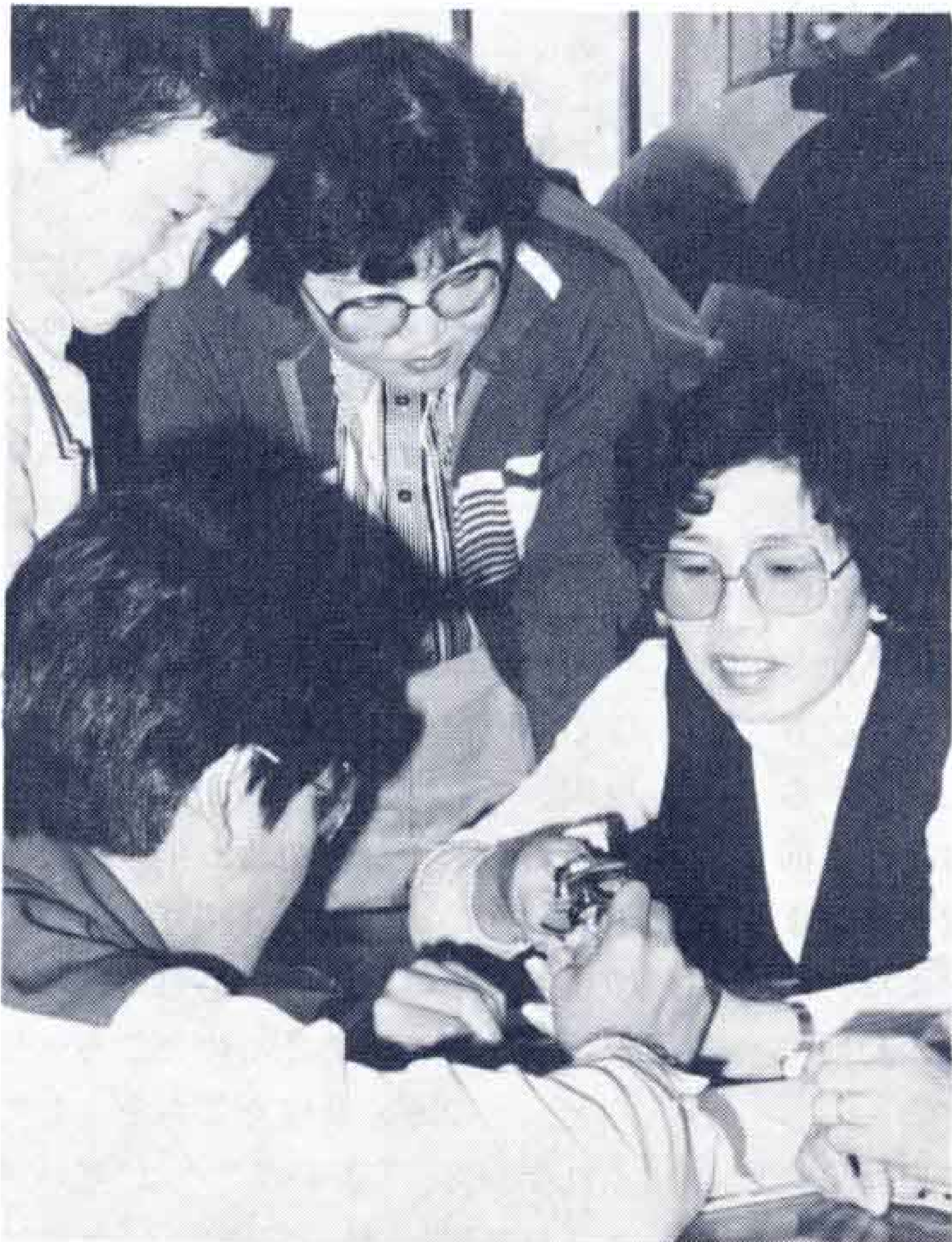
「住まいの奥様大学」で水道蛇口のバツキン取替えを習う主婦たち