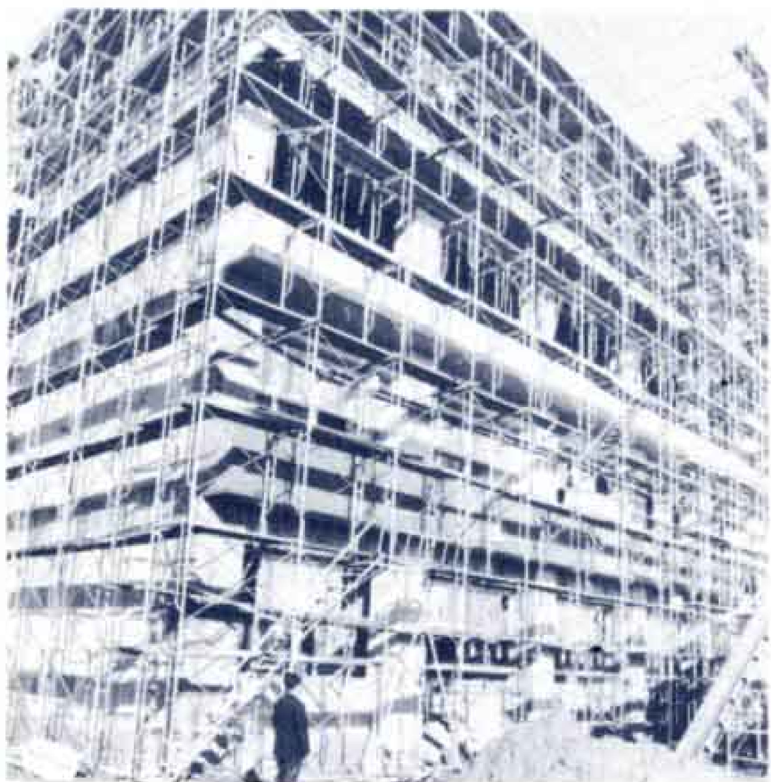
仮称市立吉原北中学校