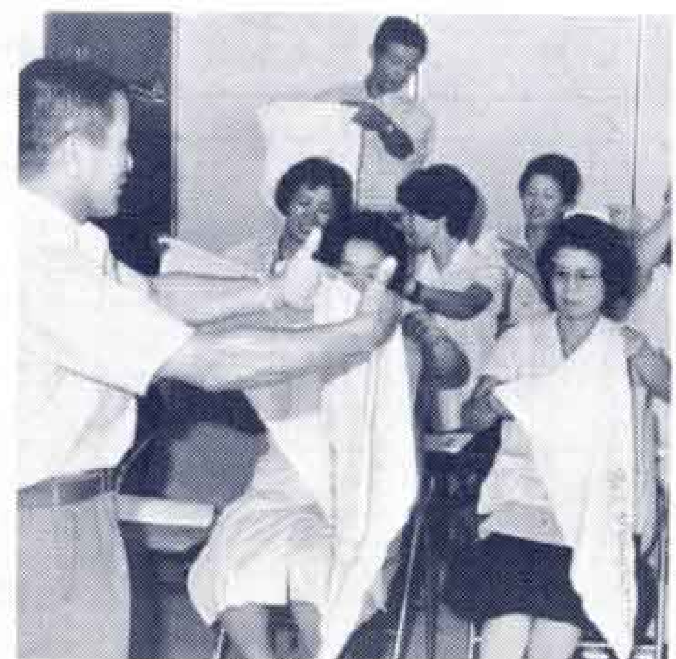
三角巾の使い方を習う市女子職員