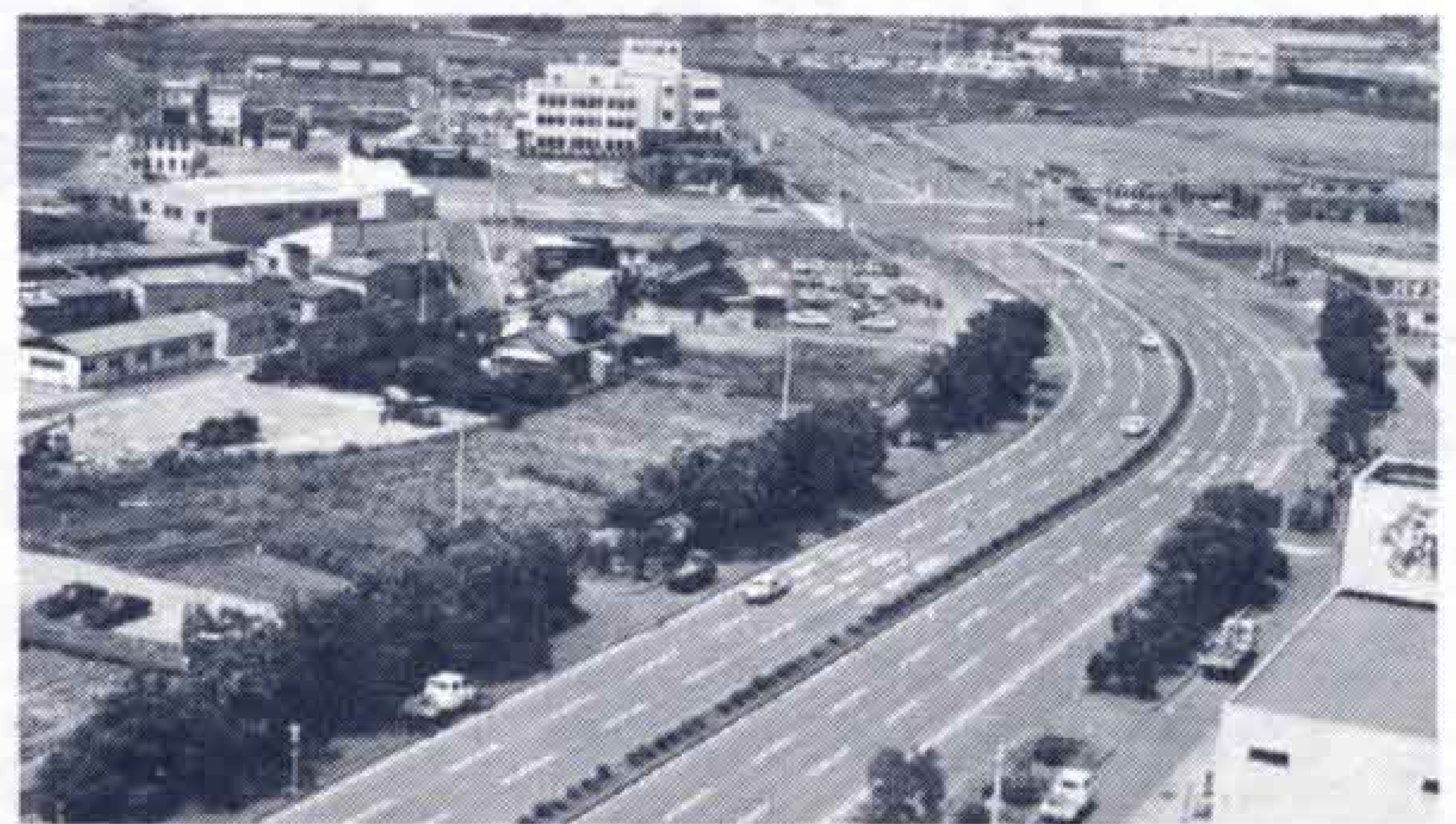
【依田原新田区画整理】