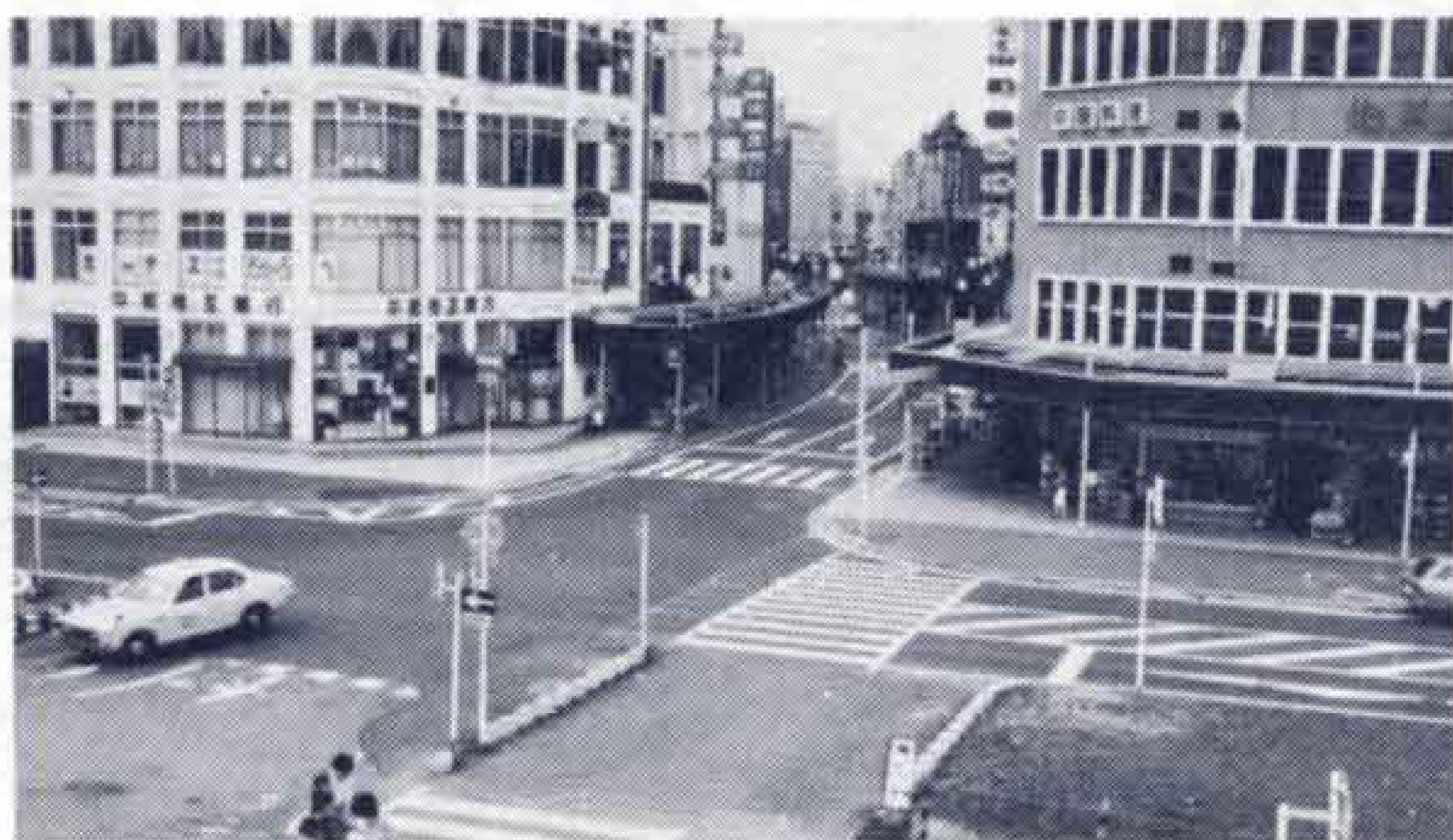
【整備がすすむ富士駅前広場】