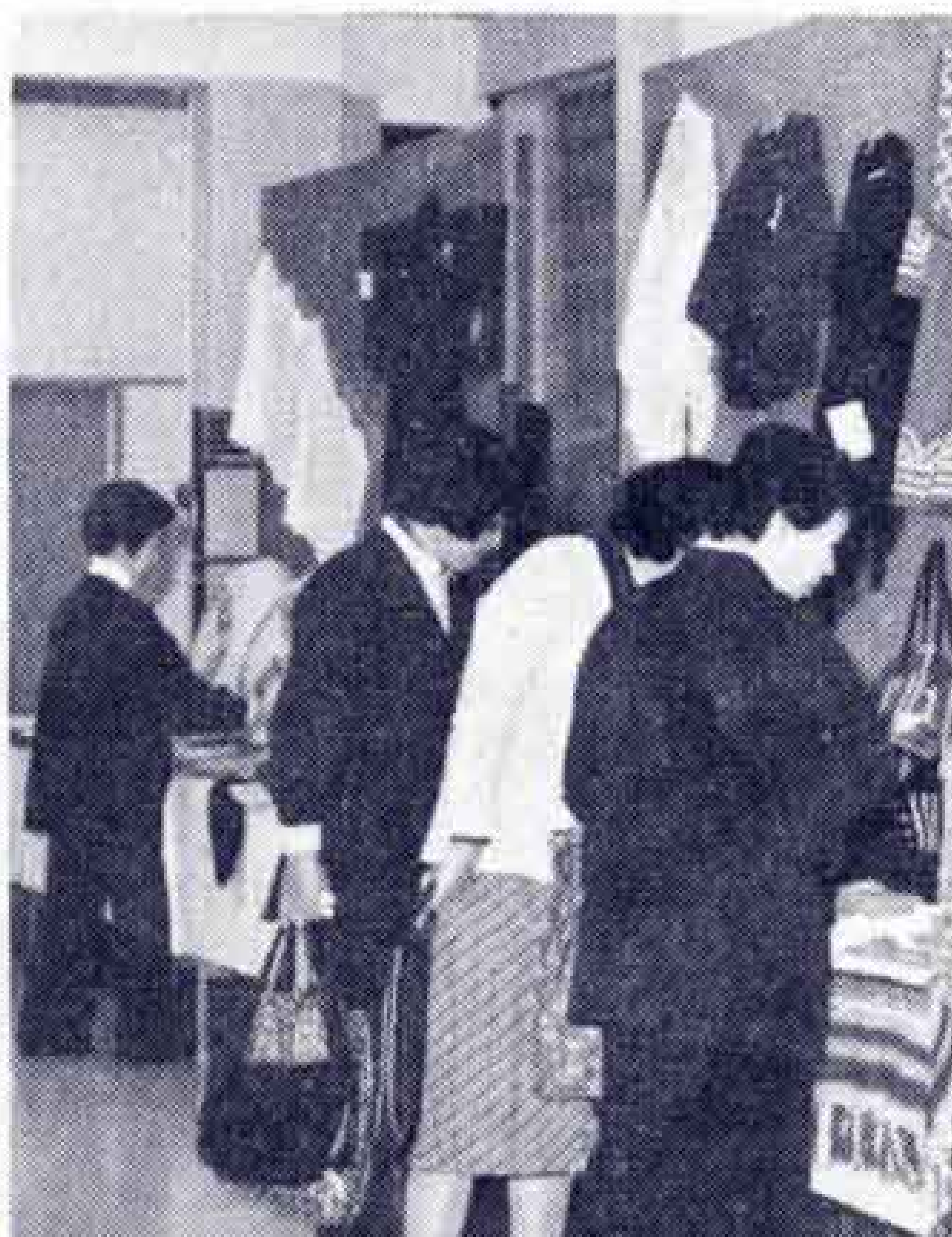
【写真・熱心に芝居を演じる青年祭と賑う婦人祭の一コマ】