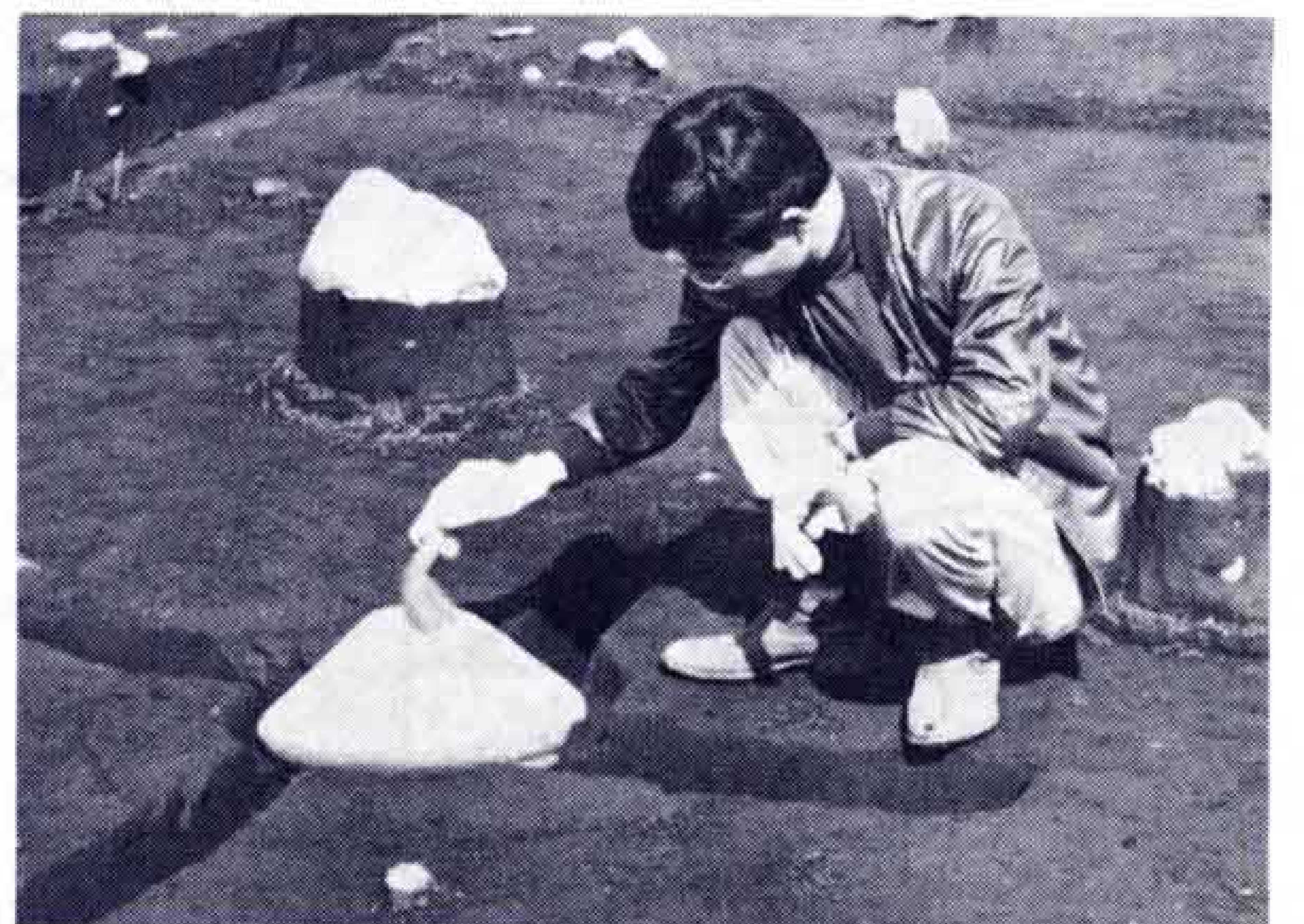
【写真・完全な形で出土された埋瓶】

配石遺構がたくさん発見され、当時の墓地であったことが確認されます。またこの遺跡は、縄文時代中期の生活様式を知るうえで貴重な遺跡です」と話しておられました。