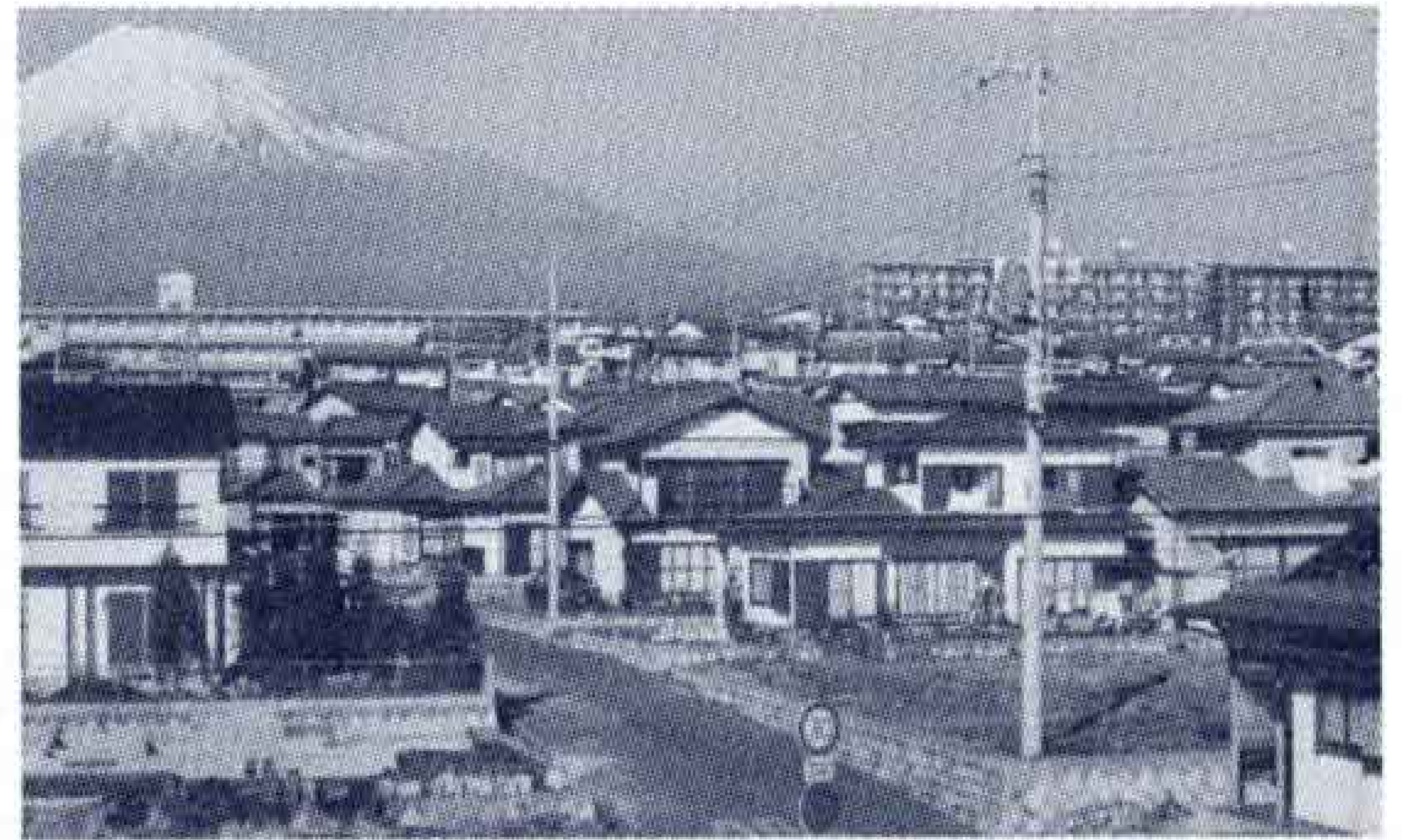
【写真・マンモス化する富士見台団地】

新年度は、不況対策として最も緊急な金融対策に特段の力を入れ、今まで要望のとくに多かった小口資金の貸付限度額について県及び信用保証協会と再三にわたる協議の結果、200万円を300万円に引き上げられ、これに伴う資金預託の増額をはかるとともに、地場産業対策の一環として県中小企業緊急不況対策融資制度による助成を措置しました。