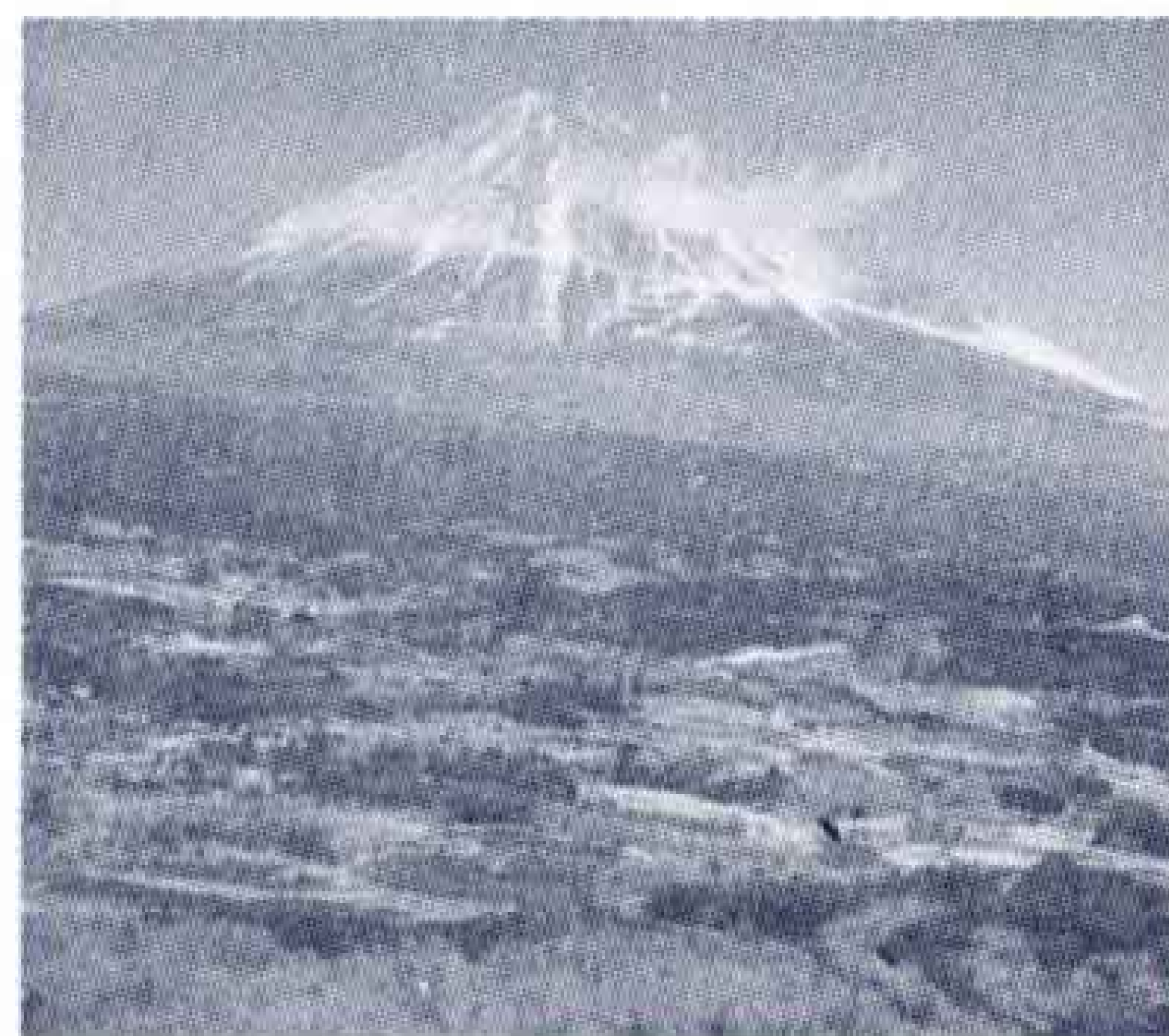
【写真・富士愛鷹山麓に広がる大自然】

公害防止対策は、これまで市民生活最優先の立場から、これらに懸命の努力を重ねてきましたが、なお多