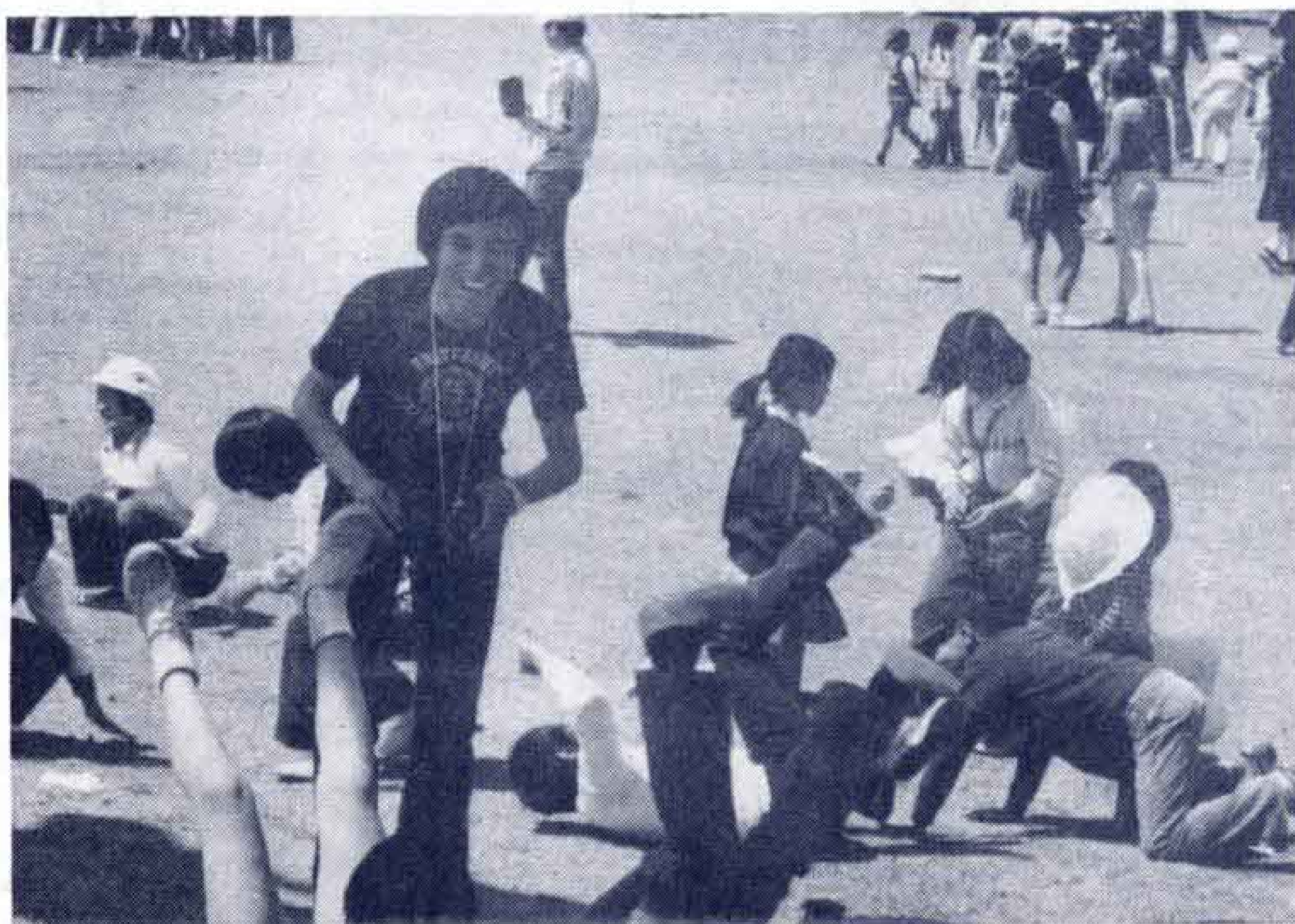
【それでもこどもは無心に遊ぶ】

女子は男子にくらべて仲間の数が少なく、ひとりぼっちで遊んでいる子どもも多いようです。また、全体的に見ると、仲間の数はむかしより、だんだん減っているように見受けられます。