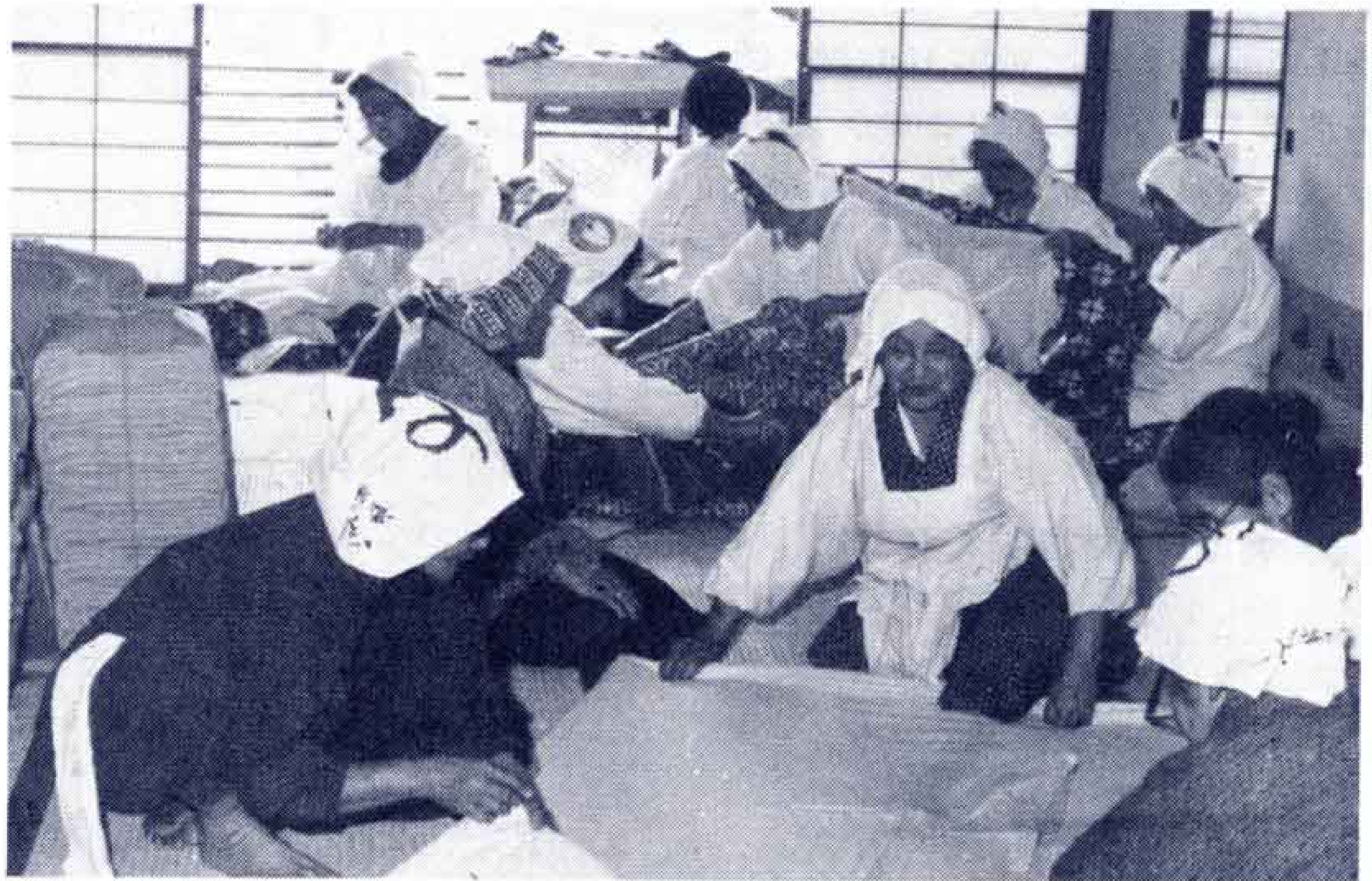
【おとしよりが善意のふとんづくり】

つくり、青少年の家へトラックで運びました。おとしより達は、昨年70枚位のふとんを修理しましたが婦人会とわたし達のこのささやかな善意が子ども達に通じて、みんなが立派なおとなになり、よい市民になってくれれば……と楽しそうにふとんづくりにはげんでいました。