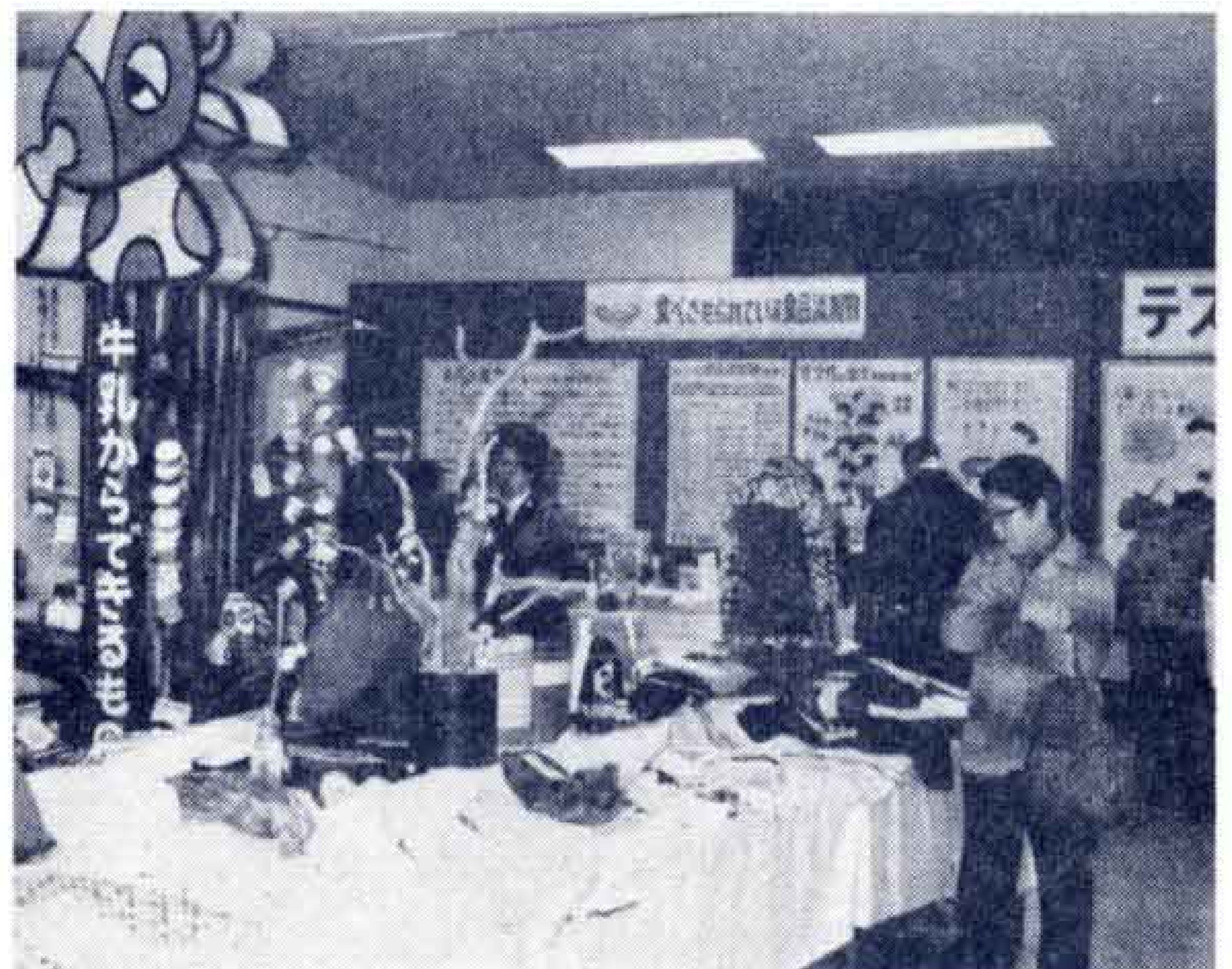
【にぎわった展示会場】

市と消費者運動連絡会主催の「くらしの中の消費者展」が3月5日と6日の両日、吉原市民会館で開催されました。日常生活の中で資源を考え、価格を考え、暮らしを考えようとたくさんの展示品が並べられ、食品テストコーナーも人気を集めました。このほか、手作り食品の実演や、青果、鮮魚の即売など台所をあずかるおおぜいの主婦でにぎわいました。