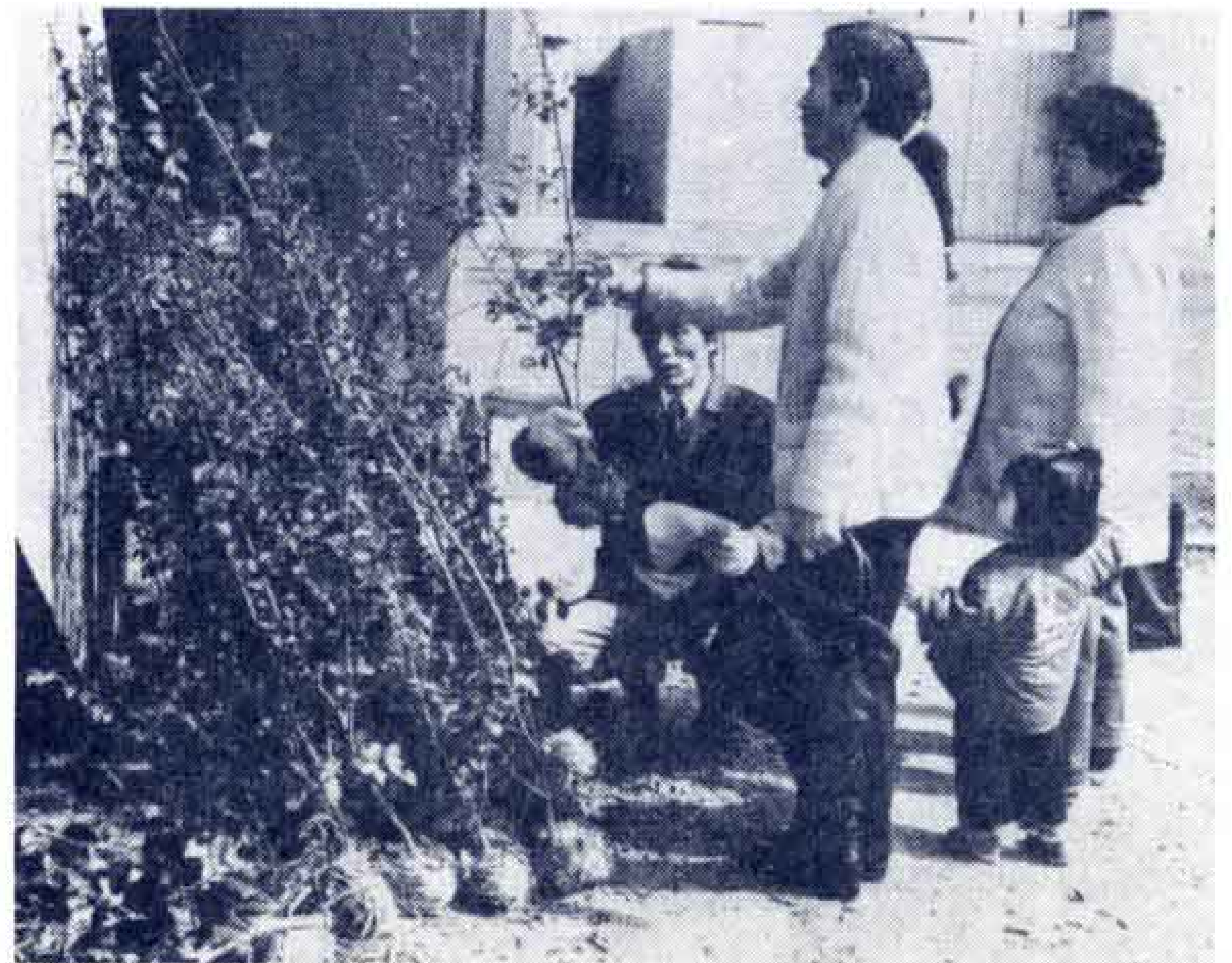
【サザンカも大切に育てて…】

こどもの誕生祝に、わが家の庭に市民の推奨花サザンカの苗を植えましょう……と、市が3年前から行っている苗木の無料配布が、ことしも行われました。ことし対象となった赤ちゃんは市内で3594人、赤ちゃんとともにすくすく成長するサザンカがこれから楽しみです。