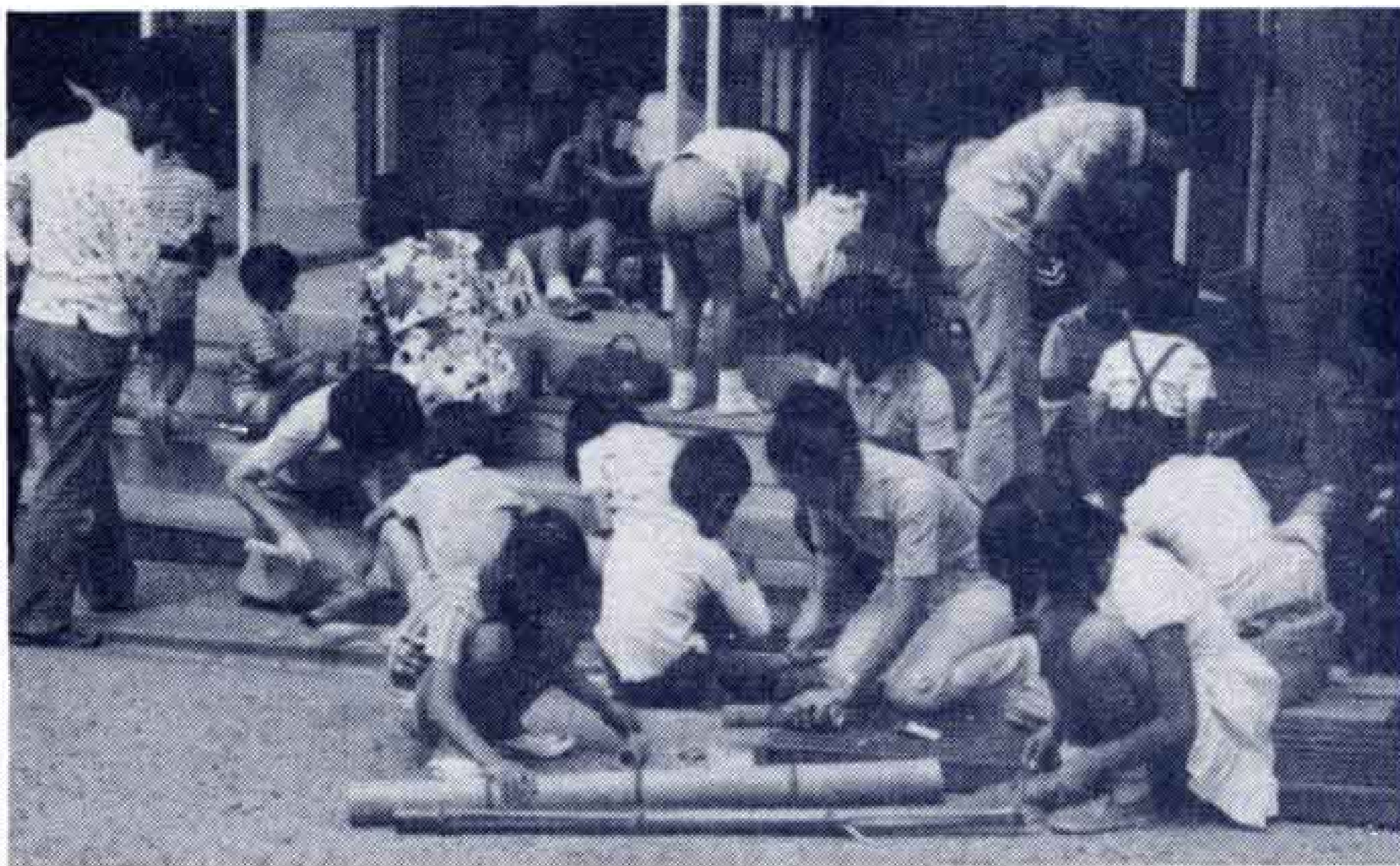
【親子のふれあい少年ふるさと学級】

● 母と子の読書活動 母と子が一緒になって同じ本を読むことによって良い本を正しく理解する力を養うとともに母と子のふれ合いを大切にする活動です。