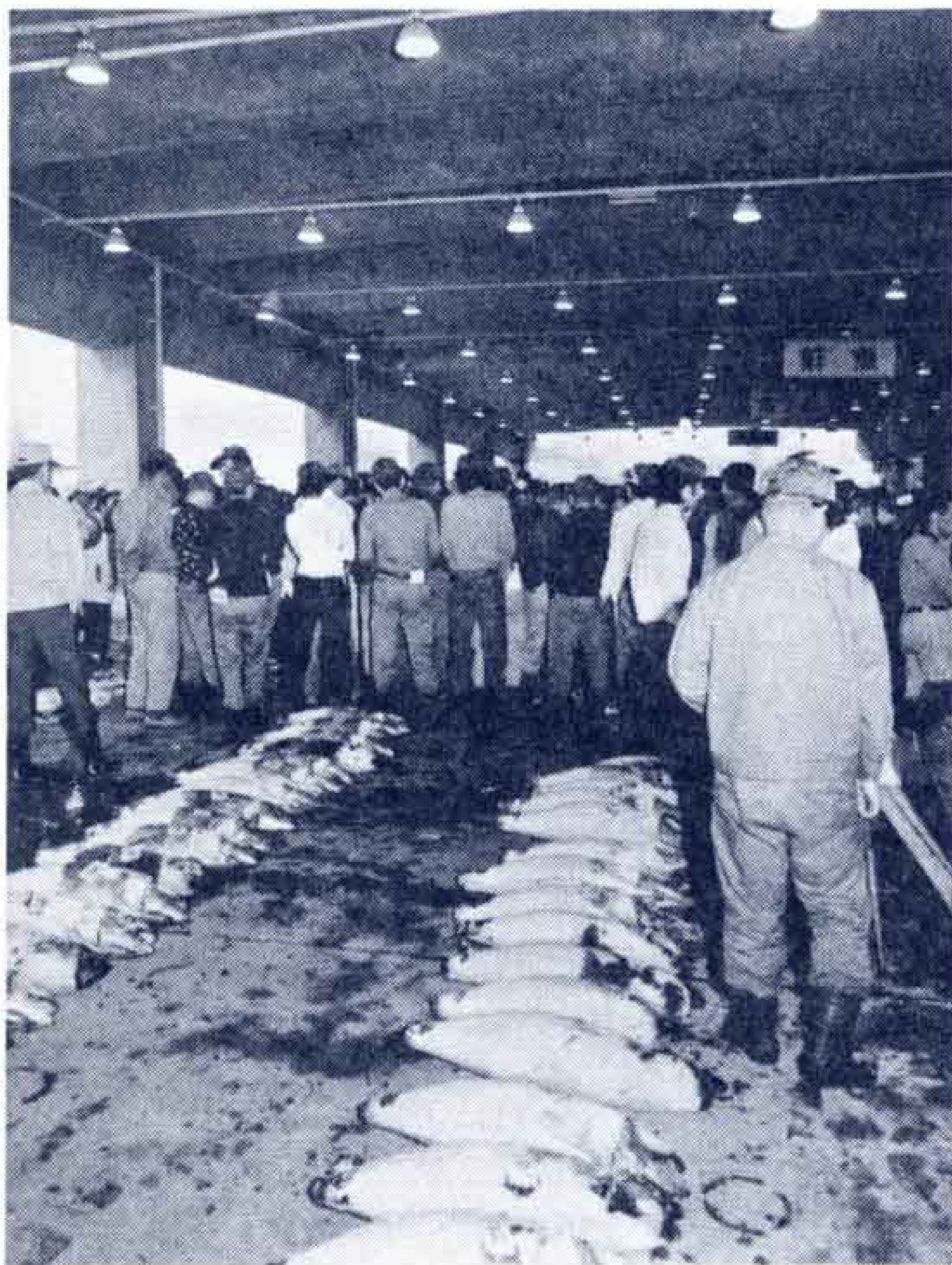
【大物もずらりそろった水産部】

設地方卸売市場で、岳南地区における生鮮食料品流通の拠点として、関係地域の住民福祉と生活の安定に寄与できるようその使命と責任を果たすとともに今後の大きな飛躍発展が期待されています。