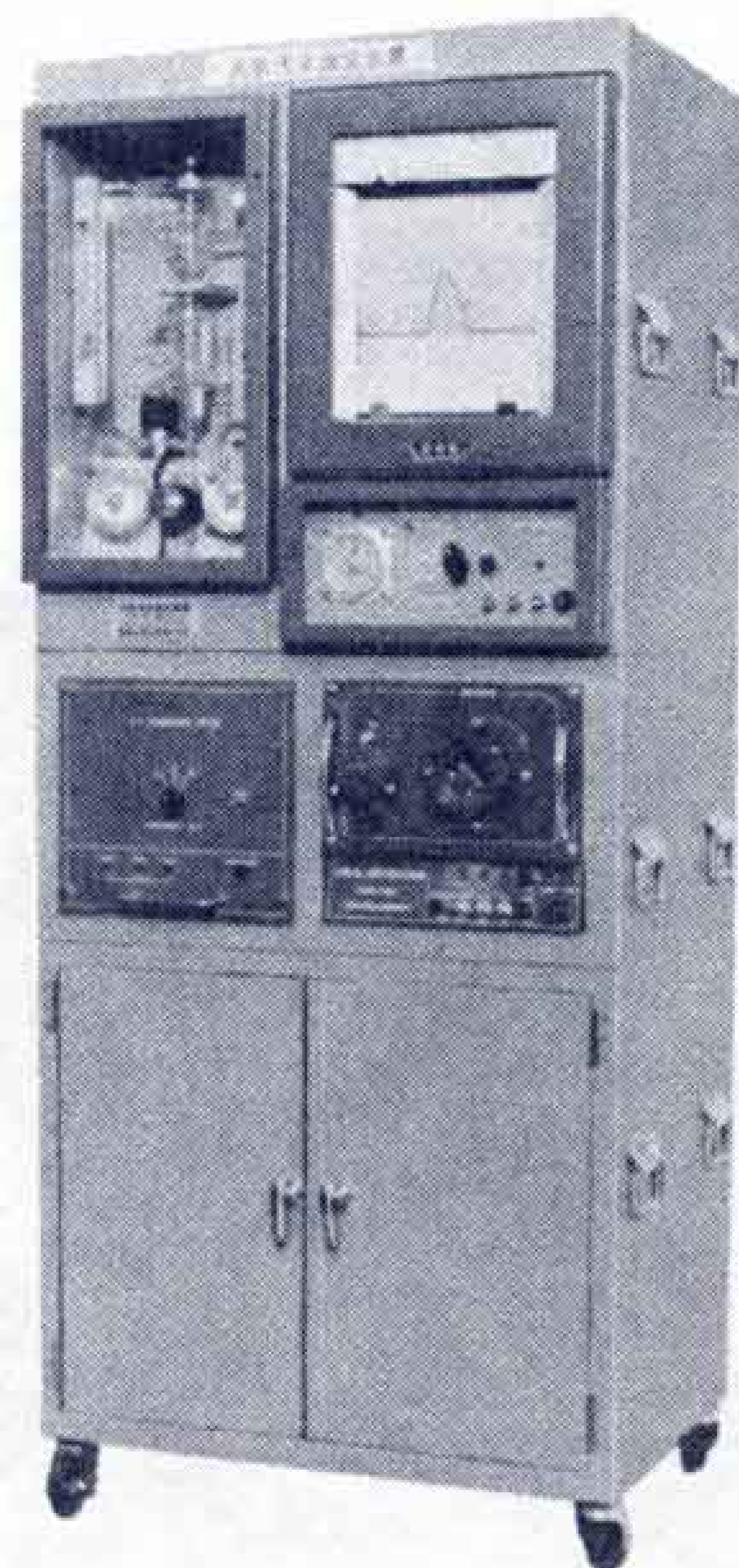
【大気汚染の測定結果はこの測定装置からテレメーターで市庁舎公書課へ】

などから見て二酸化硫黄対策は、更に綿密な削減計画を総合的見地から推し進めるとともに、大気環境の常時監視を一段と強化する必要があるといえましょう。